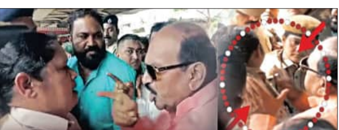
ରାଜ୍ୟ ବିଜେପି ସରକାରଙ୍କ ଆଭିମୁଖ୍ୟକୁ କଡ଼ା ସମାଲୋଚନା ସରକାର ବଦଳିଗଲେ ପୁଲିସ ଯୁନିଟ୍‌ମାନଙ୍କ ରକ୍ଷା ବଦଳେ ନାହିଁ ଆବେଦନକାରୀଙ୍କୁ ଜାମିନ ଦେଲେ ଶୁଣାଣି ପ୍ରଭାବିତ ହୋଇପାରେ ସର୍ବସାଧାରଣରେ ଉଦାହରଣୀୟ ବ୍ୟବହାର ରଖନ୍ତୁ ଜନପ୍ରତିନିଧି