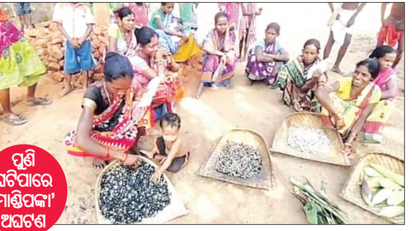
ପୁଣି ଘଟିପାରେ 'ମାଣ୍ଡିପକା' ଅଘଟଣ

ବାଲିଗୁଡ଼ା, ୧୦.୧୧.୨୦୨୪(ସମ୍ପାଦକ): ୪ ମାସ ହେଲା ମିଳିନି ରାସନ୍ ଚାଉଳ। ତେଣୁ ଭୋକ ମୋହାଭାବ ପାଇଁ ଖୁସୀ, କରଡ଼ି, ଜଙ୍ଗଲୀ କନ୍ଦା ଓ ମକା ଭଳି ଜଙ୍ଗଲଜାତ ଉଦ୍ୟ ଏବେ ସେମାନଙ୍କର ଭରସା ପାଇଛି। ମାଣ୍ଡିପକା ପରେ ସେହି କନ୍ଦାମାନଙ୍କୁ ଖାଦ୍ୟଭାବର ଏମିତି ଆଉ ଏକ ବିକଳ ଚିତ୍ର ପଦାକୁ ଆସିଛି। ହୁମୁଡ଼ିବନ୍ଧ ବୁଦ୍ଧ ଭଣ୍ଡାରଟା ପଞ୍ଚାୟତର ଦୁର୍ଗମ ମାୟାଗୁଡ଼ା ଗ୍ରାମର ୧୮ ଆଦିବାସୀ ପରିବାର ସରକାରୀ ପ୍ରଚାରକାର ଶିକାର ହୋଇ ଏବେ ଏମିତି ଦୁର୍ଦ୍ଦିନରେ ଦିନ କାଟୁଛନ୍ତି। ମିଳିଥିବା ସୁତନାଦୁଆର, ମାୟାଗୁଡ଼ାର ଏହି ୧୮ ଆଦିବାସୀ ପରିବାରକୁ ଗତ ଲୁଲାଇ ପରଠାରୁ ୪ ମାସ ହେଲା ଚାଉଳ ମିଳିନି। ମନରେଗାରେ ମଧ୍ୟ କାମ ମିଳୁନାହିଁ ବର୍ଷା ଦିନମାନଙ୍କରେ ପାଖ ଗାଁକୁ ଯାଇ ବିଲରେ ମଜୁରି କରି ବହୁ କଷ୍ଟରେ ପରିବାର ପ୍ରତିପୋଷଣ କରୁଥିଲେ। କିନ୍ତୁ ବର୍ତ୍ତମାନ ଆଉ କୌଣସି କାମ ମିଳୁନି। କିଛି ଦିନ ତଳେ ପଞ୍ଚାୟତ ଅଧିକାରୀଙ୍କୁ ମିଳୁଥିବା ଖବର ପାଇ ସେମାନେ ଯାଇଥିଲେ। କିନ୍ତୁ ସେଠାରୁ ନିରାଶ ହୋଇ ଫେରିବାକୁ ପଡ଼ିଥିଲା ବୋଲି ସେମାନେ କହିଛନ୍ତି। ତେଣୁ ଭୋକ ମୋହାଭାବ ପାଇଁ ଏବେ ସେମାନେ ଜଙ୍ଗଲ ଉପରେ ଭରସା କରୁଛନ୍ତି ବୋଲି କହିଛନ୍ତି। ସେମାନଙ୍କ କହିବା କଥା, ଜଙ୍ଗଲରେ କରଡ଼ି, ଜଙ୍ଗଲୀ କନ୍ଦା ଓ ବାଡ଼ିର ଖୁସୀ ଓ ମକା ସଂଗ୍ରହ କରି ଚାହାକୁ ରାନ୍ଧୁଛନ୍ତି। କିନ୍ତୁ ଏସବୁ ଜିନିଷ ସବୁବେଳେ ମିଳୁନଥିବାରୁ ବେଳେବେଳେ