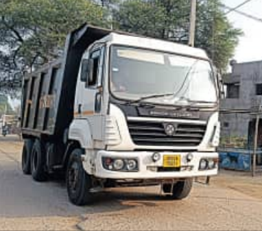
ଲାଗିଛନ୍ତି। ଯେତେ ଟନ୍(ଉତ) ବାଲି ଉଠାଇବାକୁ ଟେଣ୍ଡର ହୋଇଥିଲା ତାଠାରୁ ଶହ ଗୁଣା ଅଧିକ ବାଲି ଉଠାଇ ଚାଲାଣ ହୋଇ ସାରିଲାଣି। ଅନଧିକାର ଭାବରେ ବଙ୍ଗୋପୁଣ୍ଡା ସହରର ଜଣେ ବାଲି ମାଟିଆ