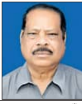
ଜ୍ଞ ମାୟାଧର ସାଲ୍

ବର୍ତ୍ତମାନର ସବୁଠାରୁ ବଡ଼ ପାରିବେଶିକ ସମସ୍ୟା ହେଉଛି ଜାଗତିକ ଉତ୍ତମା ବୃଦ୍ଧି ଏବଂ ତତ୍ଫଳନିତ ଜଳବାୟୁ ପରିବର୍ତ୍ତନ । ଅନ୍ତର୍ଜାତୀୟ ସ୍ତରରେ ଅନେକ ଆଲୋଚନା ଓ ବିନୀତି ପରେ ୨୦୧୫ ମସିହାରେ ପ୍ୟାରିସ୍‌ଠାରେ ଅନୁଷ୍ଠିତ ଜଳବାୟୁ ସମ୍ମିଳନୀରେ ଏକ ନିର୍ଦ୍ଧାରଣାତ୍ମକ ନିଷ୍ପତ୍ତି ନିଆଯାଇଥିଲା, ଯାହା 'ପ୍ୟାରିସ୍ ରାଜିନାମା' ନାମରେ ଜଣା । ଏଠାରେ ଏହି ଶତାବ୍ଦୀର ଶେଷ ପୂର୍ବା ପୃଥିବୀର ଉତ୍ତମା ବୃଦ୍ଧିକୁ ଶିଖି ସତ୍ୟତା ଆରମ୍ଭ ସମୟ ତୁଳନାରେ ୧.୫ ଡିଗ୍ରୀ ସେଲସିୟସ୍ ମଧ୍ୟରେ ସୀମିତ ରଖିବା ପାଇଁ ସ୍ଥିର କରାଗଲା ଏବଂ ପ୍ରତ୍ୟେକ ଦେଶ ସେହି ଲକ୍ଷ୍ୟ ନେଇ କାର୍ଯ୍ୟ ନିର୍ବାହନକୁ ହ୍ରାସ କରିବା ପାଇଁ ଘୋଷଣା କରିଛନ୍ତି । ଏହାପରେ ଅନ୍ୟ ଏକ ଅଧିବେଶନରେ ୨୦୧୬ ମସିହା ପୂର୍ବା ନେଟ୍ ଶୂନ୍ୟ ଉତ୍ପାଦନ ହାସଲ କରିବା ପାଇଁ ଲକ୍ଷ୍ୟ ସ୍ଥିର କରାଯାଇଛି । ବିଭିନ୍ନ ଉତ୍ତମ ବାୟୁମଣ୍ଡଳ ଯେତିକି ପରିମାଣର କାର୍ବନ ନିର୍ଗତ ହୁଏ, ଯଦି ସେହି ପରିମାଣର କାର୍ବନ ପ୍ରାକୃତିକ ଉତ୍ପାଦନରେ ଅବଶୋଷିତ ହୁଏ, ତାହାହେଲେ ବାୟୁମଣ୍ଡଳରେ ଅଞ୍ଚାରକାରୀ ପରିମାଣ