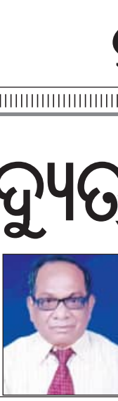
ପ୍ରଦେଶର ମହାମନ୍ତ ଦେବ ପରିଡ଼ା

ବାୟୁ ପ୍ରଦୂଷଣର ସବୁଠାରୁ ବଡ଼ କାରଣ ହେଉଛି କାର୍ବାନ୍ୟ ଉତ୍ପାଦନ ବ୍ୟବହାର । ଉଲ୍ଲେଖ ଅନାବଶ୍ୟକ ଯେ ସର୍ବାଧିକ ପ୍ରଦୂଷଣ ସୃଷ୍ଟିକାରୀ ଏହି ଉତ୍ପାଦନ ବ୍ୟବହାର ଗାଡ଼ିମୋଟରରେ ସର୍ବାଧିକ । ସାଂଘାତିକ ସମୟରେ ଜନସଂଖ୍ୟା ହ୍ରାସନରେ ମୋଟର ଯାନର ଅନୁପାତ ବୃଦ୍ଧିପାଇଛି । ପ୍ରତିଯୋଗିତାପୂର୍ଣ୍ଣ ଚଳଚଞ୍ଚଳ ଜୀବନରେ ମୋଟରଗାଡ଼ି ବ୍ୟବହାର ଏକପ୍ରକାର ଅପରିହାର୍ଯ୍ୟ ହୋଇପଡ଼ିଛି । ଏହି ପୃଷ୍ଠଭୂମିରେ ବ୍ୟକ୍ତି ପିଛା ଗୋଟିଏ ଗାଡ଼ି ବଦଳରେ ଅନେକଙ୍କ ପାଇଁ ଏକ ବା ସାଧାରଣ ପରିବହନ ବ୍ୟବସ୍ଥାର ଅଧିକ ପ୍ରସାର ହେବା ସହିତ ସେଥିପ୍ରତି ଲୋକଙ୍କ ମାନସିକତା ଓ ସଚେତନତା ସୃଷ୍ଟି ହେବା ଆବଶ୍ୟକ । ବିଶେଷକରି ସରକାରୀ ସ୍ତରରେ ଏହି ବ୍ୟବସ୍ଥାକୁ କଡ଼ାକଡ଼ି ଲାଗୁ କରିବା ଦରକାର । ଏହାଛଡ଼ା ବ୍ୟାଟେରି ଚାଳିତ ଇଞ୍ଜିନମୁକ୍ତ ଗାଡ଼ି ବା ଇ-କେହିକଲର ଅଧିକ ପ୍ରଚଳନ ପ୍ରତି ବୃଦ୍ଧି ଦେବାକୁ ପଡ଼ିବ । ପ୍ରାୟତଃ ବର୍ତ୍ତମାନ ଆଉ ଏକ ଗୁରୁତର ସମସ୍ୟା । ଏହା ଯେତେ କମ୍ ହେବ, ଏପରିକି ଆଦୌ ବ୍ୟବହାର କରା ନ ଯିବ ସେଥିପ୍ରତି ପ୍ରଶାସନ କଡ଼ା ବୃଦ୍ଧି ଦେବା ଆବଶ୍ୟକ । ସର୍ବୋପରି ଏସବୁ କ୍ଷେତ୍ରରେ ଜନସାଧାରଣ ହିଁ ଗୁରୁତ୍ୱପୂର୍ଣ୍ଣ ଭୂମିକା ନିର୍ବାହ କରିପାରିବେ । କାର୍ଯ୍ୟ ସମସ୍ୟା ସେମାନଙ୍କଠାରୁ ଓ ସେମାନଙ୍କ ଦ୍ୱାରା ସୃଷ୍ଟି ହେଉଥିବା ବେଳେ ଏହାର ପରାଧର ମଧ୍ୟ ସେମାନଙ୍କୁ ହିଁ ଭୋଗିବାକୁ ପଡ଼ୁଛି ।