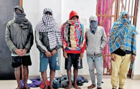
୫ ଗିରଫ ସହ କୋର୍ଟଚାଲାଶ

ପଟାଙ୍ଗି, ୧୫.୧୧.୨୪(ସମ୍ପାଦକ): ପଟାଙ୍ଗି ରୁକ୍ମିଣୀ ଘାଟି ରାଷ୍ଟ୍ରୀୟ ଲକ୍ଷ୍ମୀ ଲେନ୍ଦ୍ର ଜୟପୁର କାଠ ବ୍ୟବସାୟୀଙ୍କ ଗଳିତ ମୃତଦେହ ଉଦ୍ଧାର ପରେ ଶୁକ୍ରବାର ଘଟଣାର ଖୁଲାସା କରିଛି ପଟାଙ୍ଗି ପୁଲିସ।