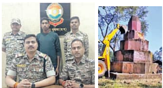
ଏହାକୁ ଧ୍ଵଂସ କରିଛନ୍ତି। ମାଓ ସ୍ତୃପ ଭାଙ୍ଗିବା ପରେ ସ୍ଥାନୀୟ ଲୋକେ ନିଜ ଅଞ୍ଚଳ ମାଓ ମୁକ୍ତ ହେବ ବୋଲି ଆଶା ପ୍ରକଟ କରିଛନ୍ତି।

ମାଲକାନଗିରି, ୧୫.୧୧.୨୪(ସମ୍ପାଦକ): ମାଲକାନଗିରି ଜିଲ୍ଲା ସାମାନ୍ତ ଛତିଶଗଡ଼ର ବିକାସରୁ ଜିଲ୍ଲାର ମାଓ ସ୍ତୃପକୁ ଧ୍ଵଂସ କରିଛନ୍ତି ଯବାନ।