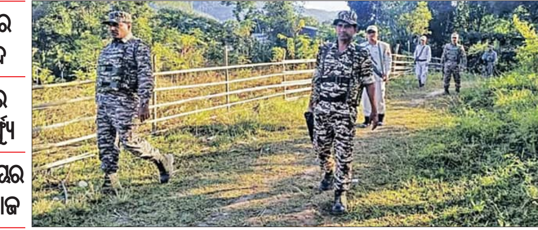
ବନ୍ଦ ପାଳନ କରାଯାଇଛି। ସୁରକ୍ଷା ଦୃଷ୍ଟିରୁ ଜିରିବାଙ୍ଗ ଜିଲ୍ଲା ଏବଂ ଅନ୍ୟ କିଛି ଜିଲ୍ଲାରେ କର୍ତ୍ତୃ୍ୟ ଲାଗୁ କରାଯାଇଛି। ୧୧ କୁକି ସଦସ୍ୟଙ୍କୁ ସିଆରପିଏଫ୍ ଅତି ନିର୍ମମ ଭାବେ ହତ୍ୟା କରିଛି ବୋଲି କୁକି-ଜୋ-କାଉନସିଲ କହିଛି। ମୃତକମାନଙ୍କ ପ୍ରତି ସମ୍ମାନ ଜଣାଇବା ଏବଂ ସେମାନଙ୍କ ଉଦ୍‌ବେଶ୍ୟରେ ସାମୂହିକ ଦୁଃଖ ପ୍ରକାଶ କରିବା ଲାଗି ମଙ୍ଗଳବାର ସକାଳ ୫ଟା ରୁ ସନ୍ଧ୍ୟା

ଇମ୍ଫାଲ, ୧୩ ନଭେମ୍ବର: କିଛି ଦିନର ଅନ୍ତରରେ ପୁଣି ଅଶାନ୍ତ ହୋଇପଡ଼ିଛି ମଣିପୁର। ଗତ ଚାରି ଦିନ ମଧ୍ୟରେ ରାଜ୍ୟର ବିଭିନ୍ନ ସ୍ଥାନରେ ହିଂସା ଘଟିବା ସହିତ କିଛି ଲୋକ ମୃତ୍ୟୁ ହୋଇଛନ୍ତି। ବିଶେଷକରି ଜିରିବାଙ୍ଗ ଜିଲ୍ଲାରେ କୁକି ଏବଂ ମେଲିତ ଫୁପୁଦାୟ ମଧ୍ୟରେ ପୁଣି ହିଂସା ମୁଖ୍ୟ ବେଳିଥିବା ଦେଖାଯାଇଛି। ଗତକାଳି ସୁରକ୍ଷକ ଗୁଳିରେ ୧୧ ସହିଷ୍ଣୁ କୁକି ଉଗ୍ରବାଦୀ ନିହତ ହେବା ପରେ କୁକି ଫୁପୁଦାୟ ପୁଣି ହିଂସାମୂଳକ ହୋଇପଡ଼ିଥିବା ଆକଳନ କରାଯାଇଛି। କୁକି ଉଗ୍ରବାଦୀଙ୍କୁ ଏନକାଇଣ୍ଡର କରାଯିବା ପରେ ମଙ୍ଗଳବାର ଜିରିବାଙ୍ଗ ଅଞ୍ଚଳର ଏକ ଘରୁ ଦୁଇ ମେଲିତ ଫୁପୁଦାୟ ଲୋକଙ୍କ ମୃତଦେହ ଉଦ୍ଧାର କରାଯାଇଛି। ଏହାଛଡ଼ା ଏକ ରିଲିଫ୍ କ୍ୟାମ୍ପରେ ଆଶ୍ରୟ ନେଇଥିବା ୬ ମେଲିତ ବ୍ୟକ୍ତି ନିଷ୍ଠୋକ ହୋଇଥିବା କୁହାଯାଇଛି। ଗତକାଳି ରାତିରୁ ଦୁଇ ଗୋଷ୍ଠୀଙ୍କ ମଧ୍ୟରେ ଗୁଳି ଚାଳନା ହୋଇଥିବାରୁ ଏହି ନିଷ୍ଠୋକ ଲୋକଙ୍କ ସ୍ଥିତିକୁ ନେଇ ସନ୍ଦେହ ପ୍ରକଟ କରାଯାଇଛି। ସେପଟେ କୁକି ଉଗ୍ରବାଦୀଙ୍କ ଏନକାଇଣ୍ଡର ପରେ କୁକି-ଜୋ-କାଉନସିଲ ପକ୍ଷରୁ ମଙ୍ଗଳବାର ୧୨ ଘଣ୍ଟା ମଣିପୁର