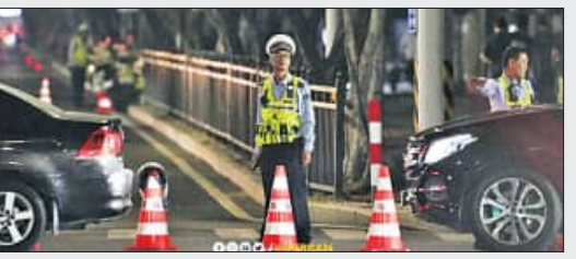
ଜଣଙ୍କର ମୃତ୍ୟୁ ହୋଇଥିଲା। ଡ୍ରାଇଭରକୁ ଗିରଫ କରାଯାଇଥିଲା ବେଳେ ଏହା ଦୁର୍ଘଟଣା ଥିଲା ନା ଯୋଜନାବଦ୍ଧ ଆକ୍ରମଣ ଥିଲା ତାହା ପୁଲିସ୍ ଯାଞ୍ଚ କରୁଛି। ଡ୍ରାଇଭରର ପରିଚୟ ସ୍ପଷ୍ଟ ହୋଇଥିବାରୁ ତା'ର କୋଣସି ମାନସିକ କିମ୍ବା ଶାରୀରିକ ସମସ୍ୟା ନ ଥିବା ଜଣାପଡ଼ିଛି। ଏହାସତ୍ତ୍ୱେ ସେ କିଭଳି ଭିତ୍ତ ଉପରେ କାର୍ ଚଢ଼ାଇ ଦେଲା ତାହା ଯାଞ୍ଚ କରାଯାଉଥିବା କୁହାଯାଇଛି।

ବେଙ୍ଗଳୁରୁ, ୧୩ ନଭେମ୍ବର: ଚାନ୍ଦ୍ର ଜଙ୍ଗଲ ସହରରେ ଏକ ବ୍ୟାୟାମ ସ୍ଥଳରେ ଏକ କାର୍ ଚଢ଼ି ଯିବାରୁ ଗାଈ ଜଣଙ୍କ ମୃତ୍ୟୁ ହେବା ସହିତ ୪୫ରୁ ଅଧିକ ଲୋକ ଆହତ ହୋଇଛନ୍ତି। ମଙ୍ଗଳବାର ଚାନ୍ଦ୍ର ପିପ୍ପୁଲି ନଗରରେ ଆର୍ମି (ପିଏଲଏ) ପକ୍ଷରୁ ଏୟାର ଶୋ' ଆରମ୍ଭ ହେବା ପୂର୍ବରୁ ଏହି ଦୁର୍ଘଟଣା ଘଟିଛି। ଏଠାକାର ଏକ ସ୍ପୋର୍ଟସ୍ ସେଣ୍ଟରରେ ୫୦ ରୁ ଅଧିକ ଲୋକ ବ୍ୟାୟାମ ଅଭ୍ୟାସ କରୁଥିଲା ବେଳେ ଦୂତ ଗତିରେ ଆସୁଥିବା ଏକ କାର୍ ସେମାନଙ୍କ ଉପରେ ଚଢ଼ି ଯାଇଥିଲା। ଫଳରେ ଘଟଣାସ୍ଥଳରେ ହିଁ ଗାଈ