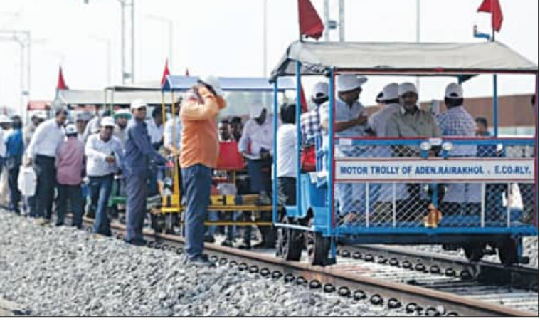
କରିବାକୁ ସମୟସୀମା ଧାର୍ଯ୍ୟ କରାଯାଇଛି । ଇଞ୍ଜିନିୟରିଂ ଚ୍ୟାଲେଞ୍ଜ ସତ୍ତ୍ୱେ ଯୁର୍ତ୍ତମ ପାହାଡ଼, ଜଙ୍ଗଲ ଓ ଅଭ୍ୟାସୀୟ ବେଲ ଟେନିଲ ନିର୍ମାଣ କର୍ମରେ ପ୍ରକଳ୍ପ ମାଲଭୂଷ୍ଟ ହାସଲ କରିଛି । ଖୋର୍ଦ୍ଧା ରୋଡ୍-ବଲାଙ୍ଗିର ରେଳ ଲାଇନ କେବଳ ସଫାଯୋଗୁ ସୁଦୃଢ଼ କରିବା ପାଇଁ ଗୁରୁତ୍ୱପୂର୍ଣ୍ଣ

ଧୀରେ ସମୁଦାୟ ହେବାକୁ ଯାଉଛି । ଯେଉଁ ଅଞ୍ଚଳ ପାଇଁ ବିନେ ରେଳ ଏକ ସମୁଦାୟ । ସେହି ଅଞ୍ଚଳର ଲୋକେ ରେଳରେ ଚଢ଼ି ଦୂର ସ୍ଥାନକୁ ଯାତ୍ରା କରିବାର ଲକ୍ଷ୍ୟ ପୂରଣ ହେବାକୁ ଯାଉଛି । ଉଲ୍ଲେଖନୀୟ ଭାବେ ଖୋର୍ଦ୍ଧା-ବଲାଙ୍ଗିର ରେଳ ପ୍ରକଳ୍ପର ଅଗ୍ରଗତି ହୋଇଛି । କିଛି ମାସ ମଧ୍ୟରେ ସୋନପୁର-ବୌଦ୍ଧ ମଧ୍ୟରେ ରେଳ ଚଳାଚଳ ଆରମ୍ଭ ହେବାକୁ ଯାଉଛି । ପ୍ରକଳ୍ପର ମୋଟ ଦୈର୍ଘ୍ୟ ୩୦୧ କିମି ମଧ୍ୟରୁ ୧୯୯ କିମି କାର୍ଯ୍ୟକ୍ରମ ହୋଇଛି । ଉପରାନ୍ତ ଅଞ୍ଚଳରେ ପରିବହନ ଏବଂ ଅର୍ଥନୈତିକ ବିକାଶ ପାଇଁ ଏହି ରେଳ ପ୍ରକଳ୍ପର ମହତ୍ତ୍ୱପୂର୍ଣ୍ଣ ଭୂମିକା ରହିଛି । ରେଳ ମନ୍ତ୍ରାଳୟ ଦ୍ୱାରା ପ୍ରକଳ୍ପର ଅଗ୍ରଗତି ଉପରେ ତାତ୍କାଳିନୀ ଭାବରେ ସମାପ୍ତ କରାଯାଉଥିବା ବେଳେ ସଠିକ ସମୟରେ ନିର୍ମାଣ କାର୍ଯ୍ୟ ସୁନିଶ୍ଚିତ