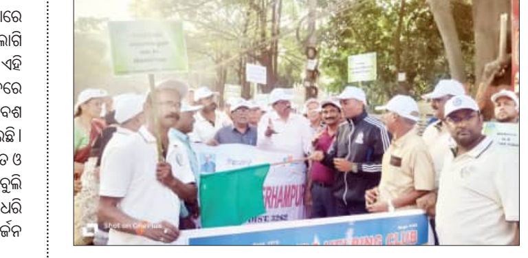
People participating in a diabetes awareness march