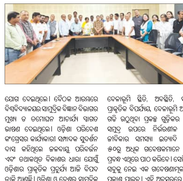
People at a meeting