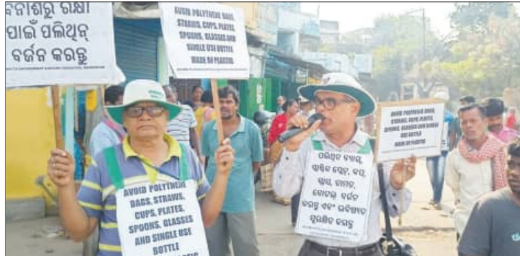
People holding signs about plastic waste