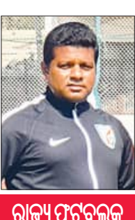
ରାଜ୍ୟ ପୁଟ୍‌ବଲକୁ ସଫଳତା

ରାଜ୍ୟ ସରକାରଙ୍କ ଘୋଷଣା ଓଡ଼ିଶା ଟିମ୍‌ରେ ବିଶେଷ ନିର୍ଦ୍ଦେଶକ ତଥା ହେଡ୍ ଅଫ୍ ଯୁଥ ଡେଭେଲପମେଣ୍ଟ ଭାବେ କାର୍ଯ୍ୟ କରୁଛନ୍ତି। ୨୦୧୬ରୁ ୨୦୨୩ ଭିତରେ ରାଜ୍ୟରେ ପୁଟ୍‌ବଲର ବିକାଶ ଦିଗରେ ତାଙ୍କ ଅବଦାନ ଅତୁଳନୀୟ। ତାଙ୍କ ଅଧୀନରେ ପ୍ରଶିକ୍ଷଣ ନେଇ ଓଡ଼ିଶାର ୫ ଜଣ ଖେଳାଳି ବିଭିନ୍ନ ବର୍ଗରେ ଭାରତୀୟ ଦଳରୁ ପ୍ରତିନିଧିତ୍ୱ କରିଛନ୍ତି। ପୁଟ୍‌ବଲ ଆସୋସିଏସନ ଅଫ୍ ଓଡ଼ିଶା(ଫାଓ) ସଭାପତି ସମାଜ ଦେ ଏବଂ ସମ୍ପାଦକ ଆଶାବାଦ ବେହେରା ଶୁଭେନ୍ଦୁକୁ ଶୁଭେଲ୍ କଣ୍ଠାଛନ୍ତି।