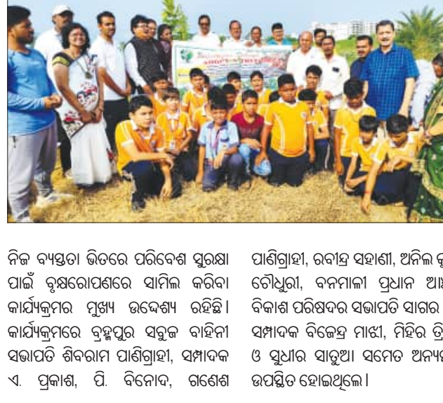
Group of people planting trees