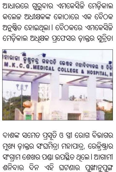
M.K.C.G. Medical College & Hospital