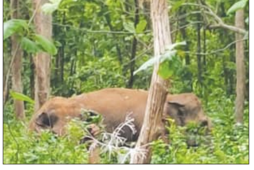
Tiger in a forest