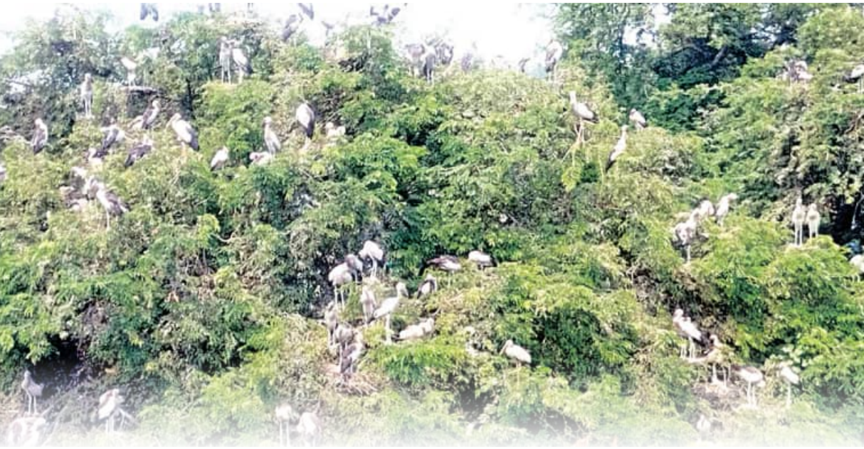
ପ୍ରକୃତି ପ୍ରେମରେ କର୍ଲାଯୋରା ଓ ଅନ୍ତପାଲିବାସୀ

ପକ୍ଷୀ ଗବେଷକ, ପକ୍ଷୀ ବିଶାରଦ, ପରିବେଶବିତ୍ ପାଇଁ ଆକର୍ଷଣର କେନ୍ଦ୍ରବିନ୍ଦୁ ପାଲଟିଛି ଭଟ୍ଟାଳି ବୁଲ୍ ଅନ୍ତର୍ଗତ କର୍ଲାଯୋରା ଓ ଅନ୍ତପାଲି ଗାଁ । ବାରପାହାଡ଼ର ପାଦଦେଶରେ ଅବସ୍ଥିତ ଗ୍ରାମ ଦୁଇକେଉଁ ଆବହମାନ କାଳରୁ ନିଜ କୋଳରେ ଅନେକ ଦୃଷ୍ଟଲତାକୁ ସ୍ଥାନ ଦେବା ସହ ବିଦେଶୀ ପକ୍ଷୀମାନଙ୍କ ପାଇଁ ଆବାସସ୍ଥଳୀ ପାଲଟିଛି । ଭାରତୀୟ ଉପମହାଦେଶ ତଥା ଦକ୍ଷିଣ ପୂର୍ବ ଏସୀୟ ରାଷ୍ଟ୍ରଗୁଡ଼ିକରୁ ଆସି ଅକ୍ଷୟ ତୃତୀୟା ଦିନଠାରୁ କାର୍ତ୍ତିକ ମାସ ପର୍ଯ୍ୟନ୍ତ ଆସ୍ଥାନ ଜମାଇଥିବା ବିଭିନ୍ନ ପ୍ରଜାତିର ପକ୍ଷୀ ପ୍ରାୟତଃ ଅକ୍ଷୟ ତୃତୀୟା ବେଳକୁ କେତେକ ମୁଣ୍ଡୁଆ ପରିବାଜକ ପକ୍ଷୀ ଗ୍ରାମର ପାରିପାତ୍ରିକ ବାତାବରଣକୁ ଅନୁଧ୍ୟାନ କରିବା ପରେ ଠିକ୍ ମୌସୁମୀର ଆଗମନ ପୂର୍ବରୁ ବିଭିନ୍ନ ପର୍ଯ୍ୟାୟରେ ଅଗଣିତ ପକ୍ଷୀ ଆସି ଶାନ୍ତ ମାସ ଆରମ୍ଭ ହେବା ଯାଏ ରୁହନ୍ତି ।