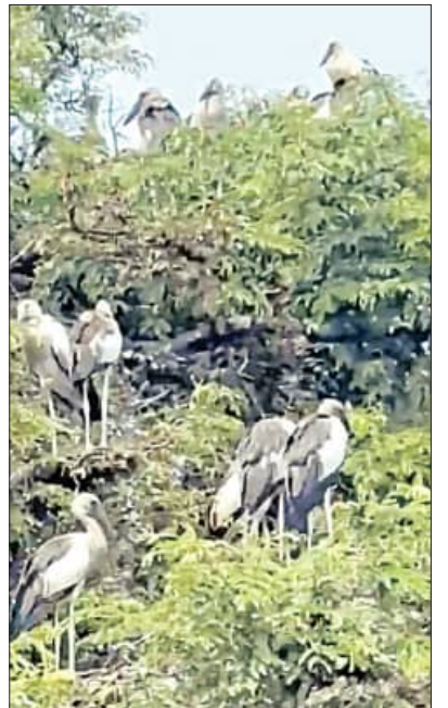
ପକ୍ଷୀ ଦେଖାଯାଉଥିଲେ ହେଁ କେବଳ କେତେକ ନିର୍ଦ୍ଦିଷ୍ଟ ଯଥା ଷ୍ଟୋକ୍, ହେରନ, କର୍ମୋରେଷ୍, ଇଗ୍ରିଟ, ଆଇବିସ ଆଦି ସାରସ ପ୍ରଜାତିର ପକ୍ଷୀ ନାଡ଼ୁ ତିଆରି

ବାଇନାକୁଲାର ପ୍ରଦାନ କରିଥିଲେ । ଭବିଷ୍ୟତରେ ଅନେକ କିଛି ଉନ୍ନତନିମ୍ନକାର୍ଯ୍ୟ କରିବା ପାଇଁ ପ୍ରତିଶ୍ରୁତି ମଧ୍ୟ ଦେଇଥିଲେ । କିନ୍ତୁ ତାଙ୍କ ପଦୋନ୍ନତି ହେଲା ପରେ ବନ ବିଭାଗ ତରଫରୁ ଆଉ ସେମିତି କିଛି ଆଖିବୁଝିଆ ପଦକ୍ଷେପ ନିଆଯାଉନାହିଁ । ପରିବେଶ ତଥା ଜଳବାୟୁର ପରିବର୍ତ୍ତନ ସହ