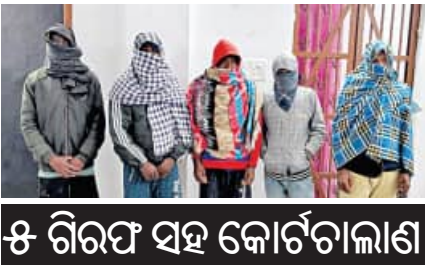
୫ ଗିରଫ ସହ କୋର୍ଟଚାଲାଣ