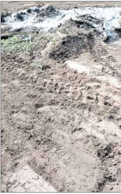
କରିଥିବା ଜଣାଯାଇଛି। ଗତ ୮ ତାରିଖରେ ଖର୍ଚ୍ଚି ଗୁମ୍ଫା ଅଞ୍ଚଳରେ ତଦନ୍ତ ପାଇଁ ପତ୍ର କେଣ୍ଡ୍ରା ପରେ ବନ ବିଭାଗ କର୍ମଚାରୀ ମାନେ ଏହାଭେତ୍ତ ନେଇ କାଠଗଣ୍ଡିକୁ ମାଟିରେ ଯୋଡ଼ି

ନଷ୍ଟ ପାଇଁ ଯୋଡ଼ି ଦେଇପାରିଥିଲା। ଏହି ଯୋଡ଼ିବା ଅଭାବ ବନ ବିଭାଗର ଆଗରୁ ରହିଛି ଏବଂ ପ୍ରମାଣ ନଷ୍ଟ ପାଇଁ କାଠଗଣ୍ଡିକୁ ମଧ୍ୟ ଯୋଡ଼ିବାରେ ସକ୍ଷମ ହୋଇଛି।