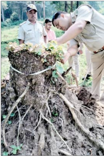
ମୁଖ୍ୟ ବନ ଫରାସକ ପଠାଯାଇଥିଲା। ମାତ୍ର ତାହାର କୌଣସି କାର୍ଯ୍ୟାନୁଷ୍ଠାନ ନ ହେବାରୁ ପ୍ରଜା ସୁରକ୍ଷା

ସାତକୋଶିଆ ବ୍ୟାଘ୍ର ଫରାସଣ ଅଞ୍ଚଳରେ ବାଘ ଶୂନ୍ୟ ହେବା ପରେ ବନ ବିଭାଗ ବାଘ ବନ୍ଦୀ ଚାଣି ପାଇଁ ପରାଣୀ ମୂଳକ ଭାବେ ଯୋଜନା କରୁଛି।