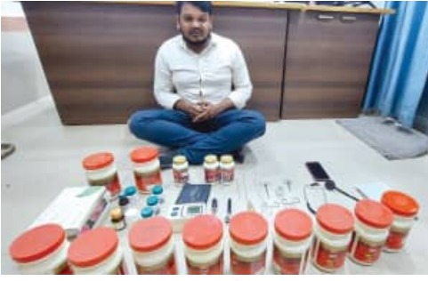
'ସିଡିଏମ୍‌ଏଚ୍' କାର୍ଯ୍ୟାଳୟ ନିକଟରେ ଚାଲିଥିଲା ନକଲି କ୍ଲିନିକ୍

ବ୍ରହ୍ମପୁର, ୧୪।୧୧(ସମ୍ପାଦ): ବ୍ରହ୍ମପୁର ଗେଟ୍‌ବଜାର ମିତ୍ରା ସାହିରେ କ୍ରିଷ୍ଣା ପାଇଲୁ କ୍ଲିନିକ୍ ଚଳାଇଥିବା ଜଣେ ନକଲି ଆୟୁର୍ବେଦିକ ଡାକ୍ତରଙ୍କୁ ବ୍ରହ୍ମପୁର ଡାକ୍ତର ଥାନା ପୁଲିସ୍ ଗିରଫ କରି କୋର୍ଟଚାଲାଣ କରିଛି। ଗିରଫ ନକଲି ଡାକ୍ତର ଜଣକ ହେଲେ, ବ୍ରହ୍ମପୁର ରମ୍ପା ସାହିରେ ରହୁଥିବା ଉପ୍ଲେକ୍ଷ ହୁଲିକି ଜିଲ୍ଲା ପାଠୁଆ ଥାନା ଅନ୍ତର୍ଗତ ଚିନା ନେତାଜୀପଲ୍ଲୀର ଉପ୍ଲେକ୍ଷ ବଳ(୩୧)। ପୁଲିସ୍ ଏହି ନକଲି ଆୟୁର୍ବେଦିକ ଡାକ୍ତରଙ୍କ କ୍ଲିନିକ୍ସ ବିଭିନ୍ନ କମ୍ପାନୀର ଆୟୁର୍ବେଦିକ ଔଷଧ, ତେରମୂଳି, ଷ୍ଟେଥୋଷ୍କୋପ, ପାଇଲୁ ଅପରେସନ୍ ସମୟରେ ବ୍ୟବହୃତ ସରଜୀମ, ଚାକ୍ ନାମରେ ଥିବା ଡାକ୍ତରୀ ନୋଟିଫାଇଡ୍ କ୍ଲିନିକ୍ ଓ ନକଲି ଡାକ୍ତରଙ୍କ ନାମପତକ, ବଙ୍ଗାଳି ଭାଷାରେ ଲେଖାଯିବା ୩ ଟି ଆୟୁର୍ବେଦିକ ଚିକିତ୍ସା ପୁସ୍ତକ କବଚ କରିଛି। ବ୍ରହ୍ମପୁରରେ ଥିବା ଜିଲ୍ଲା ମୁଖ୍ୟ ଚିକିତ୍ସାଧିକାରୀ ବା ସିଡିଏମ୍‌ଏଚ୍ କାର୍ଯ୍ୟାଳୟରେ ମାତ୍ର ୫-୬ମିଟର ଦୂରରେ କ୍ଲିନିକ୍ ଦାକ୍ତରୀଖଣ୍ଡ ଧରି ଚାଲିଥିଲା।