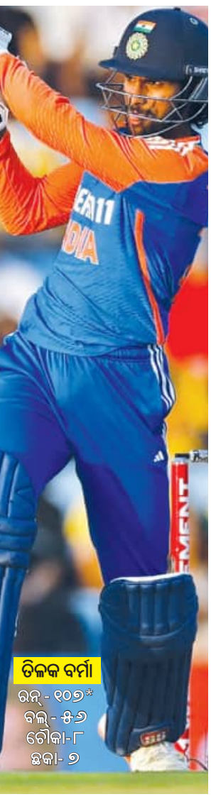
ଟିକେଟ ବର୍ମା ରନ - ୧୦୭* ବଲ୍ - ୫୬ ଟିକେଟ - ୮ ଛକା - ୭

ଦ୍ୱିତୀୟ ଓକେଟ ଯୋଡ଼ିରେ ୫୨ ବଲ୍ରେ ୧୦୭ ରନ ଉଠାଇ ଭାରତ ଲାଗି ଏକ ବଡ଼ ସ୍କୋରର ମୁକ୍ତୁଆ ପକାଇଥିଲେ। ଭାରତ ଇନିଂସର ୯ମ ଓକେଟରେ ଶର୍ମା ୨୪ ବଲ୍ରେ ଅର୍ଦ୍ଧଶତକ ହାସଲ କରିବାର ପର ବଲ୍ରେ କେଶବ ମହାରାଜଙ୍କୁ ଆଉ ଏକ ବଡ଼ ସ୍କୋର କରିବାକୁ ଆଉଟ ହୋଇଯାଇଥିଲେ। ସେ ମୋଟ ୨୫ ବଲ୍ରେ ୬୦ ରନ କରି ୧୮ ଓ ରମଣଦାସ ଦି ୬ ବଲ୍ରେ ୧୫ ରନ କରି ବର୍ମାଙ୍କୁ ପେଟିବାର ସୁତନା ଦେଇଥିଲେ। ତାଙ୍କ ଆଉଟ ସହ ଭାରତର କ୍ରମାଗତ ଓକେଟ ପତନ ଘଟିଥିଲା। କିନ୍ତୁ ୩୨ ବଲ୍ରେ ଅର୍ଦ୍ଧଶତକ ହାସଲ କରିଥିବା ଟିକେଟ ବର୍ମାଙ୍କ ଉପରେ କୌଣସି ପ୍ରଭାବ ପଡ଼ି ନ ଥିଲା। ସେ ଚମତ୍କାର ବ୍ୟାଟିଂ ପ୍ରଦର୍ଶନ