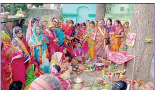
ପଞ୍ଚୁକ ଅବସରରେ ଭୁବନସ୍ଥିତ କାଶୀବିଶ୍ୱନାଥ (ଛତାମଠ) ରେ ମହିଳା ଶ୍ରଦ୍ଧାଳୁମାନେ କାର୍ତ୍ତିକ ବ୍ରତ ପାଳନ କରୁଛନ୍ତି।