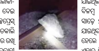
ରାଷ୍ଟ୍ରରେ ଲେଭେଲ କୁସିନ୍ କିଛି ଦୂରରେ ରେଳଧାରଣାରେ ପଥର ରଖି ଦେଇଥିଲେ। ରାୟପୁର ପଟ୍ଟ ପେରୁଥିବା ଏକ ମାଲବାହୀ ଟ୍ରେନ୍‌ର ଲୋକୋ-ପାଇଲଟ୍ ଏହା ଦେଖି ତୁରନ୍ତ ନୂଆପଡ଼ା ଷ୍ଟେସନ୍ ମାଷ୍ଟରଙ୍କୁ ଜଣାଇଥିଲେ।

ନୂଆପଡ଼ା, ୧୧/୧୧(ସମିପ): ଜଣେ ମାଲବାହୀ ଟ୍ରେନ୍ ଲୋକା-ପାଇଲଟ୍ ପାଇଁ ନୂଆପଡ଼ା ଜିଲ୍ଲା ସଦର ମହକୁମା ବେଲ ବିଶାଖାପାଟଣାକୁ ଯାତାୟତ କରୁଥିବା ବନ୍ଦେ ଭାରତ ଏକ୍ସପ୍ରେସ୍ ଏକ ବଡ଼ ଅଘଟଣର ଅଘଟଣରୁ ଅଳ୍ପକେ ବର୍ତ୍ତାଯାଇଛି। ଗଡ଼କାଳି ଝାଞ୍ଜାରେ କିଛି ଦୁର୍ଘଟ ରେଳଧାରଣା ଉପରେ ବଡ଼ ପଥର ରଖି ଦେଇଥିଲେ। ସେହି ସମୟରେ ଅତିକ୍ରମ କରୁଥିବା ମାଲବାହୀ ଟ୍ରେନ୍‌ର ଲୋକୋ-ପାଇଲଟ୍‌ଙ୍କ ନଜରରେ ଏହା ପଡ଼ିବାରୁ ସେ ଏ ଫର୍ଦ୍ଦରେ ନୂଆପଡ଼ା ଷ୍ଟେସନ୍ ମାଷ୍ଟରଙ୍କୁ ଜଣାଇଥିଲେ। ତେଣୁ ବନ୍ଦେ ଭାରତ ଏକ୍ସପ୍ରେସ୍‌କୁ ନୂଆପଡ଼ା ଷ୍ଟେସନ୍ ନିକଟରେ ଅଟକାଯିବା ସହ ଅନ୍ୟ ଏକ ଧାରଣାରେ ଛଡ଼ା