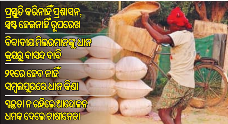
ପ୍ରସ୍ତୁତି କରିନାହିଁ ପ୍ରଶାସନ, ସ୍ୱଳ୍ପ ହେଉନାହିଁ ରୂପରେଖ ବିବାଦୀ ମିଲରମାନଙ୍କୁ ଧାନ କ୍ରୟରୁ ବାସନ୍ଦ ଦାବି ୨୧ରେ ହେବ ନାହିଁ ସମ୍ବଲପୁରରେ ଧାନ କିଣା ସ୍ୱଳ୍ପତା ନ ରହିଲେ ଆନ୍ଧ୍ରପ୍ରଦେଶ ଧାନକ ଦେଲେ ଚାଷୀନେତା

ଭୁବନେଶ୍ୱର, ୧୧/୧୧ (ସମିପ): ସରକାରୀ ଯୋଗଣା ଅନୁସାରେ ଆସନ୍ତା ୨୧ ତାରିଖରୁ ଆରମ୍ଭ ହେବ ଧାନ କିଣା। ରାଜ୍ୟସ୍ତରରେ ମନ୍ତ୍ରିସଭାରେ ବୈଠକରେ ଏ ସମ୍ପର୍କରେ ସୂଚନା ଦିଆଯାଇଛି ଓ ଚଳିତ ଖରିଫ ବିପଣନ ବର୍ଷରେ ୮୦ ଲକ୍ଷ ଟନ୍ ଧାନ କ୍ରୟ ନିଷ୍ପତ୍ତି ହୋଇଛି। ଚାଷୀଙ୍କୁ ଏମ୍.ଏସ୍.ପି ବ୍ୟତୀତ ରାଜ୍ୟ ସରକାର ପ୍ରତି କିଣାଲରେ ୮୦୦ ଟଙ୍କା ଇନ୍-ପୁର୍ସ୍ ସହାୟତା (ବୋନସ) ଦେବେ ବୋଲି ମଧ୍ୟ ଘୋଷଣା କରିଛନ୍ତି। ମାତ୍ର ବିତ୍ତମୁନା ହେଉଛି ରାଜ୍ୟର ଭାଗ୍ୟକୁ କୁହାଯାଉଥିବା ପଶ୍ଚିମ ଓଡ଼ିଶାର ଚରଗଡ଼ ସହ ବଲାଙ୍ଗୀର, କଳାହାଣ୍ଡି ଜିଲ୍ଲାରେ ଧାନ କ୍ରୟ ପ୍ରକ୍ରିୟାକୁ ନେଇ ଏବେ ବି ଚାଷୀ ସମ୍ବନ୍ଧେ ଅଛନ୍ତି। ଅଳ୍ପ କିଛି ସ୍ଥାନକୁ ଛାଡ଼ିଦେଲେ ପ୍ରାୟ ଅଧିକାଂଶ ସ୍ଥାନରେ ମଣ୍ଡି ପ୍ରସ୍ତୁତ ହୋଇ ନାହିଁ, କିଲ୍ଲାପ୍ରଶାସନ ପକ୍ଷରୁ ଧାନ କ୍ରୟ ପ୍ରକ୍ରିୟା ନେଇ କୌଣସି ବୈଠକ ହୋଇ ନାହିଁ ଓ ଧାନ ବିକ୍ରୟ ସଂକ୍ରାନ୍ତରେ ଚାଷୀଙ୍କୁ କୌଣସି ସୂଚନା ଦିଆଯାଇ ନାହିଁ। ସରକାର ଓ ମନ୍ତ୍ରୀମାନେ ସଚ୍ଚତାର ସହ ଧାନ କ୍ରୟ କରାଯିବ ଓ ତୃତୀୟ ପକ୍ଷ ଦ୍ୱାରା ଧାନ ଯାଞ୍ଚ କରାଯିବ ବୋଲି ଘୋଷଣା କରିଥିଲେ ହେଁ ଏହି ତୃତୀୟ ପକ୍ଷ କିଏ ଓ ଏହାକୁ