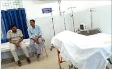
ବିଚାରାଧୀନ କଏଦୀଙ୍କ ମୃତ୍ୟୁ ଘଟିଛି। ମୃତକ ହେଲେ, କୋଇଡ଼ା ଅଞ୍ଚଳର ବ୍ରହ୍ମା ମୁଣ୍ଡା। ଏକ

ବଣାଇଁ, ୧୧/୧୧(ସମିପ): ବଣାଇଁଗଡ଼ ସ୍ୱତନ୍ତ୍ର ଉପ-କାରାଗାରରେ ଆଜି ସକାଳେ ଜଣେ