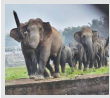
ଅମଳବେଳେ ସାମାନ୍ତ ଜିଲ୍ଲାରେ ଉପଦ୍ରବ ଗତ ବର୍ଷ ୧୨ ହଜାର ଏକର ଫସଲ କ୍ଷତିଗ୍ରସ୍ତ

ଭୁବନେଶ୍ୱର, ୧୧/୧୧ (ସମିପ): ପଡ଼ୋଶୀକ ପାଇଁ ଦହଗଞ୍ଜ ହେଉଛି ଓଡ଼ିଶା। କିଏ ସାମା ମାଡ଼ି ଗଲାଣି, କିଏ ପାଣି ବନ୍ଦ କଲାଣି। କିଏ ଆଳୁ ବନ୍ଦ କରୁଛି, କିଏ ପୁଣି ଅଣ୍ଡା-କୁକୁଡ଼ା ବାରଣ କରୁଛି। ଏତିକି ବେଳକୁ ପଡ଼ୋଶୀ ରାଜ୍ୟର ହାତୀ ବି ଓଡ଼ିଶାରେ ଅଦଖତି କରୁଛନ୍ତି। ପଶ୍ଚିମବଙ୍ଗ ଓ ଝାରଖଣ୍ଡା ହାତୀପଲ ଓଡ଼ିଶାର ସାମାନ୍ତରାୟ ମୟୂରଭଞ୍ଜ, ସୁନ୍ଦରଗଡ଼, କେନ୍ଦୁଝର ସହ ଅନୁଗୋଳର ଆରକ୍ଷକରାଣୀ ଅଞ୍ଚଳରେ ଧାନ କ୍ଷେତ୍ରକୁ ଛିନଛତ୍ର କରି ଦେଉଛନ୍ତି। ରାଜ୍ୟରେ ବର୍ତ୍ତମାନ ଖରିଫ ଧାନ ଅମଳ ସମୟ। ପାଚିଲା ଧାନ କିଆରିରେ ହାତୀ ପଲ ପଶି କ୍ଷେତ ଉଜାଡ଼ୁଛନ୍ତି। ମୟୂରଭଞ୍ଜର ବେତନଗାରେ ୧୦ ଦିନ ଧରି ହାତୀ ଉପଦ୍ରବ ଜାରି ରହିଥିବାରୁ ସ୍ଥାନୀୟ ଲୋକଙ୍କ ବର୍ଷକ ଆହାର ଉଜୁଡ଼ି ଯାଇଛି। ଏହା ବ୍ୟତୀତ ବୃଷ୍ଟି ହାତୀଙ୍କ ହିଂସ୍ର ଆଚରଣ