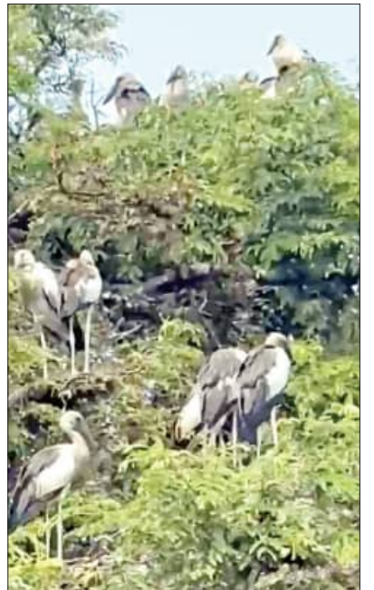
ପକ୍ଷୀ ଦେଖାଯାଉଥିଲେ ହେଁ କେବଳ କେତେକ ନିର୍ଦ୍ଦିଷ୍ଟ ଯଥା ସ୍କୋର୍ପ, ହେରନ, କର୍ମୋରେଣ୍ଡ, ଇଗ୍ରିଟ, ଆଇବିଏ ଆଦି ସାରସ ପ୍ରଜାତିର ପକ୍ଷୀ ନାଡ଼ୁ ତିଆରି

ବାଇନାକୁଲାର ପ୍ରଦାନ କରିଥିଲେ । ଭବିଷ୍ୟତରେ ଅନେକ କିଛି ଉନ୍ନତନିମ୍ନକାର୍ଯ୍ୟ କରିବା ପାଇଁ ପ୍ରତିଶ୍ରୁତି ମଧ୍ୟ ଦେଇଥିଲେ । କିନ୍ତୁ ତାଙ୍କ ପଦୋନ୍ନତି ହେଲା ପରେ ବନ ବିଭାଗ ତରଫରୁ ଆଉ ସେମିତି କିଛି ଆଖିବୁଝିଆ ପଦକ୍ଷେପ ନିଆଯାଉନାହିଁ । ପରିବେଶ ତଥା ଜଳବାୟୁର ପରିବର୍ତ୍ତନ ସହ