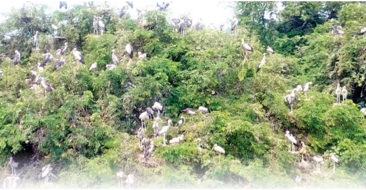
ପ୍ରକୃତି ପ୍ରେମରେ କର୍ଲାଯୋରା ଓ ଅନ୍ତପାଲିବାସୀ

ପକ୍ଷୀ ଗବେଷକ, ପକ୍ଷୀ ବିଶାରଦ, ପରିବେଶବିତ୍ ପାଇଁ ଆକର୍ଷଣର କେନ୍ଦ୍ରବିନ୍ଦୁ ପାଲଟିଛି ଭଟ୍ଟାଳି ବୁଲ୍ ଅନ୍ତର୍ଗତ କର୍ଲାଯୋରା ଓ ଅନ୍ତପାଲି ଗାଁ । ବାରପାହାଡ଼ର ପାଦଦେଶରେ ଅବସ୍ଥିତ ଗ୍ରାମ ଦୁଇକେଉଁ ଆବହମାନ କାଳରୁ ନିଜ କୋଳରେ ଅନେକ ଦୃଷ୍ଟଲତାକୁ ସ୍ଥାନ ଦେବା ସହ ବିଦେଶୀ ପକ୍ଷୀମାନଙ୍କ ପାଇଁ ଆବାସସ୍ଥଳୀ ପାଲଟିଛି । ଭାରତୀୟ ଉପମହାଦେଶ ତଥା ଦକ୍ଷିଣ ପୂର୍ବ ଏସୀୟ ରାଷ୍ଟ୍ରଗୁଡ଼ିକରୁ ଆସି ଅକ୍ଷୟ ତୃତୀୟା ଦିନଠାରୁ କାର୍ତ୍ତିକ ମାସ ପର୍ଯ୍ୟନ୍ତ ଆସ୍ଥାନ ଜମାଇଥିବା ବିଭିନ୍ନ ପ୍ରଜାତିର ପକ୍ଷୀ ପ୍ରାୟତଃ ଅକ୍ଷୟ ତୃତୀୟା ବେଳକୁ କେତେକ ମୁଣ୍ଡୁଆ ପରିବାଜକ ପକ୍ଷୀ ଗ୍ରାମର ପାରିପାଶ୍ଵିକ ବାତାବରଣକୁ ଅନୁଧ୍ୟାନ କରିବା ପରେ ଠିକ୍ ମୌସୁମୀର ଆଗମନ ପୂର୍ବରୁ ବିଭିନ୍ନ ପର୍ଯ୍ୟାୟରେ ଅଗଣିତ ପକ୍ଷୀ ଆସି ଶାନ୍ତ ମାସ ଆରମ୍ଭ ହେବା ଯାଏ ରୁହନ୍ତି ।