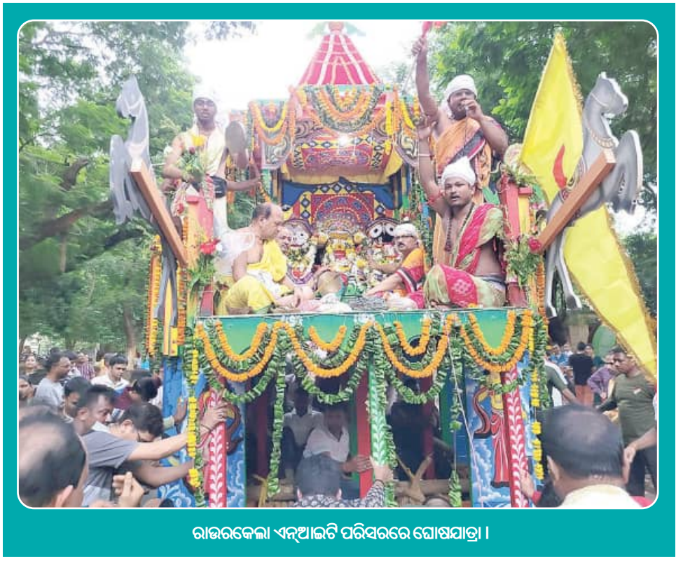
ରାଉରକେଲା ଏନଆଇଟି ପରିସରରେ ଯୋଷାଯାତ୍ରା ।