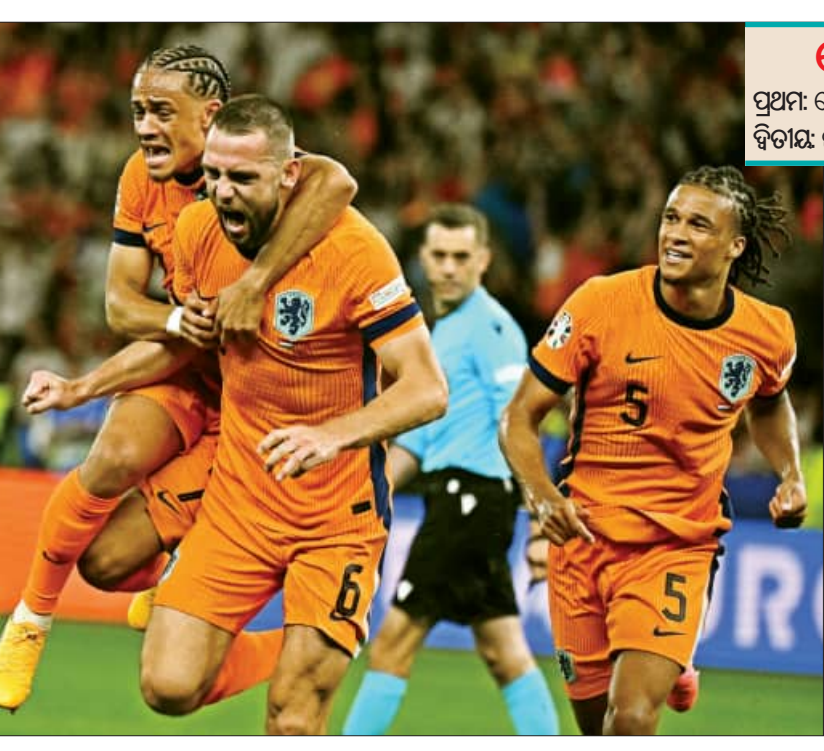
ସେମିଫାଇନାଲ କାର୍ଯ୍ୟସୂଚୀ ପ୍ରଥମ: ସ୍ୱେନ-ପ୍ରାନ୍ତ, ମଙ୍ଗଳବାର (ରାତି ୧୨ଟା ୩୦) ଦ୍ୱିତୀୟ: ଜର୍ମାନୀ-ନେଦରଲାଣ୍ଡସ୍, କ୍ରୁପିନାର (ରାତି ୧୨ଟା ୩୦)

ବର୍ଲିନ, ୭।୬ (ଏକେନ୍): ଚଳିତ ୟୁରୋକପ୍ ୧୬ତମ ସଂସ୍କରଣର ସେମିଫାଇନାଲ ଲାଜରାଥ୍ ସମ୍ପର୍କରେ ହୋଇଛି। ମଙ୍ଗଳବାର ରାତିରେ ସ୍ୱେନ ଓ ପ୍ରାନ୍ତ ମଧ୍ୟରେ ପ୍ରଥମ ସେମିଫାଇନାଲ ଖେଳାଯିବ। ସେହିଭଳି ନେଦରଲାଣ୍ଡସ୍ ଓ ଜର୍ମାନୀ ମଧ୍ୟରେ କ୍ରୁପିନାର ରାତିରେ ୨ୟ ସେମିଫାଇନାଲ ଖେଳାଯିବ। ରବିବାର ଗ୍ରୀଷ୍ମଫାଇନାଲ ଅନୁଷ୍ଠିତ ହେବ।