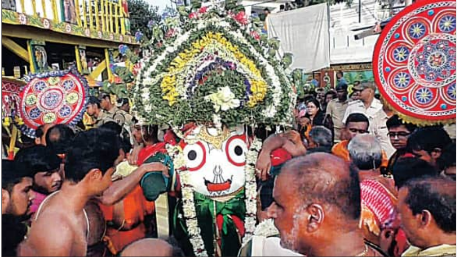
ବାରିପଦା, ୨।୭ (ସମିପ)

ଶ୍ରୀକ୍ଷେତ୍ର ହରିକଳଦେବ ଜୀଉ ବିଜେ ଦ୍ଵିତୀୟ ଶ୍ରୀକ୍ଷେତ୍ର ବାରିପଦାରେ ରବିବାର ଚତୁର୍ଦ୍ଧାମୂର୍ତ୍ତିଙ୍କ ପହଣ୍ଡିବିଜେ ଓ ରଥାରୁତ୍ କାର୍ଯ୍ୟ ସମ୍ପନ୍ନ ହୋଇଛି । ରଥାରୁତ୍ ଦିଅଁଙ୍କ ଦର୍ଶନ ପାଇଁ ରାତିଯାଏ ଭକ୍ତଙ୍କ ଭିଡ଼ ଲାଗି ରହିଛି । ପରମ୍ପରା ଅନୁଯାୟୀ ଏଠାରେ ଘୋମବାର ରଥଟଣା ଆରମ୍ଭ ହେବ । ରଥଯାତ୍ରା ପାଇଁ ସମସ୍ତ ପ୍ରସ୍ତୁତି ଶେଷ ହୋଇଛି । ରଥ, ପଥ ଓ ଭକ୍ତ ସମସ୍ତେ ପ୍ରସ୍ତୁତ । ରବିବାର ସକାଳେ ଯଥାସାଧାରଣେ ଠାକୁରଙ୍କ ମଙ୍ଗଳ ଆଳତା, ମହାସ୍ନାନ ଓ ଅବକାଶ ନୀତି ସମ୍ପନ୍ନ ହେବା ପରେ ରଥଖଳାରେ ମନ୍ଦିରର