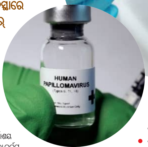
ଗର୍ଭାଶୟ ଗ୍ରାହୀ କର୍କଟ ସହିତ ସର୍ତ୍ତାଳକାଳ କ୍ୟାନ୍ସର

ସମ୍ପର୍କରେ ଅବଗତ ରୁହନ୍ତୁ । କୌଣସି ପ୍ରକାର ଅସ୍ୱାଭାବିକ ପରିବର୍ତ୍ତନ ଲକ୍ଷଣକଲେ ତାଙ୍କୁ ଉପଯୁକ୍ତ ପରାମର୍ଶ କରନ୍ତୁ । ଧୂମପାନ ନ କରି ଏବଂ ମଦ୍ୟପାନକୁ ସୀମିତ ରଖନ୍ତୁ । ଏଚ୍ପିଭିରୁ ସୁରକ୍ଷିତ ରହିବାକୁ ଚିକା ନିଅନ୍ତୁ । ଗୁରୁତ୍ୱପୂର୍ଣ୍ଣ କଥା ହେଉଛି, ଚିକା ନେଇ ଏବଂ ନିୟମିତ ଯାତ୍ରା କରାଇବା ଭଳି ସରଳ ପଦକ୍ଷେପଗୁଡ଼ିକ ଆପଣଙ୍କ ସର୍ତ୍ତାଳକାଳ କ୍ୟାନ୍ସରକୁ ଅନେକାଂଶରେ ଏଡ଼ାଇ ପାରିବେ । ନିଜ ସ୍ୱାସ୍ଥ୍ୟର ଉପଯୁକ୍ତ ଭାବେ ଯତ୍ନ ନେଇ ଏବଂ ପ୍ରତିଷେଧମୂଳକ ପଦକ୍ଷେପଗୁଡ଼ିକ ସମ୍ପର୍କରେ ଶିକ୍ଷାଲାଭ କରି, ଆପଣ ଏହି ଧରଣର କର୍କଟରେ ଆକ୍ରାନ୍ତ ହେବା ବିପଦକୁ ଉଲ୍ଲେଖନୀୟ ଭାବରେ ହ୍ରାସ କରିପାରିବେ ।