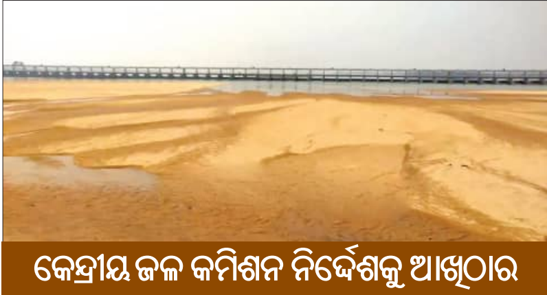
କେନ୍ଦ୍ରୀୟ ଜଳ କମିଶନ ନିର୍ଦ୍ଦେଶକୁ ଆଖିଠାର

■ ଝରସୁଗ୍ରା, ୪।୭ (ସମ୍ପାଦକ): ସରକାର ବଦଳିଲା; ଛତିଶଗଡ଼ ସହ କେନ୍ଦ୍ର ଓ ଓଡ଼ିଶାରେ ବିଜେପି ସରକାର ଚଳିଲା। ହେଲେ ମହାନଦୀ ଭାଗ୍ୟ ବଦଳିଲା ନାହିଁ। ଏବେ ଆଷାଢ଼ ମାସରେ ବି ମହାନଦୀରେ ପାଣିମୁହେ ନାହିଁ। ଓଡ଼ିଶା-ଛତିଶଗଡ଼ର ସାମାନ୍ତ ସୁଖାସୋଡ଼ା ଖୁଖିଲା ପଡ଼ିଛି। ଛତିଶଗଡ଼ ପାଣି ଛାଡ଼ୁ ନ ଥିବାରୁ ସୁଖାସୋଡ଼ା ଦେଇ ପ୍ରବାହିତ ମହାନଦୀରେ ବର୍ଷା ବିନେ ବି ବାଲି ଆଉ ବାଲି। କୁଳାଇ ପହିଲାରେ ହାରାକୁଦ ଜଳଭଣ୍ଡାରରେ ଯେତିକି ପାଣି ସଂରକ୍ଷିତ ରହିବା କଥା ଚାହାନାହିଁ। କେନ୍ଦ୍ରୀୟ ଜଳ କମିଶନର ନିର୍ଦ୍ଦେଶ ଅନୁସାରେ ଅଣ ମୌସୁମୀ ସମୟରେ କଳମା ବ୍ୟାରେଜର ଅନୁ୍ୟନ ୨୫ ଫୁଟ ପାଟକ ଖୋଲିବାକୁ ଛତିଶଗଡ଼ ବାଧ୍ୟ; ସେହିପରି ମୌସୁମୀରେ ସବୁ ପାଟକ ଖୋଲାଯିବାକୁ ନିୟମ ରହିଛି। ମାତ୍ର ନିୟମକୁ ଛତିଶଗଡ଼ ଆଖି ବୁଜି ଦେଇଛି। ଓଡ଼ିଶା ସରକାର ଏ ସମ୍ପର୍କରେ ସମ୍ପୂର୍ଣ୍ଣ ନିରବ, କେନ୍ଦ୍ର ସରକାର ଆଖିମୁଦି ବସିଛନ୍ତି। କୁଳମ ସହଜି ମହାନଦୀ ଓ ଓଡ଼ିଶାରେ ଏହାର ତତ୍ତ୍ୱାବଧାନ ଅଧିକାରୀ।