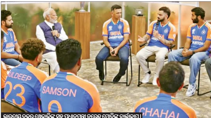
ଭାରତୀୟ ଦଳର ଖେଳାଳିଙ୍କ ସହ ପ୍ରଧାନମନ୍ତ୍ରୀ ନରେନ୍ଦ୍ର ମୋଦିଙ୍କ ବାର୍ତ୍ତାଳାପ

ନୂଆଦିଲ୍ଲୀ, ୪।୭ (ଏକେଡ଼ି): ଆମେରିକା ଓ ଖେଳାଳିଙ୍କୁ ଅନୁଷ୍ଠିତ ୧-୨୦ ବିଶ୍ୱକପର ୯ମ ସଂସ୍କରଣରେ ଚାମ୍ପିଅନ ହୋଇ ଇତିହାସ ସୃଷ୍ଟି କରିଥିବା ଭାରତୀୟ ଦଳ ଗୁରୁବାର ସକାଳେ ସ୍ୱଦେଶ ପ୍ରତ୍ୟାବର୍ତ୍ତନ କରିଛି। ନୂଆଦିଲ୍ଲୀରୁ ମୁମ୍ବାଇ ପହଞ୍ଚିବା ପରେ ଏହି ବିଶ୍ୱ ବିଜେତା ଦଳକୁ ଉଚ୍ଛ୍ୱସିତ ସ୍ୱାଗତ ସମ୍ବର୍ଦ୍ଧନା ଆପନ କରାଯାଇଛି। ଦଳର ଖେଳାଳିମାନେ ବିଜୟ ରଥ (ଓପନ ରୁଟ୍ ବସ) ଉପରେ ତ୍ରିରଙ୍ଗା ଓ ଚୁପି ସହ ମୁମ୍ବାଇ ନିର୍ମାଣ ପ୍ରସଙ୍ଗରେ ମେରାଇନ ଡ୍ରାଇଭ୍ ବେଳ ୨.୨ କିଲୋମିଟର ଯାତ୍ରା କରିବା ପରେ ଖାଖିତେ ଷ୍ଟାଡ଼ିୟମରେ ପହଞ୍ଚିଥିଲେ। ଶେଷରେ ଖାଖିତେ ଷ୍ଟାଡ଼ିୟମରେ ଏହି ବିଶ୍ୱ ଚାମ୍ପିଅନ ଦଳର ସମ୍ମାନ ସମାରୋହ ଆୟୋଜନ ପାଇଁ ସ୍ୱତନ୍ତ୍ର ବ୍ୟବସ୍ଥା ଗ୍ରହଣ କରାଯାଇଥିଲା। ଏହି ଉତ୍ସବରେ ଦଳର ଖେଳାଳି, ପ୍ରଶିକ୍ଷକ, ସାପୋର୍ଟସ୍ଟାଫ୍ମାନଙ୍କୁ ନଗର ୧୨୫ କୋଟି ଟଙ୍କାର ଆର୍ଥିକ ପୁରସ୍କାର ରାଶି ପ୍ରଦାନ କରାଯାଇଥିଲା। ଅଲାରଣ୍ଡର ହାର୍ଡିକ ପାଖ୍ୟା କାନ୍ଧରେ ଚୁପି