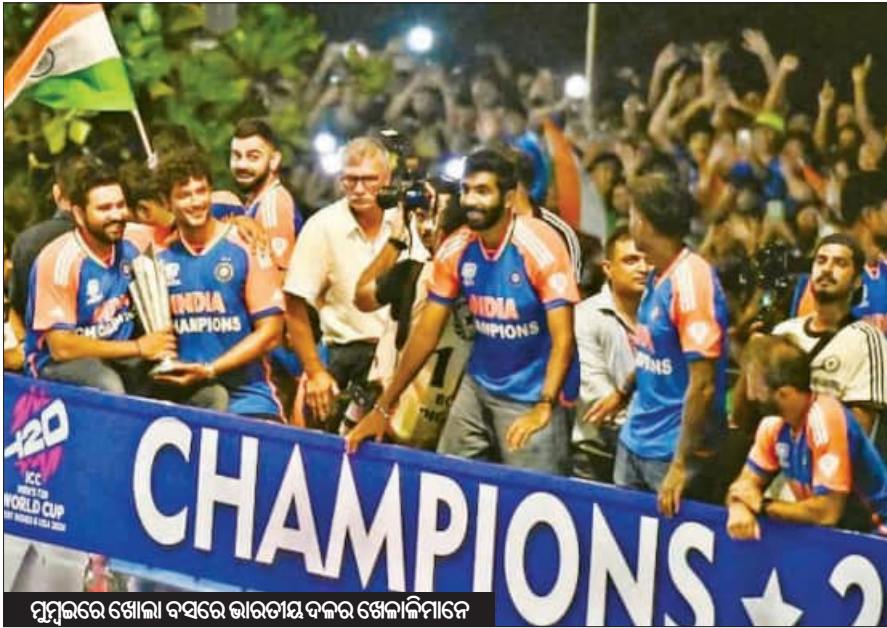
ମୁମ୍ବାଇରେ ଖୋଲା ବସରେ ଭାରତୀୟ ଦଳର ଖେଳାଳିମାନେ

ମେରାଇନ ଡ୍ରାଇଭ୍ରେ ୩ ଲକ୍ଷରୁ ଊର୍ଦ୍ଧ୍ୱ ପ୍ରଶଂସକ