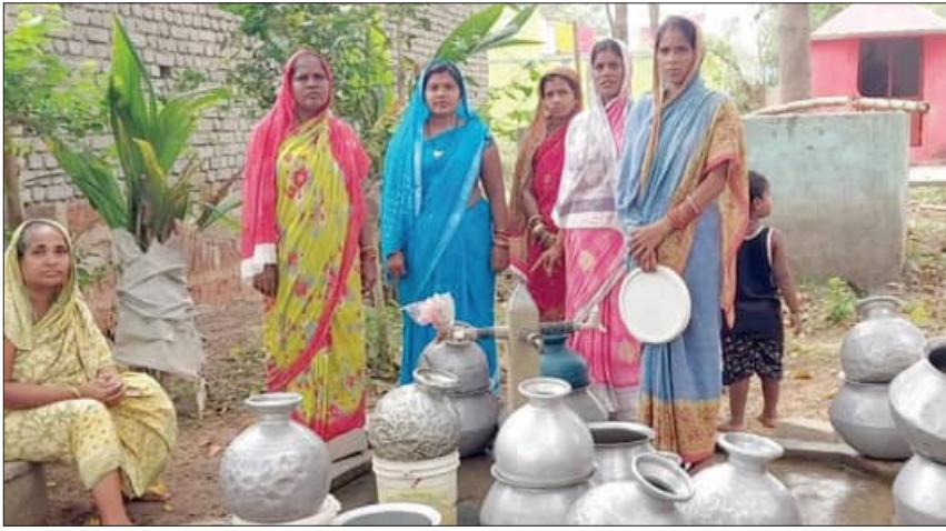
ପ୍ରତିଦିନ ପ୍ରତିଯୋଗିତା ରାଜିଛି। କିଏ ଗରା ମାଟିଆ ଧରି ପାଣି ପାଇଁ ଦାବି କଲେ ତାହା ଖରାପ ହୋଇଛି। ଯଦି ପାଣି ପାଇଁ ଦାବି କଲେ ତାହା ଖରାପ ହୋଇଛି। ଯଦି ପାଣି ପାଇଁ ଦାବି କଲେ ତାହା ଖରାପ ହୋଇଛି।

ସଦର ବ୍ଲକ ଅନ୍ତର୍ଗତ ଯବାନଙ୍କ ଗ୍ରାମ ଭୂଇଁପୁର ଗ୍ରାମରେ ଉତ୍ତମ ପାନୀୟଜଳ ସମସ୍ୟାକୁ ନେଇ ଗ୍ରାମବାସୀଙ୍କ ମଧ୍ୟରେ ତୀବ୍ର ଅସନ୍ତୋଷ ପ୍ରକାଶ ପାଇଛି। ପାନୀୟ ଜଳ ପାଇଁ ଗ୍ରାମବାସୀ ନାହିଁ ନଥିବା ଅଭିଯୋଗ ସମ୍ମୁଖୀନ ହେଉଥିବା ବେଳେ ସରକାରଙ୍କ ତରଫରୁ କରାଯାଇଥିବା ଯୋଜନା ବିଷୟରେ ଯେତେକ ପାଣି ଆସୁଛି, ତାହା ଗ୍ରାମବାସୀଙ୍କ ପାଇଁ ଯଥେଷ୍ଟ ହେଉନାହିଁ। ଗ୍ରାମବାସୀଙ୍କ ପାଇଁ ଭୂରନ୍ତ ପାନୀୟ ଜଳ ସମସ୍ୟା ଦୂର କରିବାକୁ ଦାବି କରାଯାଇଛି।