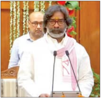
ଝାଡ଼ଖଣ୍ଡ ମୁକ୍ତି ମୋର୍ଚ୍ଚା(ଜେଏମଏମ୍)-କଂଗ୍ରେସ-ରାଷ୍ଟ୍ରୀୟ ଜନତା ଦଳ(ଆଇଜେଡି) ମେଣ୍ଟର ସଂଖ୍ୟାଗରିଷ୍ଠତା ଅଛି। ଏହି ମେଣ୍ଟର ହୃଦୟ ଦଳ ହେଉଛି >ପୃଷ୍ଠା-୯

■ ରାଷ୍ଟ୍ର, ୪।୭ (ଏକେନ୍ଦ୍ର): ଝାଡ଼ଖଣ୍ଡ ମୁଖ୍ୟମନ୍ତ୍ରୀ ଭାବେ ହେମନ୍ତ ସୋରେନ ଗୁରୁବାର ଅପରାହ୍ନରେ ଝାଡ଼ଖଣ୍ଡ ରାଜଭବନରେ ଆୟୋଜିତ ଏକ ବିଶେଷ ଉତ୍ସବରେ ଶପଥ ଗ୍ରହଣ କରିଛନ୍ତି। ତାଙ୍କୁ ରାଜ୍ୟପାଳ ସିପି ରାଧାକ୍ରିଷ୍ଣନ ଶପଥପାଠ କରାଇଥିଲେ। ତତ୍ପରେ ସୋରେନ ଗଡକାଳି ମୁଖ୍ୟମନ୍ତ୍ରୀ ପଦରୁ ଇସ୍ତଫା ଦେବା ପରେ ହେମନ୍ତ ସୋରେନ ରାଜଭବନ ପହଞ୍ଚି ରାଜ୍ୟପାଳଙ୍କୁ ଭେଟି ସରକାର ଗଠନ ପାଇଁ ତାଙ୍କର ଦାବି ଜଣାଇଥିଲେ। ରାଜ୍ୟପାଳ ରାଧାକ୍ରିଷ୍ଣନ ହେମନ୍ତଙ୍କୁ ସରକାର ଗଠିବାକୁ ନିମନ୍ତ୍ରଣ କରିଥିଲେ। ହେମନ୍ତ ସୋରେନ ଝାଡ଼ଖଣ୍ଡ ହାଇକୋର୍ଟରୁ ଗତ ୨୮ ତାରିଖରେ ଜାମିନ ପାଇଥିଲେ। ଝାଡ଼ଖଣ୍ଡ ବିଧାନସଭାରେ