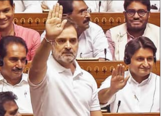
ତାଙ୍କ ଭାଷଣର ଯାଉଁ ଅଂଶକୁ ହଟାଇଛି ତାହା ରୁଲ୍ ୩୮୦ ପରିବର୍ତ୍ତନ ହୋଇନଥିବାରୁ କଟାଯିବା କଥା ନୁହେଁ। ଆରକେଡି ନେତା ମନୋଜ ଝା, ଆପ୍ ନେତା ସଞ୍ଜୟ ଦିଏ, ଶିବସେନା (ଉଦ୍ଧବ ଗାନ୍ଧୀ) ନେତା ସଞ୍ଜୟ ରାଉତ, କଂଗ୍ରେସ ନେତା ଶଶି ଅରୁଣ ପ୍ରମୁଖ କହିଛନ୍ତି, ରାହୁଲ ତାଙ୍କ ଭାଷଣରେ କିଛି ଭୁଲ କହିନାହାନ୍ତି।

ନୂଆଦିଲ୍ଲୀ, ୨୭ (ଏକେଡ଼ି): ଲୋକସଭାରେ ରାହୁଲଙ୍କ ଅଭିଭାଷଣ ପାଇଁ ଧନ୍ୟବାଦ ପ୍ରସ୍ତାବ ବିଚାରରେ ଭାଗନେଇ ବିରୋଧୀ ଦଳ ନେତା ରାହୁଲ ଗାନ୍ଧୀ ଗତକାଳ ସଭାରେ ବିକେପି, ଆର୍ଏସ୍‌ଏସ୍, ପ୍ରଧାନମନ୍ତ୍ରୀ ନରେନ୍ଦ୍ର ମୋଦୀ ଓ ତାଙ୍କ ସରକାରକୁ ଟାର୍ଗେଟ୍ କରି ନିୟମ-ଫାଲ୍-ସାମା-ନିୟମଣ ବିବର୍ତ୍ତିତ ଯେଉଁ ତୁମ୍ଭେ ଆଜୁଳକ ଭାଷଣ ଦେଇଥିଲେ ତାହାର ଅନେକାଂଶ ବାଚସ୍ପତି ଓମ୍ ବିଲ୍‌ଲିକ ନିର୍ଦ୍ଦେଶ କ୍ରମେ ଗୃହ ବିବରଣୀରୁ ହଟାଇ ଦିଆଯାଇଛି। ଶାସନ ଦଳର ନେତାମାନେ ସାମ୍ପ୍ରଦାୟିକ ବିଭେଦ ସୃଷ୍ଟି କରୁଥିବା ନେଇ ରାହୁଲଙ୍କ ବିକୃତିକୁ ଗୃହ ବିବରଣୀରୁ ହଟାଇଛି। ରାହୁଲଙ୍କ ହିନ୍ଦୁ ବିକେପି-ଆର୍ଏସ୍‌ଏସ୍-ପ୍ରଧାନମନ୍ତ୍ରୀ ନରେନ୍ଦ୍ର ମୋଦୀ, ଫଣ୍ଡାଲ୍ୟୁ, ନିର୍ଦ୍ଦେଶ ପ୍ରଶ୍ନ ବିଭ୍ରାଟ, ଅଗ୍ନିବାର ଭିନ୍ନ, ଶିଳ୍ପପତି ଆଦାନ-ଅମ୍ବାନି ଆଦି ନେଇ ବିକୃତି ଓ ମନ୍ତବ୍ୟଗୁଡ଼ିକୁ ମଧ୍ୟ ଗୃହ ବିବରଣୀରୁ ହଟାଇଛି। ପ୍ରତିକୃତ୍ୟରେ ରାହୁଲ କହିଛନ୍ତି, ମୋଦୀଙ୍କ ଜଗତରେ ସତ୍ୟକୁ ହଟାଇ ଦିଆଯାଇଥାଏ। କିନ୍ତୁ ବାସ୍ତବତା ହେଉଛି ସତ୍ୟକୁ କେବେ ହଟାଇବା ନ ଯାଉ। ଲୋକସଭାରେ ତାଙ୍କର ଯାହା କହିବାର ଥିଲା, ସେ କହିଛନ୍ତି ଓ ତାହା ସତ୍ୟ। ଗୃହ