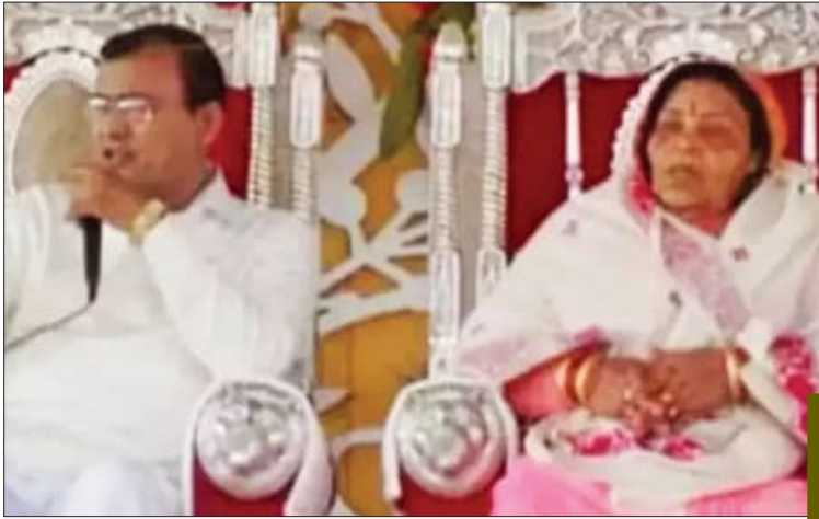
ହାଥରସ, ୨୭ (ଏକେଡ଼ି)

ଉତ୍ତର ପ୍ରଦେଶ (ୟୁପି) ର ହାଥରସ ପୁଲିସ୍‌ରେ ନିଯୁକ୍ତ ହୋଇଛି। ଚଳିତ ସତ୍‌ସଙ୍ଗ ପାଇଁ ନୂହେଁ, ବର୍ଷ ଭୋଲେ ବାବା (ଛତୁ ନାମ) କ ସତ୍‌ସଙ୍ଗ ପାଇଁ ଦେଶବିଦେଶରେ ଅପକାରୀ ଅଟେ। ଏହି ସତ୍‌ସଙ୍ଗରେ ଦକାତକଟା ହୋଇଛି। ଏଥିରେ ମହିଳା ଏବଂ ଶିଶୁ ପସି ଯାଇଛନ୍ତି। ୧୨୩ରୁ ଅଧିକ ଲୋକଙ୍କ ମୃତ୍ୟୁ ହୋଇଛି। ମୃତକଙ୍କ ମଧ୍ୟରେ ଅଧିକାଂଶ ଶିଶୁ, ବୃଦ୍ଧ ଏବଂ ମହିଳା ସାମିଲ ଅଛନ୍ତି। ମୃତ୍ୟୁବଂଶୀୟ ମଧ୍ୟ ବଢ଼ିବାରେ ସମ୍ଭାବନା ରହିଛି। ଅନେକ ଲୋକଙ୍କୁ ମେଡିକାଲରେ ଭର୍ତ୍ତି କରାଯାଇଛି। ଆମ୍ବୁଲାନ୍ସ ପରିବହନ ଉଲ୍ଲିଭିଲେ ଲୋକଙ୍କୁ ମେଡିକାଲ ନିଆଯାଇଛି। ଏହି ଅପତନରେ କରୁଣ ଚିତ୍ର ଭାଙ୍ଗିବା ହେବାରେ ଲାଗିଛି। ଏହି ଅପତନରେ ନେଇ ଭୋଲେ ବାବା କିଏ ବୋଲି ପ୍ରଶ୍ନ ଉଠୁଛି। କେମିତି ତାଙ୍କୁ ଏତେ ବଡ଼ ଆଘାତ କରାଯାଇଛି ଅନୁମତି ଦିଆଗଲା,