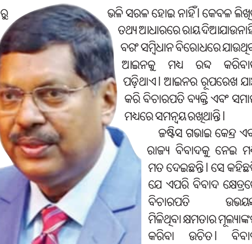
କଲି ସରକାର ହୋଇ ନାହିଁ। କେବଳ ଲିଖିତ ତଥ୍ୟ ଆଧାରରେ ରାୟ ଦିଆଯାଉନାହିଁ, ବର୍ଷ ସମ୍ପାଦନା ବିରୋଧରେ ଯାଉଥିବା ଆଇନକୁ ମଧ୍ୟ ରଦ୍ଦ କରିବାକୁ ପଡ଼ିଥାଏ। ଆଇନର ରୂପରେଖ ଯାଞ୍ଚ କରି ବିଚାରପତି ବ୍ୟକ୍ତି ଏବଂ ସମାଜ ମଧ୍ୟରେ ସମ୍ବନ୍ଧ ରଖିଥାନ୍ତି। ଜଷ୍ଟିସ ଗଭାଜ କେନ୍ଦ୍ର ଏବଂ ରାଜ୍ୟ ବିବାଦକୁ ନେଇ ମଧ୍ୟ ମତ ଦେଇଛନ୍ତି। ସେ କହିଛନ୍ତି ଯେ ଏପରି ବିବାଦ କ୍ଷେତ୍ରରେ ବିଚାରପତି ଉତ୍ତରପ୍ରଦେଶ ମିଳିଥିବା କ୍ଷମତାର ମୂଲ୍ୟାଙ୍କନ କରିବା ଉଚିତ। ବିବାଦ ସମାଧାନ କୋର୍ଟଙ୍କ କର୍ତ୍ତବ୍ୟ। କାହାର କେଉଁ ସାମ୍ପ୍ରଦାୟିକ କ୍ଷମତା ରହିଛି ତାହା ବିଚାରପତି ଜଣାଇବା ଉଚିତ। ସେହିପରି ବିଚାରପତି ସରକାରୀ ଭାଷଣରେ ରାୟ ଦେବା ଉଚିତ। ଏହା ଦ୍ୱାରା ଅନ୍ତର୍ଦ୍ଧି ବ୍ୟକ୍ତି ପର୍ଯ୍ୟନ୍ତ ରାୟ ପହଞ୍ଚିବ।

ସମାନ ଯୋଗଦାନ ରହିଛି। କେହି କାହାଠାରୁ ଅଧିକ କ୍ଷମତାଶାଳୀ ନୁହଁନ୍ତି। ଓକିଲଙ୍କ ସହ ଖରାପ ବ୍ୟବହାର କଲେ କଂଗ୍ରେସ ଗରିମା ବଢ଼େ ନାହିଁ, ବର୍ଷ ଯିବେ ହୋଇଥାଏ। ସେହିପରି ବିଚାରପତିଙ୍କ ବିନା ବରିଷ୍ଠ ସରକାରୀ ଅଧିକାରୀଙ୍କୁ କୋର୍ଟକୁ ଡକାଇବାର ପ୍ରଥା ବନ୍ଦ ହେବା ଉଚିତ। କିଛି ବିଚାରପତି ବରିଷ୍ଠ ଅଧିକାରୀଙ୍କୁ କୋର୍ଟକୁ ଡକାଇ ଖୁସି ହେଉଛନ୍ତି। ଆଜି କିଛି ବିନା ଭାବିଚିନ୍ତି ରାୟ ଦେଇ ଦେଇଛନ୍ତି। ସରକାରୀ ଅଧିକାରୀଙ୍କୁ ନିଜ କର୍ତ୍ତବ୍ୟ ପାଳନ କରିବାକୁ ପଡ଼ିଥାଏ, ଏହା ବିଚାରପତି ବୃତ୍ତିର ଉଚିତ ଅଧିକାରୀଙ୍କ ଆଚରଣ ରୁକ୍ଷ ନ ହେବା ପର୍ଯ୍ୟନ୍ତ ଏକଲି ନିର୍ଦ୍ଦେଶ ଦେବାକୁ ବିରତ ରହିବା ଆବଶ୍ୟକ। ସାମାଜିକ ଗଣମାଧ୍ୟମ ମୁହଁରେ ବିଚାରପତି ବାସ୍ତବ ଚାପ ଦ୍ୱାରା ପ୍ରଭାବିତ ନ ହେବା ଉଚିତ। ନ୍ୟାୟ ପ୍ରକ୍ରିୟା ଏବେ ଆଉ ଗଣିତ ସମାଧାନ