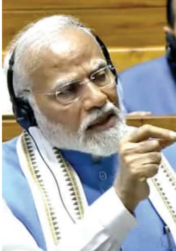
ରାଷ୍ଟ୍ରପତିଙ୍କ ଅଭିଭାଷଣ ଉପରେ ଧନ୍ୟବାଦ ପ୍ରସ୍ତାବ ଗୃହୀତ ଲୋକସଭା ଅଧିବେଶନରେ ମୁଖ୍ୟମନ୍ତ୍ରୀ

■ ନୂଆଦିଲ୍ଲୀ, ୨୬ (ଏକେନ୍ଦ୍ର): ରାଷ୍ଟ୍ରପତିଙ୍କ ଅଭିଭାଷଣ ଉପରେ ଆଗତ ଧନ୍ୟବାଦ ପ୍ରସ୍ତାବ ଉପରେ ଆଲୋଚନା କରି ମଙ୍ଗଳବାର ଲୋକସଭାରେ ପ୍ରଧାନମନ୍ତ୍ରୀ ନରେନ୍ଦ୍ର ମୋଦୀ ବିରୋଧୀ ଦଳ ନେତା ରାହୁଲ ଗାନ୍ଧୀଙ୍କ ‘ହିଁସୁକ’ ବୟାନ ଉପରେ ଜବାବ ରଖିଛନ୍ତି। ଅଷ୍ଟାଦଶ ଲୋକସଭାରେ ସ୍ୱତନ୍ତ୍ର ଅଧିବେଶନର ସମ୍ପର୍କ ଦିନରେ ରାହୁଲଙ୍କ ନାଁ ନ ନେଇ କଂଗ୍ରେସକୁ ନିଶାଣ କରି ପ୍ରଧାନମନ୍ତ୍ରୀ ମୋଦୀ ବର୍ଣ୍ଣନା କରିଛନ୍ତି ଏବଂ ଦଳ ଫିଲ୍ଡରେ ଉପସ୍ଥାପନ କରିବା ପରେ ମୋଦୀ ପ୍ରତି କୁଠାରୋପ କରିଛନ୍ତି ବୋଲି ସେ କହିଛନ୍ତି। ବିଶେଷକରି ହିଁସୁମାନଙ୍କ ପ୍ରତି ରାହୁଲ ଗାନ୍ଧୀ ଯେଭଳି ମନ୍ତବ୍ୟ ଦେଇଛନ୍ତି ତାହାକୁ ତୀବ୍ର ବିରୋଧ କରି ମୋଦୀ କହିଛନ୍ତି ଯେହିଁସୁକ ହିଁସୁକ କହିବା କଂଗ୍ରେସର ପରମ୍ପରା ହୋଇ ରହିଆସିଛି। ହିଁସୁମାନେ ହିଁସୁ ଏବଂ ଦଳାଚକଟା ସହିତ ଜଡ଼ିତ ବୋଲି ରାହୁଲ ଦେଇଥିବା ମନ୍ତବ୍ୟକୁ ଦେଖିବା ସମୟରେ ମୋଦୀ କହିଛନ୍ତି ଯେହିଁସୁ ହିଁସୁକ ପ୍ରସ୍ତୁତ ହିଁସୁ ନାହିଁ; ବରଂ ହିଁସୁକ ସହନଶୀଳତା ପାଇଁ ଆଜି ଗଣତନ୍ତ୍ର ଚିହ୍ନି ରହିଛି। କିନ୍ତୁ କଂଗ୍ରେସ ହିଁସୁ ସମାଜ ବିରୋଧୀ ହେବା ପରେ ଆଜି ଶତ୍ରୁତା ଚଳାଇଛି ବୋଲି ମୋଦୀ କହିଛନ୍ତି। କେବଳ ହିଁସୁ କଥା ନୁହେଁ, ଭଲିଏମ ଏବଂ ସମ୍ପ୍ରଦାୟକୁ ନେଇ ମଧ୍ୟ କଂଗ୍ରେସ ନିର୍ଭରଶୀଳ