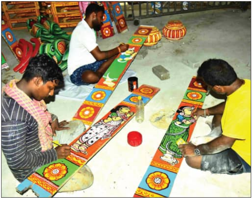
କନ୍ୟା ପଟାକୁ ରଙ୍ଗ ଦିଆଯାଉଛି