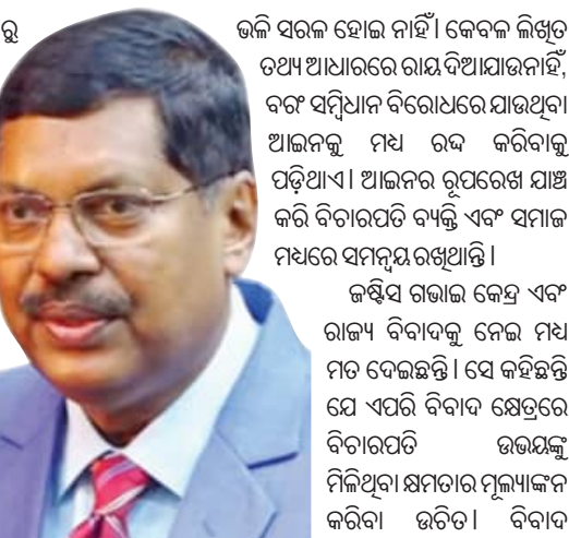
କଲି ସରକାର ହୋଇ ନାହିଁ। କେବଳ ଲିଖିତ ତଥ୍ୟ ଆଧାରରେ ରାୟ ଦିଆଯାଉନାହିଁ, ବର୍ଷ ସମ୍ପ୍ରଦାନ ବିରୋଧରେ ଯାଉଥିବା ଆଇନକୁ ମଧ୍ୟ ରଦ୍ଦ କରିବାକୁ ପଡ଼ିଥାଏ। ଆଇନର ରୂପରେଖ ଯାଞ୍ଚ କରି ବିଚାରପତି ବ୍ୟକ୍ତି ଏବଂ ସମାଜ ମଧ୍ୟରେ ସମ୍ବନ୍ଧ ରଖିଥାନ୍ତି। ଜଷ୍ଟିସ ଗଭାଜ କେନ୍ଦ୍ର ଏବଂ ରାଜ୍ୟ ବିବାଦକୁ ନେଇ ମଧ୍ୟ ମତ ଦେଇଛନ୍ତି। ସେ କହିଛନ୍ତି ଯେ ଏପରି ବିବାଦ କ୍ଷେତ୍ରରେ ବିଚାରପତି ଉତ୍ତରକୁ ମିଳିଥିବା କ୍ଷମତାରେ ମୂଲ୍ୟାଙ୍କନ କରିବା ଉଚିତ। ବିବାଦ ସମାଧାନ କୋର୍ଟଙ୍କ କାର୍ଯ୍ୟ। କାହାର କେଉଁ ସାମ୍ପ୍ରଦାୟିକ କ୍ଷମତା ରହିଛି ତାହା ବିଚାରପତି ଜଣାଇବା ଉଚିତ। ସେହିପରି ବିଚାରପତି ସରକାର ଭାଷଣରେ ରାୟ ଦେବା ଉଚିତ। ଏହା ଦ୍ୱାରା ଅନ୍ତର୍ଦ୍ଧି ବ୍ୟକ୍ତି ପର୍ଯ୍ୟନ୍ତ ରାୟ ପହଞ୍ଚିବ।

ସମାନ ଯୋଗଦାନ ରହିଛି। କେହି କାହାଠାରୁ ଅଧିକ କ୍ଷମତାଶାଳୀ ନୁହଁନ୍ତି। ଓକିଲଙ୍କ ସହ ଖରାପ ବ୍ୟବହାର କଲେ କଂଗ୍ରେସ ଗରିମା ବଢ଼େ ନାହିଁ, ବର୍ଷ ଯାଏଁ ହୋଇଥାଏ। ସେହିପରି ବିଚାରପତିଙ୍କ ବିନା ବରିଷ୍ଠ ସରକାରୀ ଅଧିକାରୀଙ୍କୁ କୋର୍ଟକୁ ଡକାଇବାର ପ୍ରଥା ବନ୍ଦ ହେବା ଉଚିତ। କିଛି ବିଚାରପତି ବରିଷ୍ଠ ଅଧିକାରୀଙ୍କୁ କୋର୍ଟକୁ ଡକାଇ ଖୁସି ହେଉଛନ୍ତି। ଆଜି କିଛି ବିନା ଭାବିଚିତ୍ତି ରାୟ ଦେଇ ଦେଇଛନ୍ତି। ସରକାରୀ ଅଧିକାରୀଙ୍କୁ ନିଜ କର୍ତ୍ତବ୍ୟ ପାଳନ କରିବାକୁ ପଡ଼ିଥାଏ, ଏହା ବିଚାରପତି ବୃତ୍ତିର ଉଚିତ ଅଧିକାରୀଙ୍କ ଆଚରଣ ରୁକ୍ଷ ନ ହେବା ପର୍ଯ୍ୟନ୍ତ ଏକଲି ନିର୍ଦ୍ଦେଶ ଦେବାକୁ ବିରତ ରହିବା ଆବଶ୍ୟକ। ସାମାଜିକ ଗଣମାଧ୍ୟମ ମୁହଁରେ ବିଚାରପତି ବାସ୍ତବ ଚାପ ଦ୍ୱାରା ପ୍ରଭାବିତ ନ ହେବା ଉଚିତ। ନ୍ୟାୟ ପ୍ରକ୍ରିୟା ଏବେ ଆଉ ଗଣିତ ସମାଧାନ