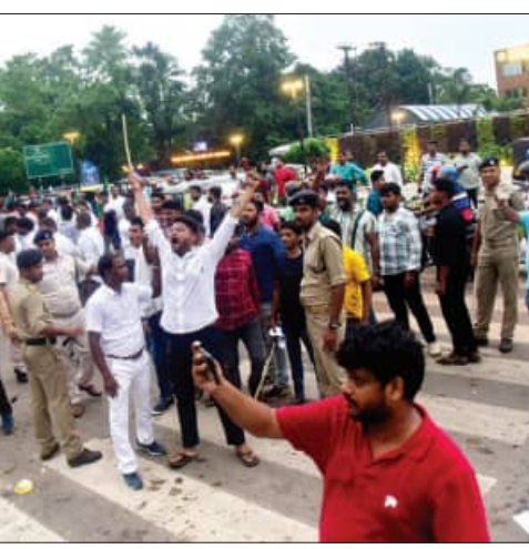
ମାଷ୍ଟରକ୍ୟାଣ୍ଡିନ୍ ଛକରେ ଛାତ୍ର କଂଗ୍ରେସ କର୍ମୀ ଓ ବିଜେପି ଯୁବମୋର୍ଚ୍ଚା କର୍ମୀଙ୍କ ମଧ୍ୟରେ ଟୁମୁଲକାଣ୍ଡ