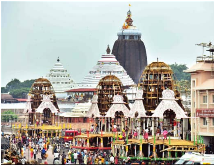
ରଥଯାତ୍ରାକୁ ଆଉ ୪ ଦିନ

ହାଦଶାରେ ରାଜପ୍ରସାଦ ବିଜେ ନାତି ରହିଛି। ଶ୍ରୀମନ୍ଦିର ପରିଦିଅଁଙ୍କ ନିକଟରେ ମଧ୍ୟାହ୍ନ ଧୂପ ଏବଂ ଦକ୍ଷିଣା ଘର ଭୋଗ ବଢ଼ିବା ପରେ ଜୟବିଜୟ ହାର ବନ୍ଦ ହୋଇ ବେହେରଣ ହାର ଖୋଲିଥିଲା। ଏହାପରେ ଅଣସର ଗୃହରେ ଥିବା ଚତୁର୍ଦ୍ଧାବିଗ୍ରହଙ୍କ ଅଣସର ନାତି ଆରମ୍ଭ ହୋଇଥିଲା। ଶୁକ୍ଳସୁଆରଙ୍କ ଘରୁ ଆସିଥିବା ଖଳି ଠାକୁରଙ୍କୁ ଲାଗି କରାଯିବା ସହିତ ରକ୍ତବସ୍ତ୍ର ଲାଗି କରାଯାଇଥିଲା। ପରେ ଚକଟା ଭୋଗ ଏବଂ ପଣ୍ଡାଭୋଗ ହୋଇ ବେହେରଣ ହାର ବନ୍ଦ ହୋଇଥିଲା। ଜୟ ବିଜୟ ହାରା ଖୋଲି ପରିଦିଅଁଙ୍କ ନାତି ଆରମ୍ଭ ହୋଇଥିଲା। ପରିଦିଅଁଙ୍କ ସନ୍ଧ୍ୟା ଆଳତି ଏବଂ ସନ୍ଧ୍ୟାଧୂପ ବଢ଼ିବା ପରେ ବେହେରଣ ହାର ଖୋଲିଥିଲା। ପରିଦିଅଁଙ୍କ ସର୍ବାଙ୍ଗ ଆରମ୍ଭ ହେବା ସହ ଅଣସର ଗୃହରେ ଘଣ୍ଟ, କାହାଳୀ ବାଜି ଚତୁର୍ଦ୍ଧାବିଗ୍ରହଙ୍କ ସର୍ବାଙ୍ଗ ହୋଇଥିଲା। ସର୍ବାଙ୍ଗ ବଢ଼ିବା ପରେ ଗାତିଗୋବିନ୍ଦ ଖଣ୍ଡୁଆ, ରଙ୍ଗୀନ ସୁରକ୍ଷିତ ପୁଷ୍ପ, ଗୁଣା, ଝୁମ୍ପା, କରପଲ୍ଲବ, ହୃଦୟପଦକ ଏବଂ ତୁଳସୀ ଲାଗି କରାଯାଇଥିଲା। ସ୍ନାନପୂର୍ଣ୍ଣିମା ପରେ ମହାପ୍ରଭୁ ପ୍ରଥମ ତୁଳସୀ ଧାରଣ କରିଥିଲେ। ଏହାପରେ ବୈଦ୍ୟ ସେବକଙ୍କ ଘରୁ ଆସିଥିବା ଦଶମୁକକୁ ପରିମହାପ୍ରଭୁ ସେବକ ସଂସ୍କାର କରିବା ପରେ ଦକ୍ଷତାପତିମାନେ ଦାରୁଦିଗ୍ରହଙ୍କୁ ଲାଗି କରାଇଥିଲେ।