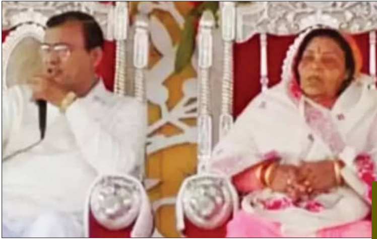
ହାଥରସ, ୨୭ (ଏକେଡ଼ି)

ଉତ୍ତର ପ୍ରଦେଶ (ୟୁପି) ର ହାଥରସ ପୁଲିସ୍‌ରେ ନିଯୁକ୍ତ ହୋଇଛି। ଚଳିତ ସତ୍‌ସଙ୍ଗ ପାଇଁ ନୂହେଁ, ବର୍ଷ ଭୋଲେ ବାବା (ଛତୁ ନାମ) କ ସତ୍‌ସଙ୍ଗ ପାଇଁ ଦେଶବିଦେଶରେ ଅପକାରି ଅଟେ। ଏହି ସତ୍‌ସଙ୍ଗରେ ଦକାତକଟା ହୋଇଛି। ଏଥିରେ ମହିଳା ଏବଂ ଶିଶୁ ପସି ଯାଇଛନ୍ତି। ୧୨୩ରୁ ଅଧିକ ଲୋକଙ୍କ ମୃତ୍ୟୁ ହୋଇଛି। ମୃତକଙ୍କ ମଧ୍ୟରେ ଅଧିକାଂଶ ଶିଶୁ, ବୃଦ୍ଧ ଏବଂ ମହିଳା ସାମିଲ ଅଛନ୍ତି। ମୃତ୍ୟୁବଂଶୀୟ ମଧ୍ୟ ବଢ଼ିବାରେ ସମ୍ଭାବନା ରହିଛି। ଅନେକ ଲୋକଙ୍କୁ ମେଡିକାଲରେ ଭର୍ତ୍ତି କରାଯାଇଛି। ଆମ୍ବୁଲାନ୍ସ ପରିବହନ ଉଲ୍ଲିଭିଲେ ଲୋକଙ୍କୁ ମେଡିକାଲ ନିଆଯାଇଛି। ଏହି ଅପତନରେ କରୁଣ ଚିତ୍ର ଭାଙ୍ଗିବା ହେବାରେ ଲାଗିଛି। ଏହି ଅପତନରେ ନେଇ ଭୋଲେ ବାବା କିଏ ବୋଲି ପ୍ରଶ୍ନ ଉଠୁଛି। କେମିତି ତାଙ୍କୁ ଏତେ ବଡ଼ ଆଘାତ କରାଯାଇଛି ଅନୁମତି ଦିଆଗଲା,