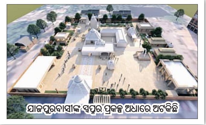
ଯାଜପୁରବାସୀଙ୍କ ସ୍ଵପ୍ନର ପ୍ରକଳ୍ପ ଅଧୀନେ ଅଟକିଛି