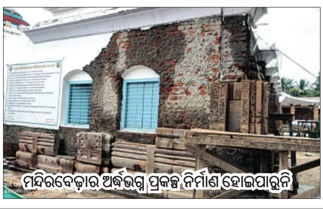
ମନ୍ଦିରବେଢ଼ାର ଅର୍ଦ୍ଧତ୍ରୱା ପ୍ରକଳ୍ପ ନିର୍ମାଣ ହୋଇପାରୁନି

ଯାଜପୁରର ଷେଡ଼େସରା ମା' ବିରଜା ପ୍ରକଳ୍ପ ପାଇଁ ସରକାର ୫ ପରିକ୍ରମା ପ୍ରକଳ୍ପ ପାଇଁ ସରକାର ୪ ବର୍ଷ ତଳୁ ନାକନକ୍ସା ଆକିଛି ।