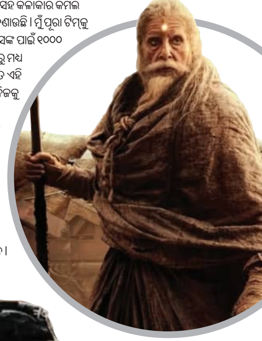
'କଲକି ୨୮ ୯୮' ଇତିହାସରେ ୨୭ରେ ମୁକ୍ତିଲାଭ କରିଥିଲା । ବହୁତ ଜଳଜି ଏହାର ଦ୍ୱିତୀୟ ପାର୍ଟର ନିର୍ମାଣ ହେବ ।

ନାଗ ଅଶ୍ୱିନଙ୍କ ଚଳଚ୍ଚିତ୍ର 'କଲକି ୨୮ ୯୮' ଇତିହାସରେ ସାରା ବିଶ୍ୱରେ ୧୦୦୦ କୋଟି ଆୟ କରି ସାରିଛି । ଏହି ସଫଳତା ପରେ ଫିଲ୍ମରେ ଅଶ୍ୱିନୀମା ଭୂମିକାରେ ଅଭିନୟ କରିଥିବା ଅମିତାଭ ବଚ୍ଚନ ଏକ ଭିତ୍ତି ଓ ସେୟାର କରିଛନ୍ତି । ଏହି ଭିତ୍ତିରେ ବିଭିନ୍ନ ଦର୍ଶକଙ୍କୁ ଧନ୍ୟବାଦ ଜଣାଇଛନ୍ତି । ଏହାସହ ସେ ପ୍ରଭାସଙ୍କୁ ପ୍ରଶଂସା ମଧ୍ୟ କରିଛନ୍ତି । ଅମିତାଭ କହିଛନ୍ତି, 'ମୁଁ ଆପଣ ସମସ୍ତଙ୍କୁ ଧନ୍ୟବାଦ କହିବାକୁ ଚାହୁଁଛି । ଆପଣମାନଙ୍କ ଯୋଗୁ ଫିଲ୍ମ ଆଜି ୧୦୦୦ କୋଟି ଆୟ କରିବାରେ ସଫଳ ହୋଇ ପାରିଛି । ମୁଁ ମୋର ସହ କଳାକାର କମଳ ହାସନ, ପ୍ରଭାସ ଓ ଦୀପିକା ପାଠ୍ୟକୋନ୍ନକ ମଧ୍ୟ ଏଥିପାଇଁ ଧନ୍ୟବାଦ ଜଣାଉଛି । ମୁଁ ପୁରା ଫିଲ୍ମ ଏଥିପାଇଁ ଶୁଭେଚ୍ଛା ଜଣାଉଛି ।' ସେ ଆହୁରି ମଧ୍ୟ କହିଛନ୍ତି- 'ପ୍ରଭାସଙ୍କ ପାଇଁ ୧୦୦୦ କୋଟି ଫିଲ୍ମ ଏକ ରୁଟିନ୍ ହୋଇଗଲାଣି । କାରଣ ପୂର୍ବରୁ ମଧ୍ୟ ସେ ଏଭଳି ସଫଳତା ହାସଲ କରିଛନ୍ତି । ମୋତେ ଏହି ଫିଲ୍ମରେ କାମ କରିବାକୁ ସୁଯୋଗ ମିଳିଥିବାରୁ ନିଜକୁ ଧନ୍ୟ ମନେ କରୁଛି । ମୁଁ ଏହି ଫିଲ୍ମକୁ ଏସାବଦ୍ଦ ଚାରି ଥର ଦେଖିସାରିଛି । ମୋର ଆଶା ଅଛି ମୁଁ ଏହାର ଦ୍ୱିତୀୟ ପାର୍ଟରେ ବି ନଜର ଆସିବି ।'