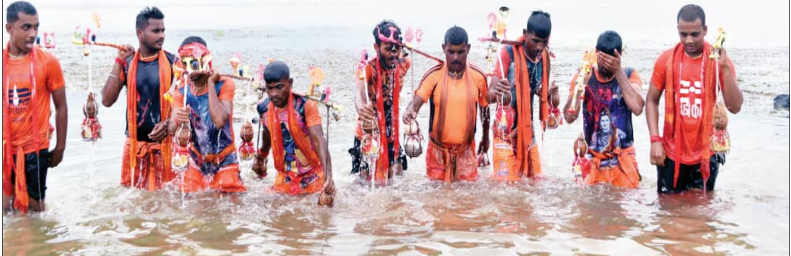
ଶ୍ରୀରାମ ପ୍ରଥମ ସୋମବାରରେ ଜଳଲାଗି ପାଇଁ କାଉଡ଼ିଆମାନେ ଗଡ଼କଡ଼ିଆ ଘାଟରୁ ପାଣି ନେଉଛନ୍ତି