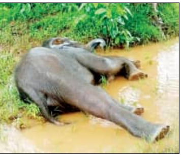
ହାତୀଟିକୁ କାନ୍ଦୁ କରିବା ପାଇଁ ଚେଷ୍ଟା କରି ବିପଦ ହୋଇଥିଲା। କିଛି ସମୟ ପରେ ନିକଟସ୍ଥ ଏକ ଜଙ୍ଗଲିଆ ଜାଗାରେ ହାତୀର ମୃତଦେହ ଦେଖିବାକୁ ମିଳିଥିଲା। ହାତୀ ମୃତ୍ୟୁର କାରଣ ଅସ୍ପଷ୍ଟ ଥିବା ବେଳେ ବ୍ୟବହୃତ ରିପୋର୍ଟ ଆସିବା ପରେ ଘଟଣାର ସର୍ବୋତ୍ତମ ଜଣାପଡ଼ିବ ବୋଲି ବନବିଭାଗ ଅଧିକାରୀମାନେ ପ୍ରକାଶ କରିଛନ୍ତି।

ବାବନ୍ଦ ସେକ୍ସନ ଅଞ୍ଚଳରେ ୧୨ଟି ହାତୀ ଚଳପ୍ରକଳ କରୁଛନ୍ତି। ସେମାନଙ୍କ ମଧ୍ୟରୁ ଏକ ଛୁଆ ହାତୀ ଶୁକ୍ରବାର ଦଳରୁ ଅଲଗା ହୋଇଯାଇଥିଲା। ହାତୀଟିର ଶାରୀରିକ ଅସୁସ୍ଥତା ଥିବା ନେଇ ସନ୍ଦେହ ପ୍ରକାଶ କରି ବନଖଣ୍ଡ ଅଧିକାରୀଙ୍କ ସହିତ ହିରୋଲ ପ୍ରାଣୀ ଚିକିତ୍ସକ, କପିଳାସ ଚିକିତ୍ସାଖାନା ପ୍ରାଣୀ ଚିକିତ୍ସକ ଟିଏ ଘଟଣାସ୍ଥଳରେ ପହଞ୍ଚି ହାତୀର ଗତିବିଧି ଉପରେ ନଜର ରଖିଥିଲେ। ପ୍ରଥମେ ହାତୀଟି ବୋମା ଚୋରାଜ ଦେଇଥିବା ସନ୍ଦେହ କରାଯାଉଥିବା ବେଳେ ରାତି ପର୍ଯ୍ୟନ୍ତ ହାତୀଟିର ସମ୍ଭାବନ ଅଧିକାରୀମାନେ ପାଇପାରି ନଥିଲେ। ଶନିବାର ସକାଳୁ ପ୍ରାକ୍ୱାଲାଇଜର ଟିଏ ସହ ବନ ବିଭାଗ ଅଧିକାରୀମାନେ ପହଞ୍ଚି