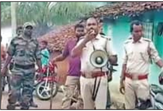
୧୦ ଦିନରେ ଖାଇଲାଣି ୨ ବାହୁରା