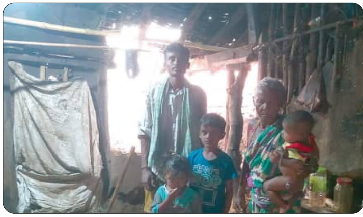
କୋକସରା, ୨୧୨୭ (ସମ୍ପିପ)

ଲଗୁତା ପ୍ରଭାବରେ ଗତ ଚାରିଦିନ ଧରି କଳାହାଣ୍ଡି ଜିଲ୍ଲା କୋକସରା ଅଞ୍ଚଳରେ ଝିପିଝିପି ବର୍ଷା ଲାଗିରହିଛି। ଘଡ଼ଘଡ଼ି ସହ ମଝିରେ ମଝିରେ ପ୍ରବଳ ବର୍ଷା ମଧ୍ୟ ହେଉଛି। ତେବେ ଲଗାଣ ବର୍ଷା ଯୋଗୁଁ ବୁଦ୍ଧ ଅନେକ ଲୋକଙ୍କ