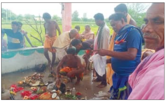
କଳାମୁଣ୍ଡା, ୨୧୨୭ (ସମ୍ପିପ): କଳାହାଣ୍ଡି ଜିଲ୍ଲା କଳାମୁଣ୍ଡା ବୁଦ୍ଧ ଚିଷ୍ଟିତା ମା' ଭୂଆସୁଣୀ ପାଠରେ କାଦୋ ଯାତ୍ରା ଉପଯାପିତ ହୋଇଯାଇଛି। ଚାଷୀ ଏହି ଯାତ୍ରା ପରେ ଚା'ର ଚାଷ ଜମିରେ ଚୁଆ, ବିହୁଡ଼ା କାର୍ଯ୍ୟ ଆରମ୍ଭ କରିଥାଏ। ଗ୍ରାମର ଇଷ୍ଟଦେବୀ ମା' ଭୂଆସୁଣୀ ହୋଇଥିବାରୁ ଶହଶହ ଭକ୍ତ