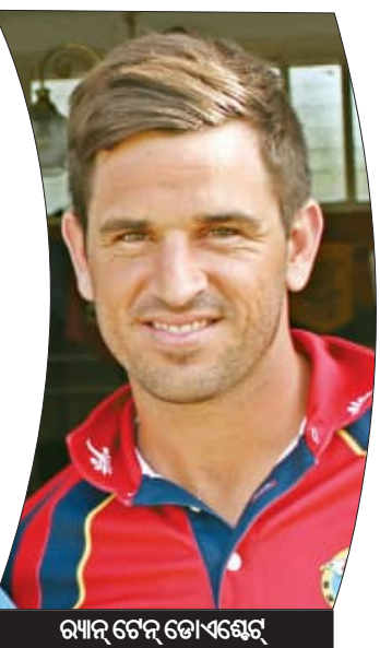
ରମାନ ଟେନ୍ ଡୋହେଟ୍