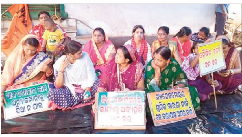
କର୍ମଚାରୀମାନେ ଯେଉଁମାନେ କି ମଜଦୁର ଫାନ୍ଦର ଧାରଣା ଦେବକୁ ବାଧ୍ୟ ହେଲେ। କମ୍ପାନୀରେ କାର୍ଯ୍ୟରତ ସମସ୍ତ ଅଛନ୍ତି ସେମାନେ ପରିବାର ସହ କମ୍ପାନୀ ଆଗରେ ଶହେ ଜଣ କର୍ମଚାରୀ ସେମାନଙ୍କ ପରିବାର ସହିତ

ପାରାଦୀପ, ୨୦୨୩ (ସମ୍ପାଦକ): ପାରାଦୀପ ଭଲ ଶିଳ୍ପ ସହରରେ କାର୍ଯ୍ୟରତ ଶ୍ରମିକଙ୍କ ସମସ୍ୟା ସବୁବେଳେ ଲାଗିରହିଛି। ପାରାଦୀପ ସହରରେ ଥିବା ଆଇଡିଆଇ କମ୍ପାନୀ କର୍ମଚାରୀଙ୍କ ମଧ୍ୟରେ ଏହି ଶ୍ରମିକ ଅଗାଧି ଆଜି ଉଗ୍ରରୂପ ନେଇଛି। ମୁଖ୍ୟ ଫାଟକ ସମ୍ମୁଖରେ ଆଇଡିଆଇ କମ୍ପାନୀର କର୍ମଚାରୀମାନେ ସେମାନଙ୍କ ପରିବାର ସହ ପାରାଦୀପ ପୋର୍ଟ ମଜଦୁର ଫାନ୍ଦର କର୍ମଚାରୀ ସଭାକୁ ଧାରଣାରେ ବସିଛନ୍ତି। କମ୍ପାନୀର ୪ ଜଣ କର୍ମଚାରୀଙ୍କୁ ସେଆଇନ ଭାବେ ଅନ୍ୟତ୍ର ବଦଳି କରାଯିବା ଘଟଣାର ପ୍ରତିବାଦରେ ଏହି ଧାରଣା ଦିଆଯାଇଛି। ମ୍ୟାନେଜମେଣ୍ଟର ଶ୍ରମିକମାନଙ୍କ ନୀତିକୁ ବିରୋଧ କରିଛନ୍ତି କର୍ମଚାରୀ। ମଜଦୁର ସଂଘ ପକ୍ଷରୁ ଏ ସମ୍ପର୍କରେ କମ୍ପାନୀ କର୍ତ୍ତୃପକ୍ଷ ଓ ପ୍ରଶାସନକୁ ଅବଗତ କରାଯାଇଥିଲା। ହେଲେ କମ୍ପାନୀ କର୍ତ୍ତୃପକ୍ଷ କୌଣସି କଥା କର୍ଣ୍ଣପାତ କରିନେଇ ନାହିଁ। ଫଳରେ ଆଜିଠାରୁ କମ୍ପାନୀ