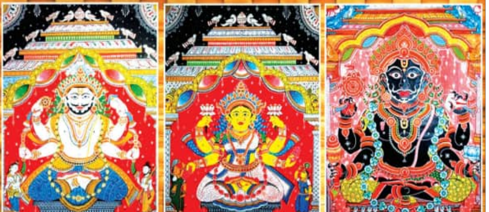
ଶ୍ରୀବାସୁଦେବ ମା' ଭୁବନେଶ୍ୱରୀ ଶ୍ରୀନାରାୟଣ

ପଢ଼ି ଉପରେ ଚିତ୍ରକାର ସେବକମାନେ ପାରମ୍ପରିକ ଶୈଳୀରେ ଚିତ୍ର ପ୍ରତିମାମାନ ଅଙ୍କନ କରିଥାନ୍ତି। ସ୍ୱତନ୍ତ୍ର ତୁଳିକାରେ ଏହି ଚିତ୍ର ପ୍ରତିମାଙ୍କ ସୂକ୍ଷ୍ମ ରାଜୁକଳା ଅତଏବ ମନୋମୁଗ୍ଧକର ତଥା ଆକର୍ଷଣୀୟ ଅଟେ। ସାଧାରଣତଃ ତିନୋଟି ଚିତ୍ର ପ୍ରତିମା ମଧ୍ୟରେ ଶ୍ରୀକରନାଥଙ୍କ ସ୍ୱରୂପ ଶ୍ରୀନାରାୟଣ (ମତାନ୍ତରେ ଶ୍ରୀଅନନ୍ତ ନାରାୟଣ) ଶ୍ରୀବଳଭଦ୍ରଙ୍କ ସ୍ୱରୂପ ଶ୍ରୀ ବାସୁଦେବ (ମତାନ୍ତରେ ଶ୍ରୀ ଅନନ୍ତ ବାସୁଦେବ) ଓ ଦେବୀ ସୁଭଦ୍ରାଙ୍କ ସ୍ୱରୂପ ଶ୍ରୀଭୁବନେଶ୍ୱରୀ ଅଟନ୍ତି। ପଢ଼ିରେ ସୁଶୋଭିତ ଶ୍ରୀନାରାୟଣ ଚିତ୍ର ପ୍ରତିମା ପଦ୍ମାସନରେ ବିରାଜିତ ପୂର୍ବକ ଚାଳି ହସ୍ତରେ ଶଙ୍ଖ, ଚକ୍ର, ଗଦା, ପଦ୍ମ ଧାରଣ କରିଥାନ୍ତି। ଦକ୍ଷିଣ ପାର୍ଶ୍ୱ ଦକ୍ଷରେ ଶ୍ରୀବସୁ ପଦ୍ମ ଚିହ୍ନ ରହିଥାଏ। ଗଳା ଦେଶରେ