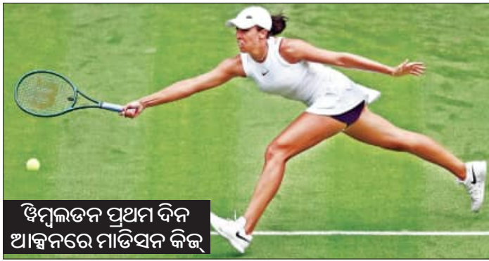
ଓପେଲ୍ ଡେଲିଗୋରାଙ୍କ ପ୍ରଥମ ଦିନ ଆସ୍ତନରେ ମାଡିସନ କିଙ୍ଗ୍