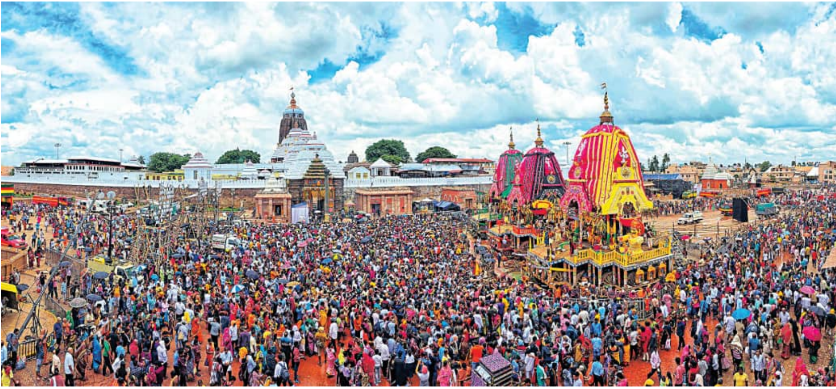
ଉପର ପକ୍ଷରେ ଅଧରପଣା ନୀତି ଦେଖିବାକୁ ଶ୍ରୀକ୍ଷେତ୍ର ଆକାଶରେ ମେଘମାଳା, ବଡ଼ଦାଣ୍ଡରେ ଭକ୍ତଙ୍କ ଗହଳ