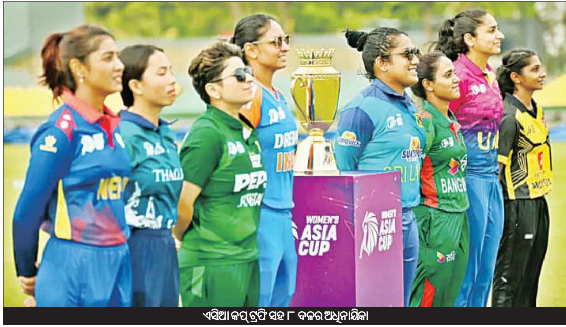
ଏସିଆ କପ୍ ଟ୍ରଫି ସହ ୮ ଦଳର ଅଧିନାୟିକା

କାମୁଲା, ୧୮।୭ (ଏକେକ୍ସ): ମହିଳା ଏସିଆ କପ୍ କ୍ରିକେଟ୍ ପ୍ରତିଯୋଗିତାର ୯ମ ସଂସ୍କରଣ ଶୁକ୍ରବାରଠାରୁ ଶ୍ରୀଲଙ୍କାରେ ଆରମ୍ଭ ହେବାକୁ ଯାଉଛି। ୧୨-୨୦ ଫର୍ମାଟ୍ରେ ଖେଳାଯିବାକୁ ଥିବା ଏହି ପ୍ରତିଯୋଗିତାର ଉଦ୍‌ଘାଟନା ମ୍ୟାଚ୍ ସ୍ଥଳ ଓ ନେପାଳ ମହିଳା କ୍ରିକେଟ୍ ଦଳ ମଧ୍ୟରେ ଅନୁଷ୍ଠିତ ହେବ। ସେହିଭଳି ଶୁକ୍ରବାର ରାତିରେ ଏକ ହାଇଲାଇଟ୍‌ରେ ମୁକାବିଲାରେ ଡିପେଟ୍ଟି ରାମ୍ପିଅନ ଭାରତ ତାର ଚିରପ୍ରତିଦ୍ୱନ୍ଦ୍ୱୀ ପାକିସ୍ତାନକୁ ଭେଟିବ। ଏହି ମ୍ୟାଚ୍ ଜିତି ହରମନପ୍ରାୟ କୌଣସି ନେତୃତ୍ୱାଧୀନ ଭାରତ ଏସିଆ କପ୍ରେ ଅଭିଯାନ ଆରମ୍ଭ କରିବା ଲକ୍ଷ୍ୟରେ ରହିଛି। ଆଗାମୀ ଅକ୍ଟୋବରରେ ଆଇସିସି ୧୨-୨୦ ବିଶ୍ୱକପ୍ ଆୟୋଜିତ ହେବାକୁ ଯାଉଥିବାରୁ ଏହି ଫର୍ମାଟ୍ରେ ଖେଳାଯିବାକୁ ଥିବା ଏସିଆ କପ୍ ହରମନପ୍ରାୟ ଦଳ ଲାଗି ବେଶ୍ ଶୁଭ୍‌ବନ୍ଧନ କରୁଛି। ଏସିଆ କପ୍ ୪୪ର ୧୨-୨୦ ଫର୍ମାଟ୍ରେ ଖେଳାଯାଇଥିବାବେଳେ ସେଥିରୁ ଭାରତ ୩ଥର