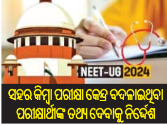
ସହର କିମ୍ବା ପରୀକ୍ଷା କେନ୍ଦ୍ର ବଦଳାଇଥିବା ପରୀକ୍ଷା ଆଁକ ତଥ୍ୟ ଦେବାକୁ ନିର୍ଦ୍ଦେଶ

■ ନୂଆଦିଲ୍ଲୀ, ୧୮।୭ (ଏକେଡ଼ି): ନିର୍ଦ୍ଦେଶ ପ୍ରସଙ୍ଗରେ ସୁପ୍ରିମକୋର୍ଟ ଗୁରୁବାର ଶୁଣାଣି କରିବା ସହିତ ୨୦ ତାରିଖ ଦିନ ୧୨ଟା ସୁଦ୍ଧା ଏନଟିଏ(ନିୟମାବଳୀ ଟେଷ୍ଟ ଏକେଡ଼ି) ଏହାର ଖେତ୍ରସୀମାରେ ପରୀକ୍ଷା ଫଳାଫଳ ପ୍ରକାଶ କରିବାକୁ ନିର୍ଦ୍ଦେଶ ଦେଇଛନ୍ତି। ପରୀକ୍ଷା ଆଁକ ପରିଚୟ ଗୋପନ ରଖି ସହର ଏବଂ ପରୀକ୍ଷା କେନ୍ଦ୍ର ଅନୁଯାୟୀ କେଉଁ ଛାତ୍ର କେତେ ମାର୍କ ହାସଲ କରିଛନ୍ତି ତାହାର ତଥ୍ୟ ପୂର୍ଣ୍ଣ ଭାବେ ପ୍ରକାଶ କରିବାକୁ ସର୍ବୋଚ୍ଚ ନ୍ୟାୟାଳୟ ଏନଟିଏକୁ କହିଛନ୍ତି।