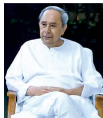
ଜଣେ ମନ୍ତ୍ରାଳୟ କାର୍ଯ୍ୟକୁ ଜରିା ଦେଇ ୩ ବିଜେଡି ବିଧାୟକ

■ ଭୁବନେଶ୍ୱର, ୧୭।୭ (ସମ୍ପାଦକ): ସରକାରଙ୍କୁ ଜରିଆ ଦେଇ ଛାୟା କ୍ୟାବିନେଟ୍ ଲଂଲଣ, ଅଷ୍ଟେଲିଆ, କାନାଡ଼ା, କାପାନ, ଦୁଧିଲାଣ୍ଡ, ଦକ୍ଷିଣ ଆଫ୍ରିକା ଆଦି ଦେଶ ଦ୍ୱାରା ରାଜ୍ୟର ସ୍ୱାଧୀନତା ଓ ରାଜ୍ୟବାସୀଙ୍କ ହିତ ଦୃଷ୍ଟିରୁ ବିଜେଡି ସୁପ୍ରିମୋ ତଥା ବିରୋଧୀ ଦଳ ନେତା ନବୀନ ପଟ୍ଟନାୟକ ରାଜ୍ୟରୁ ଛାୟା କ୍ୟାବିନେଟ୍ ପ୍ରଥମଥର ପାଇଁ ବିରୋଧୀ ଆସନରେ ବସିଥିବା ବିଜେଡି ଦେଶରେ ପ୍ରଥମଥର ପାଇଁ ଏପରି ବ୍ୟବସ୍ଥାର ପ୍ରଚଳନ କରିଛି। ବିଭିନ୍ନ ସରକାରୀ ଯୋଜନା, କାର୍ଯ୍ୟକ୍ରମକୁ ରାଜ୍ୟବାସୀଙ୍କ ହିତକ୍ଷେତ୍ର ପରିଚାଳନା ପାଇଁ ବିଜେଡି ସୁପ୍ରିମୋ ତଥା ବିରୋଧୀ ଦଳ ନେତା ନବୀନ ପଟ୍ଟନାୟକ ଓଠ ବିଧାୟକଙ୍କୁ ବିଭିନ୍ନ ବିଭାଗର ଦାୟିତ୍ୱ ପ୍ରଦାନ କରିଛନ୍ତି। ରାଜ୍ୟ ସରକାରଙ୍କ ୩୬ ବିଭାଗ ଓ ୧୭ ମନ୍ତ୍ରାଳୟ କାର୍ଯ୍ୟକୁ ଏହି ବିଧାୟକମାନେ ଜରିା ଦେଇ ଚାଲୁ ପ୍ରଦାନ କରାଯାଇଥିବା ବିଭାଗଗୁଡ଼ିକର କାର୍ଯ୍ୟ ଓ ଯୋଜନାର ଅନୁଧ୍ୟାନ କରିବେ। ଲୋକଙ୍କ ସ୍ୱାର୍ଥ ପାଇଁ କାର୍ଯ୍ୟ କରିବେ, ରାଜ୍ୟ ବା ରାଜ୍ୟବାସୀଙ୍କ ସ୍ୱାର୍ଥହୀନ ଆଖକାଥୁ ପ୍ରସଙ୍ଗଗୁଡ଼ିକୁ ତିହ୍ନଟ କରି ସରକାରଙ୍କୁ ଯୋଗାଏ। ୨୪ ବର୍ଷର ଶାସନ ପରେ ପ୍ରଥମଥର ବିରୋଧୀ ଆସନରେ ବସିଛି ବିଜୁ ଜନତା ଦଳ। ଏହି ପାଳିରେ ଏକ ସୁଦକ୍ଷ ଏବଂ