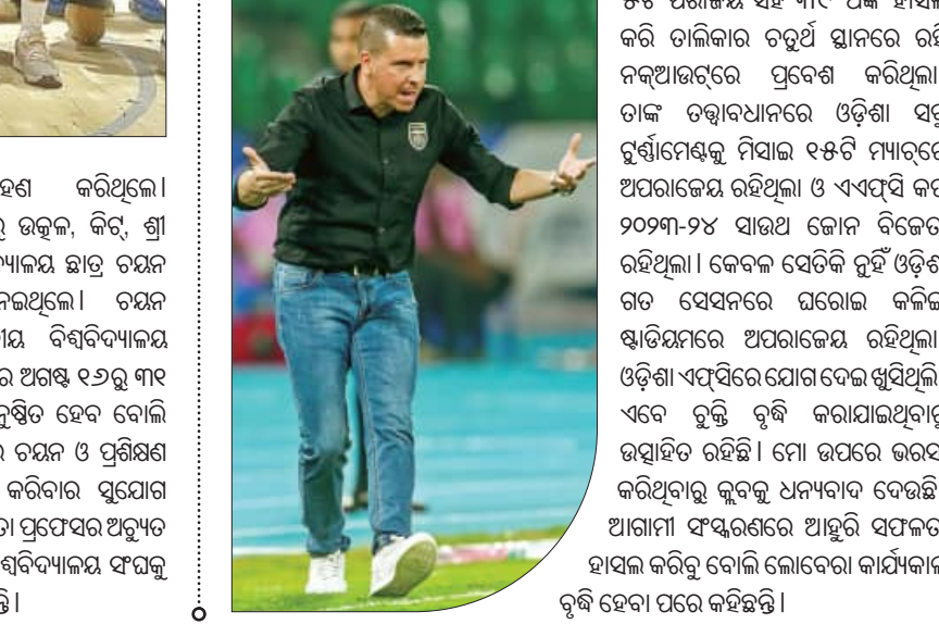
ଓଏସସି ମୋଟ୍‌ଗାଟ୍ ମ୍ୟାଚ୍‌ରେ ଖେଳୁଥିବା ଓଡ଼ିଶା ଟୁର୍କିସ୍ କୁର୍ଚ୍

୪୭ ବର୍ଷ ଲୋବେରାଙ୍କ ତତ୍ତ୍ଵାବଧାନରେ ଓଡ଼ିଶା ଏସ୍‌ସି ମୋଟ୍‌ଗାଟ୍ ମ୍ୟାଚ୍ ଖେଳି ୨୧ଟି ବିଜୟ ହାସଲ କରିବା ସହ ୧୦ଟି ମ୍ୟାଚ୍‌ରେ ପରାସ୍ତ ହୋଇଛି ଓ ୬ଟି ମ୍ୟାଚ୍‌ରେ ଟାଇମ୍‌ଆଉଟ୍ ରହିଛି।