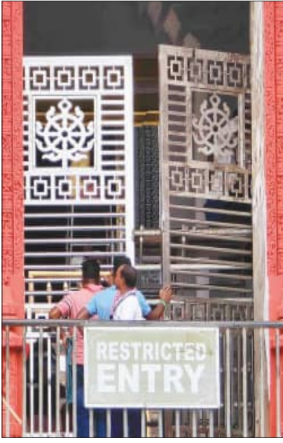
ବାଇଶି ପାହାଚ ଗୁମୁଟରେ ଲାଗିଲା ନୂଆ ଗେଟ୍