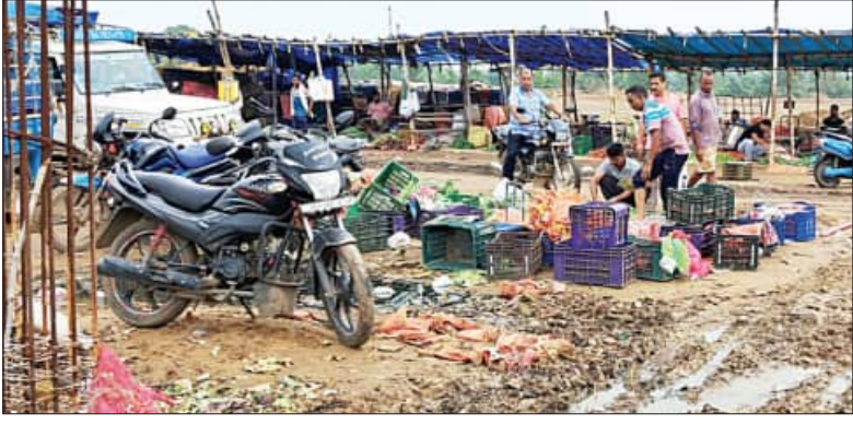
ଯାକପୁର, ୧୪୧୭ (ସମିପ)

ରାସ୍ତା ଉପରେ ଚାଲିଛି ପରିବା ହାଟ। ଖୋଦ ଜିଲ୍ଲାପାଳଙ୍କ ଅଫିସ ସମ୍ମୁଖରେ ଏଭଳି ଦାଉଁସିନ ଧରି ଚାଲି ଆସିଛି ଏହି ହାଟ। ଫଳରେ ଲୋକେ ଯାତାୟାତ ନେଇ ସମସ୍ୟା ଭୋଗୁଥିବାବେଳେ ରାସ୍ତା ଉପରେ ବସୁଥିବା ବ୍ୟବସାୟୀଙ୍କ ଜୀବନ ପ୍ରତି ବିପଦ ସୃଷ୍ଟି କରୁଛି। ଯାକପୁର ଜିଲ୍ଲାପାଳଙ୍କ ଅଫିସ ସମ୍ମୁଖରେ ଏଭଳି ଘଟଣା ପ୍ରତିଦିନ ଘଟୁଥିଲେ ମଧ୍ୟ ପ୍ରଶାସନ ପକ୍ଷରୁ କୌଣସି