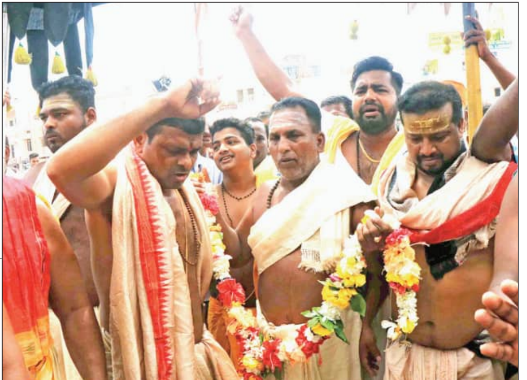
ରତ୍ନଭଣ୍ଡାର ପ୍ରବେଶ ପୂର୍ବରୁ ଲୋକନାଥଙ୍କ ଆଜ୍ଞାପାଳ ଦେଇ ଯାଉଛନ୍ତି ସେବାୟତ