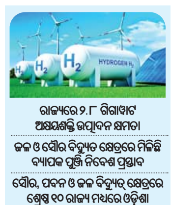
ରାଜ୍ୟରେ ୨.୮ ଶିଗାଝାଟ୍ ଅକ୍ଷୟ ଶକ୍ତି ଉତ୍ପାଦନ ଉପରେ

■ ଭୁବନେଶ୍ୱର, ୧୪୧୭ (ସମ୍ପାଦକ): ରାଜ୍ୟରେ ଅକ୍ଷୟ ଶକ୍ତି କ୍ଷେତ୍ରରେ ବିପ୍ଳବ ସମ୍ଭାବନା ଥିବାବେଳେ ଏ ନେଇ ରାଜ୍ୟ ସରକାର ବିଶେଷ ପଦକ୍ଷେପ ନେଉଛନ୍ତି। ବିଶେଷକରି ବିଦ୍ୟା ବିଜ୍ଞେତ ସରକାର ଅକ୍ଷୟ ଶକ୍ତି କ୍ଷେତ୍ରରେ ରାଜ୍ୟକୁ ସମୃଦ୍ଧ କରିବା ପାଇଁ ଅକ୍ଷୟ ଶକ୍ତି ନୀତି-୨୦୨୨ ପ୍ରଣୟନ କରିଥିଲେ। ଏହି ନୀତି ଅଧିନରେ ଅକ୍ଷୟ ଶକ୍ତି ନିବେଶ କ୍ଷେତ୍ରରେ ରାଜ୍ୟ ସରକାର ବହୁ ଆକର୍ଷଣୀୟ ପଦକ୍ଷେପ ନେଇଥିବା ବେଳେ ଅନେକ ରିଆର୍ଟି ପ୍ରଦାନ କରୁଛନ୍ତି। ଯାହା ନିବେଶକଙ୍କୁ ଓଡ଼ିଶା ମୁହାଁ କରିବାରେ ସଫଳ ହୋଇପାରିଛି। ଚଳିତବର୍ଷ ଜୁନ ସୁଦ୍ଧା ରାଜ୍ୟରେ ସମ୍ଭାବିତ ଅକ୍ଷୟ ଶକ୍ତି ଉତ୍ପାଦନ ଉପରେ ପ୍ରାୟ ୨.୮ ଶିଗାଝାଟ୍ ରହିଛି। ଭାରତୀୟ ଅକ୍ଷୟ ଶକ୍ତି ବିକାଶ