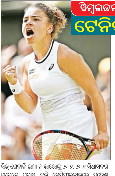
ସିଡ୍ ଖେଳାଳି ଜମା ନାଭାରୋଙ୍କୁ ୬-୨, ୬-୧ ସିଧାସଳଖ ସେଟ୍‌ରେ ପରାସ୍ତ କରି ସେମିଫାଇନାଲରେ ପ୍ରବେଶ କରିଥିଲେ। ପାଓଲିନି ଏବେ ଫାଇନାଲ ପାଇଁ ଶନିବାର ଦ୍ୱିତୀୟ ସେମିଫାଇନାଲରେ ବିଜୟିନୀ ରହୁଥିବେ। ଚତୁର୍ଥ ସିଡ୍ କାକାଖିୟାନର ଏଲିନା ରିବାକିନା କିମ୍ବା ୩୯ତମ ସିଡ୍ ତେକ ଗଣରାଜ୍ୟର ବାସୋରା କ୍ରେକିସିକୋଭାକୁ ଭେଟିବେ। ପାଓଲିନି ଗତମସାରେ ଅନୁଷ୍ଠିତ ଫ୍ରେଣ୍ଡ୍ ଓପନ୍ ଫାଇନାଲରେ ୨-୬, ୧-୬ ସେଟ୍‌ରେ ପୋଲୋଣ୍ଡର ଜମା ସିଆରେକଙ୍କଠାରୁ ପରାସ୍ତ ହୋଇ ରନର୍ସଅପ୍‌ରେ ସହସ୍ତ ହୋଇଥିଲେ। ତତ୍‌କାଳୀନ ମାନ୍ୟତାରେ ୬ମ ସ୍ଥାନରେ ରହିଥିବା ପାଓଲିନି ଏପର୍ଯ୍ୟନ୍ତ କ୍ୟାରିୟରରେ ଦୁଇଟି ଏକକ ଓ ୪ଟି ଯୁଗ୍ମ ଫାଇନାଲ ଜିତିଛନ୍ତି।

ଲଣ୍ଡନ, ୧୧।୭ (ଏକେନ୍ଦ୍ରି): ଇଟାଲୀ ମହିଳା ଟେନିସ୍ ଚାଳି ପାଓଲିନି ଇତିହାସ ସୃଷ୍ଟି କରିଛନ୍ତି। ଚଳିତ ଫିମ୍ପଲଡନ ଟେନିସ୍ ଚୁର୍ଣ୍ଣାମେଣ୍ଟରେ ସେ ମହିଳା ଏକକ ଫାଇନାଲରେ ପ୍ରବେଶ କରିଛନ୍ତି। ଗୁରୁବାର ଅନୁଷ୍ଠିତ ପ୍ରଥମ ସେମିଫାଇନାଲ ମୁକାବିଲାରେ ୬ମ ସିଡ୍ ମାନ୍ୟତା ପାଇଥିବା ପାଓଲିନି ୨-୬, ୬-୪, ୬-୬ ସେଟ୍‌ରେ କ୍ୟୁଏସିଆର ଟୋନା ଭେକିକକୁ ହରାଇ ଫାଇନାଲ ଟିକେଟ୍ ହାସଲ କରିଛନ୍ତି। ଏଥିସହ ୨୮ ବର୍ଷୀୟ ପାଓଲିନି ପ୍ରଥମ ଇଟାଲୀ ମହିଳା ଖେଳାଳି ଭାବେ ଫିମ୍ପଲଡନ ଫାଇନାଲରେ ପ୍ରବେଶ କରି ଏତିହାସିକ ସଫଳତା ଅର୍ଜନ କରିଛନ୍ତି। ସେ ଦ୍ୱିତୀୟଥର ପାଇଁ କୌଣସି ଗ୍ରାଣ୍ଡସ୍ଲାମ ଚୁର୍ଣ୍ଣାମେଣ୍ଟର ଫାଇନାଲକୁ ଉଠିଛନ୍ତି। ପ୍ରଥମ ସେଟ୍‌ରେ ପରାସ୍ତ ହୋଇଥିଲେ ମଧ୍ୟ ସେ ପ୍ରତ୍ୟାବର୍ତ୍ତନ କରି ବାକି ଦୁଇଟି ସେଟ୍‌ରେ ବିଜୟ ହୋଇଥିଲେ। ଦ୍ୱିତୀୟ ସେଟ୍‌ରେ ସହଜରେ ହାତେଇଥିଲେ ମଧ୍ୟ ସେ ତୃତୀୟ ସେଟ୍‌ରେ ଜିତିବାକୁ କଡ଼ା ଫର୍ସଟ୍ କରିଥିଲେ। କିମ୍ବଦନ୍ତୀ ଆମେରିକୀୟ ମହିଳା ଖେଳାଳି ସେରେନା ୱିଲିୟମ୍‌ସ୍‌ଙ୍କ ପରେ ସେ ପ୍ରଥମ ମହିଳା ଖେଳାଳି ଭାବେ ଗୋଟିଏ ସିଜନରେ ଉଭୟ ଫ୍ରେଣ୍ଡ୍ ଓପନ୍ ଓ ଫିମ୍ପଲଡନ ଫାଇନାଲରେ ପ୍ରବେଶ କରିଛନ୍ତି। ଏହାପୂର୍ବରୁ ସେ ମଙ୍ଗଳବାର ଜାରି ଫାଇନାଲରେ ଆମେରିକୀୟ ୧୯ତମ