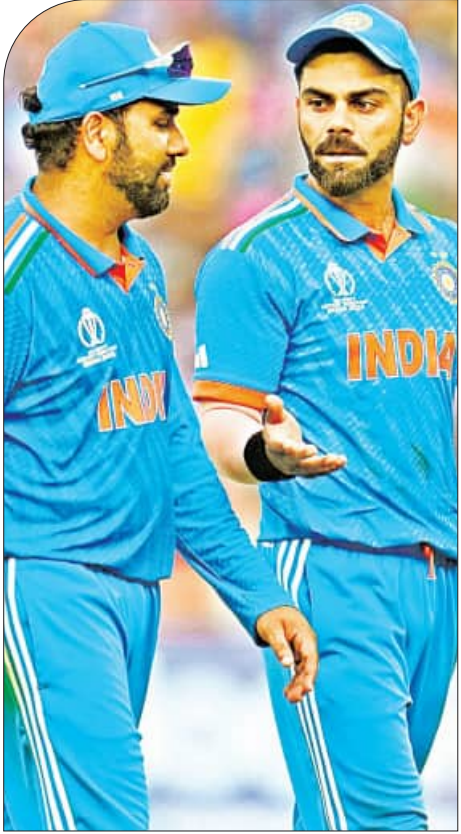
ନୂଆଦିଲ୍ଲୀ, ୧୧।୭ (ଏକେନ୍ଦ୍ରି): ଆସନ୍ତାବର୍ଷ ଫେବୃଆରୀ-ମାର୍ଚ୍ଚ ମାସରେ ପାକିସ୍ତାନରେ ଆୟୋଜନ ହେବ ଅନ୍ତର୍ଜାତୀୟ କ୍ରିକେଟ୍ ପରିଷଦ (ଆଇସିସି) ଚାମ୍ପିୟନ୍ସ ଟ୍ରଫିର ୯ମ ଫେସ୍ଟର। ତେବେ ଭାରତ ଆଇସିସିର ଏହି ବଡ଼ ଚୁର୍ଣ୍ଣାମେଣ୍ଟ ଖେଳିବାକୁ ପାକିସ୍ତାନ ଗସ୍ତ କରିବ ନାହିଁ ବୋଲି