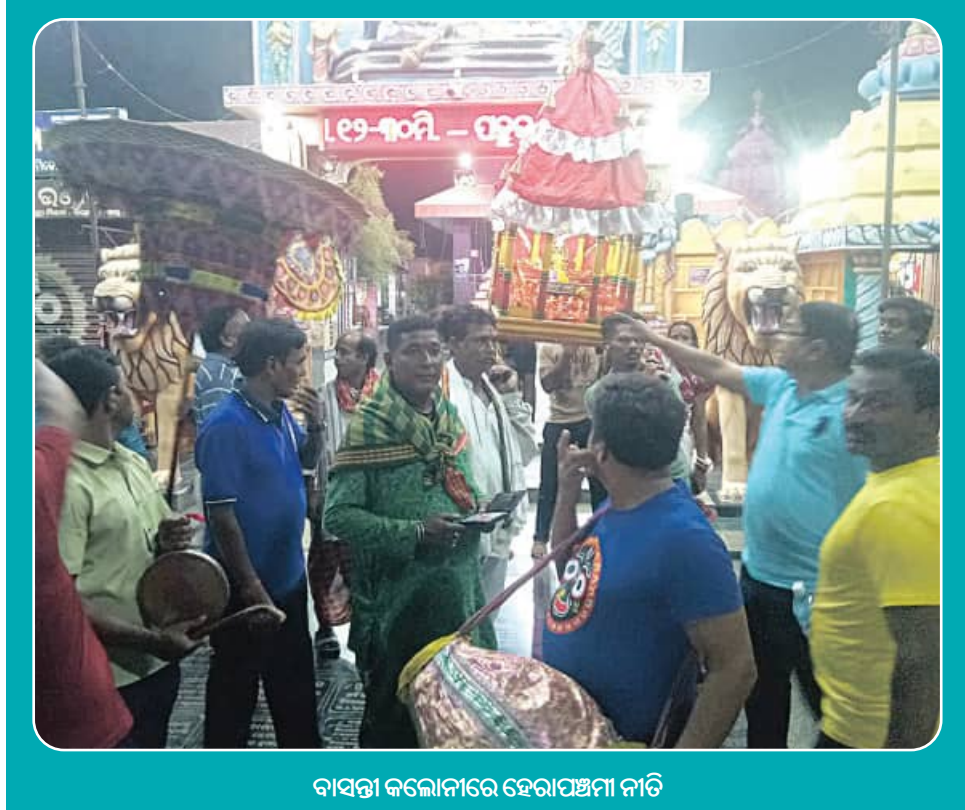
ବାସନ୍ତା କଲୋନୀରେ ହେରାପଞ୍ଚମୀ ନୀତି