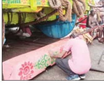
କର୍ତ୍ତବ୍ୟଦାରେ ପହଞ୍ଚି ପାରି ନ ଥିଲା ବୁଝୁତାଲଧିକ। ତୃତୀୟ ଦିନରେ ରଥ ଚକଡ଼ା ଲାଗିପାରିନି। ପ୍ରଣାସନର ସମ୍ପୂର୍ଣ୍ଣ ତ୍ରୁଟି ରହିଥିବାରୁ ଆଜି ଏହିଭଳି ଅବସ୍ଥା ଦେଖିବାକୁ ମିଳିଛି ବୋଲି ଜଣେ ସେବାୟତ କହିଛନ୍ତି।

କଟକ, ୯।୭(ସମିପ): ବାଲେଶ୍ୱର ଜିଲ୍ଲାର କଳାକାରଙ୍କୁ ମୁଖ୍ୟମନ୍ତ୍ରୀ କଳାକାର ସହାୟତା ଯୋଜନାରେ ସହାୟତା ପ୍ରଦାନ ପ୍ରସଙ୍ଗକୁ ନେଇ ହାଇକୋର୍ଟରେ ଦାୟର ଜନସ୍ୱାର୍ଥ ମାମଲାରେ ଜବାବ ଦାଖଲ ପାଇଁ ସରକାର ଜିଲ୍ଲାରେ ଏହି ଯୋଜନାରେ ସହାୟତା ପାଇଁ ଦରଖାସ୍ତ ଦାଖଲ କରିଥିଲେ।