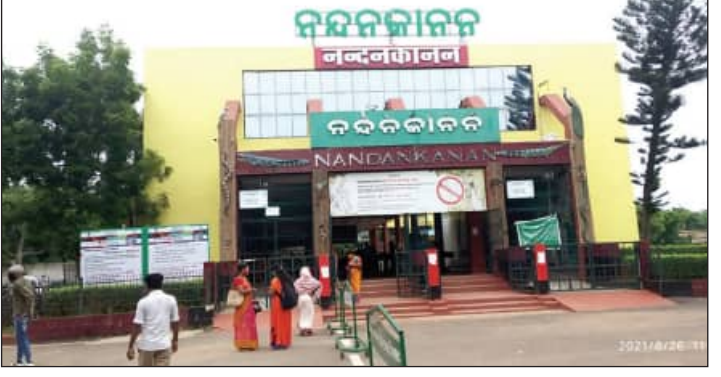
ଅଦଳବଦଳ ପ୍ରକ୍ରିୟା ଏହି ଆଧାରରେ ରାଷ୍ଟ୍ରୀୟ ଜାବଜନ୍ମ ପ୍ରଦାନ କରିଛନ୍ତି। ଏହି ପରିପ୍ରେକ୍ଷାରେ ଭଗବାନ ବିଦ୍ୟା ବାୟୋଲୋଜିକାଲ ପାର୍କ୍ ମଙ୍ଗଳବାର ଭୋରକୁ ନନ୍ଦନକାନନ ୮

ଓ ନନ୍ଦନକାନନର ଚିଡ଼ିଆଖାନା ମଧ୍ୟରେ ଜାବଜନ୍ମ ଅଦଳବଦଳ ହେବାକୁ ଯାଇଛି। ଏଥିପାଇଁ କେନ୍ଦ୍ରୀୟ ଚିଡ଼ିଆଖାନା କର୍ତ୍ତୃପକ୍ଷ ମଧ୍ୟ ଜଣିଆ ଟିମ୍ ରାଷ୍ଟ୍ର ଅଭିମୁଖେ ବାହାରିଛନ୍ତି।