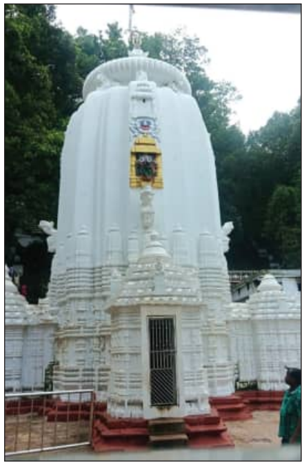
ହଜାର ଭକ୍ତ ରାଜ୍ୟର କୋଣାର୍କସହର ଆସି ଭୋଗ ନପାଇ ନିରାଶରେ ପେଟିଯାଇଛନ୍ତି। ପ୍ରଭୁଙ୍କ ତିନି ଧୂପ ଏବଂ ୪

କେଳାନାଳ/ଗୈରିଆ, ୯।୭(ସମିପ): ରାଜ୍ୟର ପ୍ରମୁଖ ଶୈବପାଠ କର୍ମିକାସର ପ୍ରଭୁ ଶ୍ରୀଶ୍ରୀଚନ୍ଦ୍ରଶେଖର କିନ୍ତୁ ୨ ଦିନ ଧରି ଭୋକ ଉପବାସରେ ରହିଛନ୍ତି। ନୀତିକାନ୍ତି ଠିକ୍ରେ ହେବା ତ ଦୂରର କଥା, ରୋଷଘରେ ତାଲା ଝୁଲିବାର ଦୃଶ୍ୟ ଉକ୍ତମହଲରେ ଦୈନାନ୍ତ୍ୟ ଖେଳାଇ ଦେଇଛି।