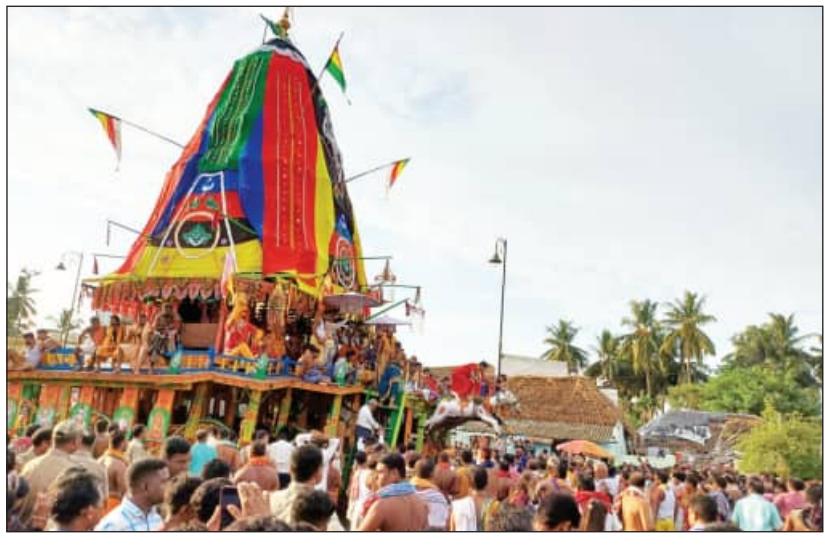
ପାର୍ଶ୍ୱକୁ ମାଡ଼ି ଯାଇଥିଲା। ଏହାପରେ ସୂର୍ଯ୍ୟାସ୍ତ ହୋଇଯାଇଥିଲା। ଫଳରେ ଚନ୍ଦନ ପୋଖରୀ ଯେ ତୃତୀୟ ଦିନରେ ଅପରାହ୍ଣ ୨ଟାରେ ରଥ ଗଡ଼ିବା ଆରମ୍ଭ ହୋଇଥିଲା। ହେଲେ ରଥ ମାତ୍ର ୧୦୦ରୁ ୧୫୦ ମିଟର ଗଡ଼ିବା ପରେ ରଥ ପୁନର୍ବାର ବାମ

ମାଉସା ମା'ଙ୍କ ମନ୍ଦିର ହେଉଛି ଏକ କିଲୋ ମିଟର। ରଥ ଯଦି ତିନି ଦିନରେ ମାତ୍ର ୩୫୦ ମିଟର ଗଡ଼ିଛି, ତେବେ ଏକ କିଲୋ ମିଟର ଗଡ଼ିବା ପାଇଁ କେତେ ଦିନ ଲାଗିବ ବୋଲି ସ୍ଥାନୀୟ ଲୋକେ ପ୍ରଶ୍ନ କରିଛନ୍ତି।