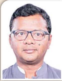
ଯୋଡ଼ାକୁ ଦୁହେଁ ଘୋଡ଼ା ସରି