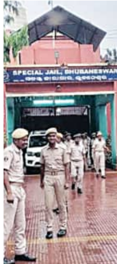
ପ୍ରସ୍ତୁତି: ତ୍ରିନାଥ ମହାନ୍ତି

କେହି ଜନ୍ମରୁ ଅପରାଧୀ ହୋଇ ନ ଥାନ୍ତି । ଅଧିକାଂଶ କ୍ଷେତ୍ରରେ ପାରିପାଶ୍ଵିକ ପରିସ୍ଥିତି ମଣିଷକୁ ଅପରାଧୀ ସଜେଇ ଦିଏ । ଏହିକ୍ରମରେ କାରାଗାର ବ୍ୟବସ୍ଥା ଆରମ୍ଭ ହେବା ଦିନରୁ ଜେଲ କାରଦଳକୁ ଏକ ଦଣ୍ଡ ଭାବେ ବିବେଚନା କରାଯାଉଛି । ଫଳରେ ଜେଲରେ ରହୁଥିବା ଅନ୍ତେବାସୀ ଅଧିକର ଅଧିକ ଉନ୍ନତ ହୋଇଉଠେ ଏବଂ ବାହାରିବା ପରେ ରୋଜଗାରର କୌଶସି ପାଇଁ ନ ପାଇଁ ପୁରୁଣା ଅପାମାଜିକ କାର୍ଯ୍ୟକୁ ଆପଣାଇଥାନ୍ତି । ଏପରିସ୍ଥଳେ ଜେଲ ଅନ୍ତେବାସୀଙ୍କୁ ନିୟୁକ୍ତି ଓ ଅର୍ଥ ରୋଜଗାର ଦିଗରେ ସ୍ଵାବଲମ୍ବୀ କରିବା ପାଇଁ ରାଜ୍ୟ ସରକାରଙ୍କ ପକ୍ଷରୁ '୫-ଟି' ଉପକ୍ରମରେ ବିଭିନ୍ନ ସଂସ୍କାରମୂଳକ ପଦକ୍ଷେପମାନେ ଗ୍ରହଣ କରାଯାଇଛି । ଯାହାଦ୍ଵାରା ଜଣେ କ'ଣ ଜେଲରୁ ଯେଉଁ ଆତ୍ମନିର୍ଭରଶୀଳ ହେବା ସହ ସମାଜରେ ଅନ୍ୟମାନଙ୍କ ପାଇଁ ଆଦର୍ଶ ମଧ୍ୟ ପାଲଟିଯାଉଛି । ଏ ସମ୍ପର୍କରେ ସ୍ଵତନ୍ତ୍ର ଉପସ୍ଥାପନା ।