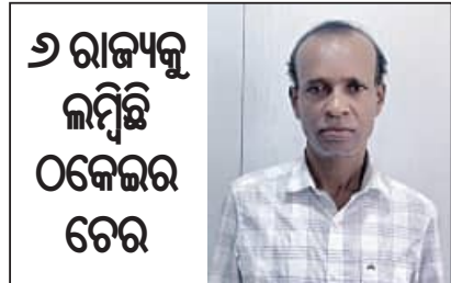
୬ ରାଜ୍ୟକୁ ଲୁଟିଛି ୦କେଇର ଚେର

■ ଭୁବନେଶ୍ୱର, ୮୬ (ସମିସ): ରାତାରାତି ଟଙ୍କା ଦୁଇଗୁଣା କରିଦେବାର ସ୍ୱପ୍ନ ଦେଖାଇ ୧୨୩ କୋଟି ଟଙ୍କା ୦କେଇଥିବା ହରିତ କୃଷିନିଧି ସଂସ୍ଥାର ନିର୍ଦ୍ଦେଶକଙ୍କୁ ଗିରଫ କରିଛି ଇଡିଏଟିଏ । ଅଭିଯୁକ୍ତଙ୍କ ଘରରେ, ପଶ୍ଚିମବଙ୍ଗ ପଣ୍ଡିମ ବେଦିନୀପୁରର ଦୁଷ୍ଟାର ଭଣ୍ଡୋ । ଗତ ୫ ତାରିଖରେ ତାଙ୍କୁ ଅଭିଯୁକ୍ତ କୋର୍ଟରେ ହାଜର କରାଯିବା ପରେ ଗ୍ରାମିନିଜିଂ ରିମାଣ୍ଡରେ ଭୁବନେଶ୍ୱର ଅଣ୍ଡାଯାଇଛି । ଅଭିଯୋଗ ଅନୁସାରେ, କମ୍ ଦିନରେ ଅଧିକ ସୁଧର ଲୋଭ ଦେଖାଇ ଦୁଷ୍ଟାର ନିଜ କମ୍ପାନି ହରିତ କୃଷିନିଧି ଏବଂ ଗ୍ରାମସଭାଜନ ଟ୍ରିମ୍ ମଲଟି ଟ୍ରେଡିଂରେ ଟଙ୍କା ଲଗାଇବାକୁ ଲୋକଙ୍କୁ ପ୍ରବର୍ତ୍ତାଇଥିଲା । ଏପରିକି ଏକେଡ଼ମାନଙ୍କୁ କରିଆରେ ଗ୍ରାହକ ମଧ୍ୟ ଯୋଗାଡ଼ କରିଥିଲା । ଏଥିପାଇଁ ସେ ଏକେଡ଼ଙ୍କୁ ଅଧିକ