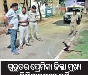
ଗୁରୁତର ପ୍ରେମିକା କିଲ୍ଲା ମୁଖ୍ୟ ଚିକିତ୍ସାଳୟରେ ଭର୍ତ୍ତି ଗଞ୍ଜାମରୁ ଆସି ଦେବଗଡ଼ରେ ପ୍ରେମିକାର ଆତ୍ମହତ୍ୟା

■ ଦେବଗଡ଼, ୮୬ (ସମିସ): ଶନିବାର ଦେବଗଡ଼ ସହରରେ ଏକ ଅଭାବନୀୟ ଘଟଣା ଘଟିଛି । ଜଣେ ଯୁବକ ଛୁରିରେ ତା' ପ୍ରେମିକାର ଗଳା କାଟିବା ପରେ ନିଜ ଗଳା କାଟି ଜୀବନ ହାରିଛି । ମୃତ ଯୁବକଙ୍କ ଘରରେ, ଗଞ୍ଜାମ ଜିଲ୍ଲାର ଅଞ୍ଚଳର ସାମାଜିକ ସାହାଯ୍ୟ । କିଲ୍ଲା ମୁଖ୍ୟ ଚିକିତ୍ସାଳୟ ଶ୍ରୀବାଗାରେ ସାମାଜିକ ମୃତଦେହ ସଂରକ୍ଷିତ ରଖାଯାଇଛି । ପୁଲିସ୍ ତାଙ୍କ ପରିବାରଲୋକଙ୍କୁ ଖବର ଦେଇଛି । ଆସନ୍ତାକାଲି ସେମାନେ ପହଞ୍ଚିବା ପରେ ଶବ ବ୍ୟବଚ୍ଛେଦ ହେବ ବୋଲି ଜଣାଯାଇଛି । ଅପରପକ୍ଷେ, ଗୁରୁତର ପ୍ରେମିକାକୁ କିଲ୍ଲା ମୁଖ୍ୟ ଚିକିତ୍ସାଳୟରେ