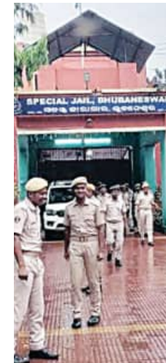
ପ୍ରସ୍ତୁତି: ତ୍ରିନାଥ ମହାନ୍ତି

କେହି ଜନ୍ମରୁ ଅପରାଧୀ ହୋଇ ନ ଥାନ୍ତି । ଅଧିକାଂଶ କ୍ଷେତ୍ରରେ ପାରିପାଶ୍ଵିକ ପରିସ୍ଥିତି ମଣିଷକୁ ଅପରାଧୀ ସଜେଇ ଦିଏ । ଏହିକ୍ରମରେ କାରାଗାର ବ୍ୟବସ୍ଥା ଆରମ୍ଭ ହେବା ଦିନରୁ ଜେଲ୍ ଜୀବନକୁ ଏକ ଦଣ୍ଡ ଭାବେ ବିବେଚନା କରାଯାଉଛି । ଫଳରେ ଜେଲ୍ରେ ରହୁଥିବା ଅନ୍ତେବାସୀ ଅଧିକର ଅଧିକ ଉନ୍ନତ ହୋଇଉଠେ ଏବଂ ବାହାରିବା ପରେ ରୋଜଗାରର କୌଶଳି ପାଇଁ ନ ପାଇଁ ପୁରୁଣା ଆବାସିକ କାର୍ଯ୍ୟକୁ ଆପଣାଇଥାନ୍ତି । ଏପରିସ୍ଥଳେ ଜେଲ୍ ଅନ୍ତେବାସୀଙ୍କୁ ନିୟୁକ୍ତି ଓ ଅର୍ଥ ରୋଜଗାର ଦିଗରେ ସ୍ଵାବଲମ୍ବୀ କରିବା ପାଇଁ ରାଜ୍ୟ ସରକାରଙ୍କ ପକ୍ଷରୁ '୫-ଟି' ଉପକ୍ରମରେ ବିଭିନ୍ନ ସଂସ୍କାରମୂଳକ ପଦକ୍ଷେପମାନେ ଗ୍ରହଣ କରାଯାଇଛି । ଯାହାଦ୍ଵାରା ଜଣେ କ'ଣ ଜେଲ୍ରେ ଯେଉଁ ଆତ୍ମନିର୍ଭରଶୀଳ ହେବା ସହ ସମାଜରେ ଅନ୍ୟମାନଙ୍କ ପାଇଁ ଆଦର୍ଶ ମଧ୍ୟ ପାଲଟିଯାଉଛି । ଏ ସମ୍ପର୍କରେ ସ୍ଵତନ୍ତ୍ର ଉପସ୍ଥାପନା ।