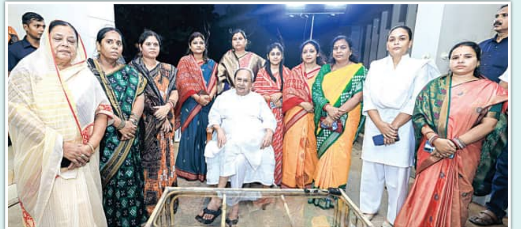
ଗୁରୁବାର ନବୀନ ନିବାସରେ ବିଜେଡି ସଭାପତି ନବୀନ ପଟ୍ଟନାୟକଙ୍କୁ ଭେଟୁଛନ୍ତି ଦଳର ନେତୃବୃନ୍ଦ ଓ ଶୁଭେଚ୍ଛୁ