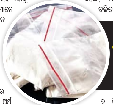
ରାଜଧାନୀ, ବାଲେଶ୍ୱରରୁ ମିଳିଛି ଏକ ତୃତୀୟାଂଶ ଧଳାଜହର

ଭୁବନେଶ୍ୱର, ୨।୬ (ସମିପ) ବୋକାନରେ ମଦ ବିକ୍ରି ହେବା ପରି ବ୍ରାଉନସୁଗର କାରବାର ଚାଲୁଛି । ମଦଠାରୁ ଏବେ ବ୍ରାଉନସୁଗର ଅଧିକ ଜବତ ହେଉଛି । ନିଶା ସେବନକାରୀ ପ୍ରଥମେ ବ୍ରାଉନସୁଗର ସେବନ କରିବା ସହ ଏହାକୁ ବିକ୍ରି କରୁଛନ୍ତି । ତେବେ ଛାତ୍ରମାନେ ମାଗଣାରେ ବ୍ରାଉନସୁଗର ସେବନ ପରେ ସେ ଏହାକୁ ଅଭ୍ୟାସରେ ପରିଣତ ହେଉଛି । ପ୍ରତିଦିନ ସେ ନିଶା ମାପିଆକୁ ବ୍ରାଉନସୁଗର ଖାଇବାକୁ ମାପିଆଏ । କିନ୍ତୁ ପରିବାର ଲୋକେ ଯେତିକି ଅର୍ଥ ପାଠିକି, ସେତିକିରେ ଚଳିବା କାଠିକର ପାଠ ହୋଇପଡ଼ିଥାଏ । ସେଥିରୁ ଅର୍ଥ ନେଇ ବ୍ରାଉନସୁଗର ସେବନ କରିବା ସମ୍ଭବ ନୁହେଁ । ତେଣୁ ଛାତ୍ରମାନେ ବ୍ରାଉନସୁଗର ଖାଇବା ପାଇଁ ନିଶା ମାପିଆ ଶରଣ ପଶିବା ପରେ ନିଶା ମାପିଆ ଏହି ଛାତ୍ରମାନଙ୍କ ଦ୍ୱାରା ବ୍ରାଉନସୁଗର ସହଜରେ ବ୍ୟବସାୟ କରି ବ୍ୟବସାୟରେ ସାମ୍ରାଜ୍ୟ ବଢ଼ାଇ ଚାଲିଛନ୍ତି । ୨୦୧୮ ପରଠୁ ରାଜ୍ୟ ସମେତ ରାଜଧାନୀରେ