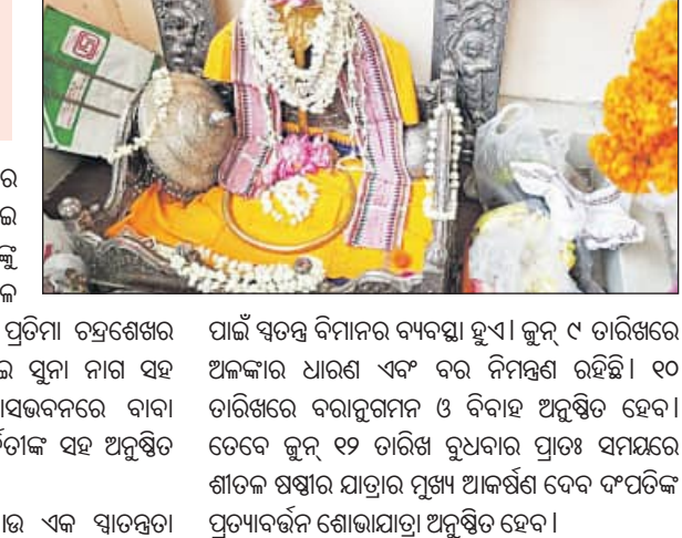
ପାଇଁ ସ୍ୱତନ୍ତ୍ର ବିମାନର ବ୍ୟବସ୍ଥା ହୁଏ। କୁନ୍ ୯ ତାରିଖରେ ଅଳଙ୍କାର ଧାରଣ ଏବଂ ବର ନିମନ୍ତଣ ରହିଛି। ୧୦ ତାରିଖରେ ବରାହମାନ ଓ ବିବାହ ଅନୁଷ୍ଠିତ ହେବ। ତେବେ କୁନ୍ ୧୨ ତାରିଖ ରୁଧିବାର ପ୍ରାତଃ ସମୟରେ ଶତକ ଷଷ୍ଠୀର ଯାତ୍ରାର ମୁଖ୍ୟ ଆକର୍ଷଣ ଦେବ ଦମ୍ପତିଙ୍କ ପ୍ରତ୍ୟାବର୍ତ୍ତନ ଶୋଭାଯାତ୍ରା ଅନୁଷ୍ଠିତ ହେବ।

ପ୍ରତିମା। କେଉଁ ରକାଭାଙ୍ଗୁଡ଼ା ଅମଳରୁ ଏହି ପରମ୍ପରା ଚାଲି ଆସୁଛି। ତେବେ ଶାତଳକ୍ଷ୍ମୀ ଯାତ୍ରା ପାଇଁ ଶୁକ୍ରବାର ଲିଲ୍ଲା କୋଷାଗାରରୁ ବାହାରିବେ ୧୦୮ ଭରି ସୁନା ନାଗ। ସୁନା ନାଗର ସୁନା ପୁରୁଟ, ମାଳି ଆଦି ଅଳଙ୍କାର ସହ ରୁପା ବିମାନ ମଧ୍ୟ ବାହାର କରାଯିବ। ଦିନ ୯ଟାରେ ସୁନା ନାଗ ପ୍ରତିମା ଲିଲ୍ଲା ଗ୍ରେଜେରିରୁ ବାହାର କରିବା ପାଇଁ ଉପଜିଲ୍ଲାପାଳ ତଥା ଦେବୋତ୍ତର କାର୍ଯ୍ୟ ନିର୍ବାହୀ ଅଧିକାରୀ ଲିଲ୍ଲା କୋଷାଗାର ଅଧିକାରୀଙ୍କୁ ଚିଠି କରିଛନ୍ତି। ସୁନା ନାଗ ସହ ସୁନା ପୁରୁଟ, ସୁନା ଚେନ, ନଅ ଗୁଡ଼ି ସୁନା କର୍ଣ୍ଣ ମାଳ, ସୁଇଚି ରୂପା ଛତ୍ର (ବଡ଼ ଓ