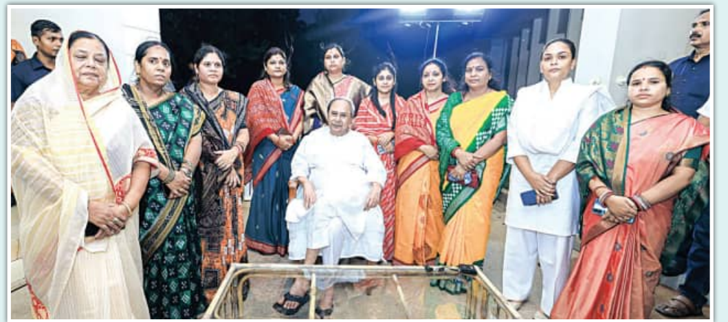
ଗୁରୁବାର ନବୀନ ନିବାସରେ ବିଜେଡି ସଭାପତି ନବୀନ ପଟ୍ଟନାୟକଙ୍କୁ ଭେଟୁଛନ୍ତି ଦଳର ନେତୃବୃନ୍ଦ ଓ ଶୁଭେଚ୍ଛୁ