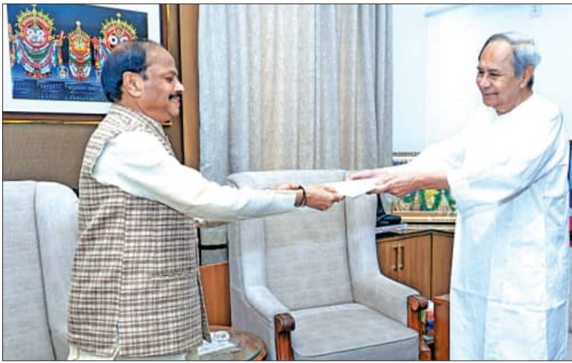
ରାଜ୍ୟବାସୀଙ୍କ କଲ୍ୟାଣ ପାଇଁ କାମ କରି ଚାଲିଥିବି ୨୪ବର୍ଷ ଧରି ନିରନ୍ତର ସେବାର ସୁଯୋଗ ଲାଭି କୃତଜ୍ଞତା

■ ଭୁବନେଶ୍ୱର, ୫.୬ (ସମିପ): ମୁଖ୍ୟମନ୍ତ୍ରୀ ପଦରୁ ଇସ୍ତଫା ଦେଇଛନ୍ତି ବିଜେଡି ସଭାପତି ନବୀନ ପଟ୍ଟନାୟକ। ବିଧାନସଭା ନିର୍ବାଚନରେ ବିଜେଡି ଫଣ୍ଡା ଗରିଷ୍ଠତା ହରାଇବା ପରେ ସେ ରୁଧିରୀ ସକାଳେ ରାଜ୍ୟପାଳ ରଘୁବର ଦାସଙ୍କୁ ଭେଟି ନିଜର ଇସ୍ତଫା ପତ୍ର ପ୍ରଦାନ କରିଛନ୍ତି।