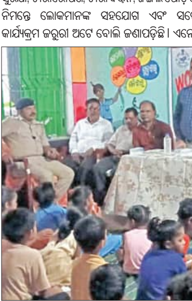
ଅପରାହ୍ନରେ ଖଣ୍ଡପଡ଼ା ବନଖଣ୍ଡ କାର୍ଯ୍ୟାଳୟ ପକ୍ଷରୁ ଏନଏସି ଆଧୀନ ଚାନ୍ଦିନୀ ଅନୁଷ୍ଠାନ ପ୍ରାଥମିକ ବିଦ୍ୟାଳୟ ପରିସରରେ ବିଶ୍ୱ ପରିବେଶ ଦିବସ ପାଳନ କରାଯିବା ସହ ଚାରାଗୋପଣ

ଖଣ୍ଡପଡ଼ା: ସମଗ୍ର ବିଶ୍ୱରେ ଜୁନ ୫ ତାରିଖକୁ ବିଶ୍ୱ ପରିବେଶ ଦିବସ ରୂପେ ପାଳନ କରାଯାଉଛି। ଏହା ପ୍ରତ୍ୟେକକ ଗୁରୁତ୍ୱପୂର୍ଣ୍ଣ ଦିନ। ମନୁଷ୍ୟ ସୂକ୍ଷ୍ମ ଭାବେ ବଞ୍ଚି ରହିବା ପାଇଁ ଏକ ଉତ୍ତମ ପରିବେଶ ଆବଶ୍ୟକ। ବର୍ତ୍ତମାନ ଆମର ଏ ସୁନ୍ଦର ପରିବେଶ ଦୃଷ୍ଟିତ ହେବାରେ ଲାଗିଛି। ବିଲୁପ୍ତ ପ୍ରାଣି ଗଛଲତାରେ ସୁରକ୍ଷା, ବନ୍ୟ ପଶୁପକ୍ଷୀଙ୍କର ଶାନ୍ତ ଉପଯୋଗୀ ଗଛଲତା