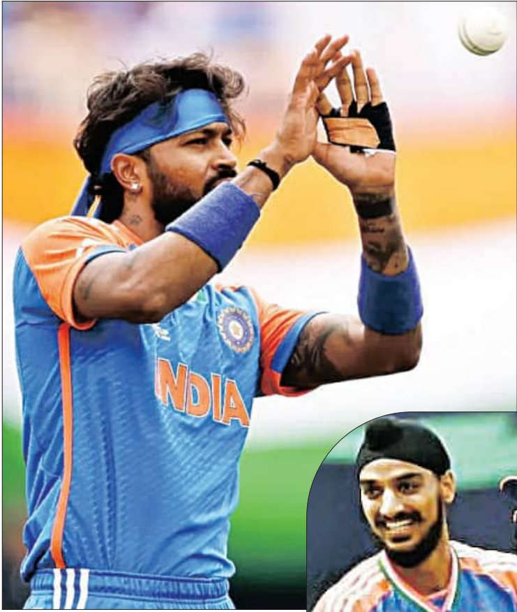
ହାତୀ, ୫୩୬ (ଏକେନ୍ଦ୍ରି):

ଆନ୍ତର୍ଜାତୀୟ ଟି-୨୦ ବିଶ୍ୱକପ୍ ଅଭିଯାନ ଆରମ୍ଭ କରିଛି। ସ୍ଥାନୀୟ ନାସାଲ କାଉଣ୍ଟି ଅନ୍ତର୍ଗତ କ୍ରିକେଟ୍ ଷ୍ଟାଡ଼ିୟମର ଡ୍ରାଉ ଇନ୍ ପିଚ୍ରେ ବୃଥାପାତ ଭାରତ ଓ ଆନ୍ତର୍ଜାତୀୟ ମଧ୍ୟରେ ଏହି ମ୍ୟାଚ୍ଟି ଖେଳାଯାଇଥିଲା। ଏଥିରେ ଭାରତୀୟ ପାଞ୍ଚ ବୋଲରମାନେ ୮୮ ଟି ଓଭର ନେବା ପାଇଁ ପ୍ରଥମେ ବ୍ୟାଟ୍ କରି କରି ଆନ୍ତର୍ଜାତୀୟ ୧୬ ଓଭରରେ