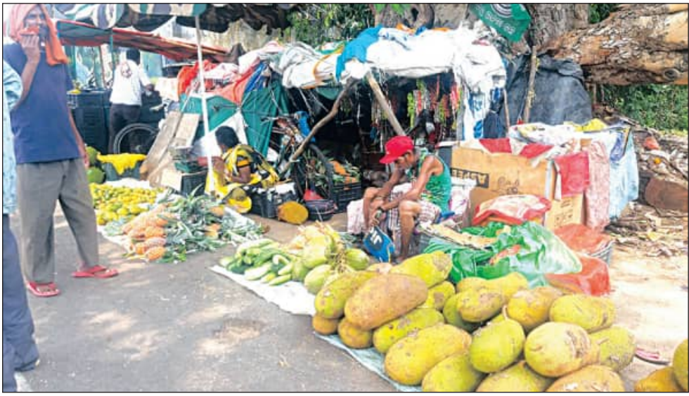
ଋଷିନଗରରେ ସାବିତ୍ରୀ ବ୍ରତ ପାଇଁ ଫଳ ବଜାରରେ ପଣସ ପସରା