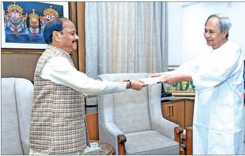
ରାଜ୍ୟବାସୀଙ୍କ କଲ୍ୟାଣ ପାଇଁ କାମ କରି ଚାଲିଥିବା ୨୪ବର୍ଷ ଧରି ନିରନ୍ତର ସେବାର ସୁଯୋଗ ଲାଭି କୃତଜ୍ଞତା

■ ଭୁବନେଶ୍ୱର, ୫।୬ (ସମିପ): ମୁଖ୍ୟମନ୍ତ୍ରୀ ପଦରୁ ଇସ୍ତଫା ଦେଇଛନ୍ତି ବିଜେଡି ସଭାପତି ନବୀନ ପଟ୍ଟନାୟକ। ବିଧାନସଭା ନିର୍ବାଚନରେ ବିଜେଡି ଫଣ୍ଡା ଗରିଷ୍ଠତା ହରାଇବା ପରେ ସେ ରୂପବାର ସକାଳେ ରାଜ୍ୟପାଳ ରଘୁବର ଦାସଙ୍କୁ ଭେଟି ନିଜର ଇସ୍ତଫା ପତ୍ର ପ୍ରଦାନ କରିଛନ୍ତି।