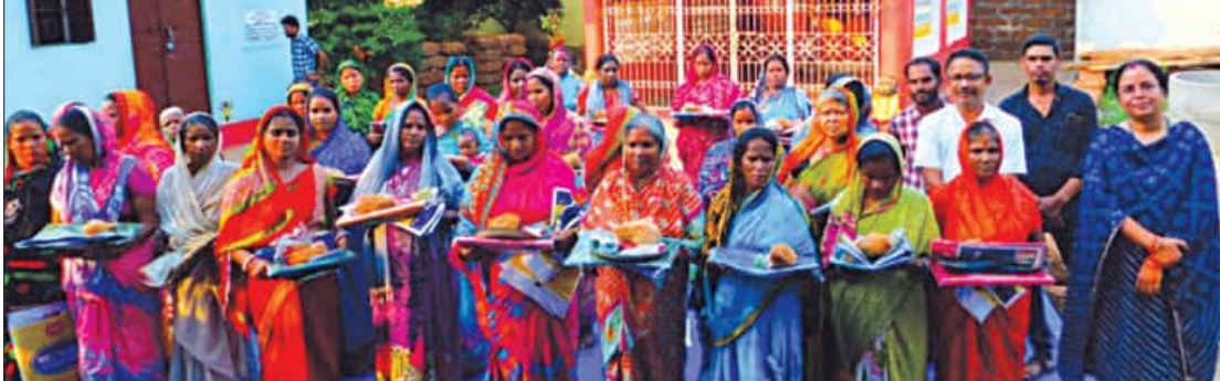
ଯାଁଙ୍କ ସ୍ଥିତ ଲେପର୍ସ କଲୋନୀରେ ୪୦ ଭଉଣୀଙ୍କୁ ଶାଢ଼ି, ଶଙ୍ଖା, ସିନ୍ଦୂର, ଅଳିତା, ବୃତ୍ତ, ନଡ଼ିଆ, ବିଭିନ୍ନ ଫଳ ଇତ୍ୟାଦି ସାବିତ୍ରୀ ସଜ ଦେଇଛନ୍ତି ରାଜଧାନୀର ଜଣେ ମହିଳା