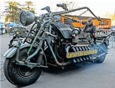
ହୋଇଥିବା ଅଧିକାଂଶ ଜିନିଷ ସୈନିକଙ୍କ ପାଇଁ ଉଦ୍ଦିଷ୍ଟ ଜିନିଷଗୁଡ଼ିକରୁ ନିର୍ମାଣ କରାଯାଇଥିଲା। ତେବେ ଏହି ବାଇକ୍‌ର ଇଞ୍ଜିନ୍ ଏତେ ଜୋରରେ ଶବ୍ଦ କରିଥାଏ ଯେ, ଏହା ଅନେକ ଦୂର ପର୍ଯ୍ୟନ୍ତ ଶୁଣାଯାଏ। ୨୦୦୭ରେ ଏହା ବିଶ୍ୱର ସବୁଠୁ ଭାରୀ ବାଇକ୍ ଭାବେ ଗିନିଜ୍ ବିଶ୍ୱ ରେକର୍ଡରେ ସ୍ଥାନ ପାଇଥିଲା।

ସ୍ୱପ୍ନପୂର୍ଣ୍ଣ ଶ୍ରେଣୀରେ ରହିଥିବା ସାଇକଲ୍ ବାଇକ୍ ଓ ବୁଲେଟ୍ ଚଳାଇବାକୁ ସମର୍ଥନ ଦେଇଥିଲା। କର୍ମୀମାନେ କିଛିଦିନ ହାତରେ ବାଇକ୍ ମୋଟର ସାଇକଲ୍ ଶୋ ରୁମ୍ ରହିଛି। ଏହି ଶୋରୁମ୍‌ର ମାଲିକ ଚିଲେ ଏବଂ ଓଲପ୍ରେଡ୍ ନିବେଳ ନାମକ ହୁଇ ଥିଲା। ୨୦୦୩ରେ ସେମାନେ ଇଟା ଓ ପୁରୁଣା ଜିନିଷରୁ ମୋଟର ସାଇକଲ୍ ତିଆରି କରିବା ନିଷ୍ପତ୍ତି ନେଲେ। ଏହି ସମୟରେ ସେମାନଙ୍କୁ ସୋଲିଏଟ୍ ଟି-୫୫ ଟ୍ୟାଙ୍କର ଏକ ଇଞ୍ଜିନ୍ ମିଳି ଯାଇଥିଲା। ସେମାନେ ତାକୁ ଘରକୁ ନେଇ ଆସିଥିଲେ। ଏହାପରେ ସେମାନେ ଏଥିରେ ବାଇକ୍ ତିଆରି କରିବାକୁ ଭାବିଲେ। ଲଗାତାର ୨୦୮ ଦିନ ଅତ୍ୟାଧିକ ପରିଶ୍ରମ କରି ସେମାନେ ବିଶ୍ୱର ସବୁଠୁ ଭାରୀ ବାଇକ୍ ତିଆରି କରିଥିଲେ। ଏଥିରେ ୩୮ ହଜାର ସିସିର ଟି-୫୫ ଇଞ୍ଜିନ୍ ଲାଗିଥିଲା। ଏହି ବାଇକ୍‌ର ଓଜନ ୪.୬ ଟନ୍ ଥିଲା। ତେବେ ଏହି ବାଇକ୍‌ରେ ବ୍ୟବହୃତ ହୋଇଥିବା ଅଧିକାଂଶ ଜିନିଷ ସୈନିକଙ୍କ ପାଇଁ ଉଦ୍ଦିଷ୍ଟ ଜିନିଷଗୁଡ଼ିକରୁ ନିର୍ମାଣ କରାଯାଇଥିଲା। ତେବେ ଏହି ବାଇକ୍‌ର ଇଞ୍ଜିନ୍ ଏତେ ଜୋରରେ ଶବ୍ଦ କରିଥାଏ ଯେ, ଏହା ଅନେକ ଦୂର ପର୍ଯ୍ୟନ୍ତ ଶୁଣାଯାଏ। ୨୦୦୭ରେ ଏହା ବିଶ୍ୱର ସବୁଠୁ ଭାରୀ ବାଇକ୍ ଭାବେ ଗିନିଜ୍ ବିଶ୍ୱ ରେକର୍ଡରେ ସ୍ଥାନ ପାଇଥିଲା।