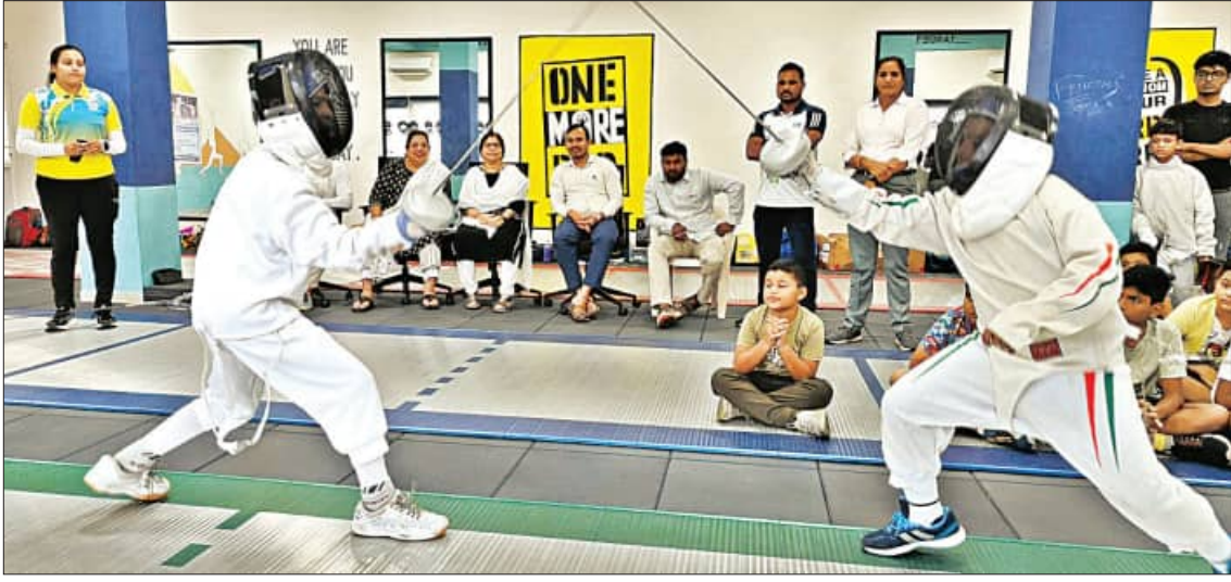
ଭୁବନେଶ୍ୱର କଳିଙ୍ଗ ଷ୍ଟାଡ଼ିୟମରେ ଅନୁଷ୍ଠିତ ଅଧିକାଳନା ଶିବିରରେ ଭାଗନେଇଥିବା ଦୁଇ ପ୍ରତିଯୋଗୀ କଳାକୌଶଳ ପ୍ରଦର୍ଶନ କରୁଛନ୍ତି।