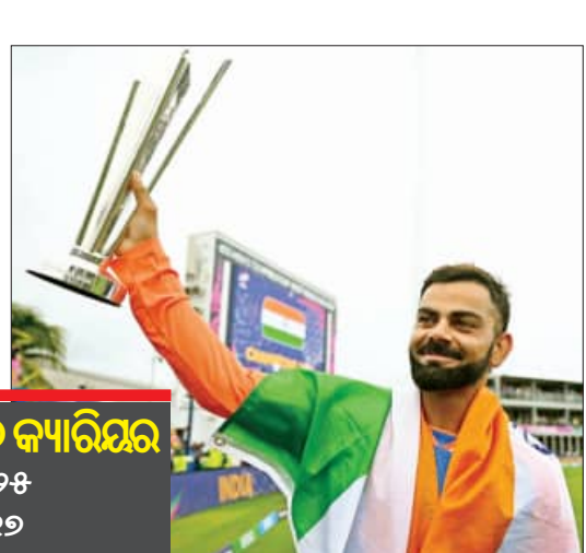
ଟି-୨୦ କ୍ୟାରିୟର ମ୍ୟାଚ୍: ୧୨୫ ପାଲି: ୧୧୭ ରନ୍: ୪,୮୮୮ ଆଉଟ୍‌ରେକ୍: ୪୮.୬୯ ସର୍ବାଧିକ ସ୍କୋର: ୧୨୨ ଶତକ: ୧ ଅର୍ଦ୍ଧଶତକ: ୩୮ ଡିକେଟ୍: ୪ କରି ରେକର୍ଡ୍ କରିଛନ୍ତି । ସେ ବିଶ୍ୱକପରେ ସର୍ବାଧିକ ୧୫ଟି ଅର୍ଦ୍ଧଶତକ ମଧ୍ୟ ହାସଲ କରିଛନ୍ତି । ଇଣ୍ଡିଆନ୍ ପ୍ରିମିୟର ଲିଗ୍ (ଆଇପିଏଲ୍) ରେ ଉଭୟ ବ୍ୟାଲେଷ୍ଟର ବେଙ୍ଗାଲୁରୁ ପ୍ରତିନିଧିତ୍ୱ କରିଥିଲେ ମଧ୍ୟ ଟାଇଟଲ ହାସଲ କରି ନପାରି ସେ ବେଶ୍ ସମାଲୋଚିତ ହୋଇଥିଲେ । ଏପରିକି ତାଙ୍କୁ ନେତୃତ୍ୱ ମଧ୍ୟ ଛାଡ଼ିବାକୁ ପଡ଼ିଥିଲା । ତେବେ ବର୍ତ୍ତମାନ ଏ ସବୁ କଥା ଭବିଷ୍ୟତ ହୋଇଛି ।

ବାର୍ଦ୍ଦିତ୍ୟ ୨୯।୬ (ଏକେନ୍ଦ୍ରି): ବ୍ୟାଟି ସ୍କୋରାଳ ସୁପରସ୍ତାର ବିରାଟ କୋହଲିଙ୍କୁ ଆଉ ଅନ୍ତର୍ଜାତୀୟ ଟି-୨୦ ଖେଳିବାର ଦେଖାଯିବ ନାହିଁ । ଐତିହାସିକ ଟି-୨୦ ବିଶ୍ୱକପ ବିଜୟର ମାତ୍ର କେତୋଟି ମୁହୂର୍ତ୍ତ ପରେ ସେ ଟି-୨୦ ଫର୍ମାଟ୍‌ରୁ ଅବସର ଘୋଷଣା କରିଛନ୍ତି । ଅବଶ୍ୟ ପୂର୍ବରୁ ଏହା ତାଙ୍କ କ୍ୟାରିୟରର ଅନ୍ତିମ ଟି-୨୦ ବିଶ୍ୱକପ ବୋଲି ଘୋଷଣା ହୋଇଥିଲା । ବିଶ୍ୱ କ୍ରିକେଟ୍‌ର ଅନ୍ତର୍ଗତ ଶ୍ରେଷ୍ଠ କ୍ରିକେଟ୍ ବିବେଚିତ ହେଉଥିବା କୋହଲି ବିଶ୍ୱକପରେ ପ୍ରଥମ ୭ଟି ମ୍ୟାଚ୍‌ରେ ସାମାଜିକ ଭାବେ ବିପକ୍ତ ହୋଇଥିଲେ । ତେବେ ପାଇନାଲ ମୁକାବିଲାରେ ନିର୍ଣ୍ଣାୟକ ଅର୍ଦ୍ଧଦାମିକା ପାଇ ଖେଳି ଭାରତକୁ ବିପଦ ମୁକ୍ତ କରିଥିଲେ । ପାଇନାଲ ପୂର୍ବରୁ ପ୍ରଥମ ୭ଟି ମାଟିରେ ୩୫ ବର୍ଷୀୟ କୋହଲି ମୋଟ୍ ଉପରେ ୭୫ ରନ କରି ବେଶ୍ ସମାଲୋଚିତ ହୋଇଥିଲେ । ତେବେ ପାଇନାଲ ମ୍ୟାଚ୍‌ରେ ୭୬ ରନ (୫୯ ବଲ୍, ୬ ଟୋକା, ୨ ଛକା)ର ଅର୍ଦ୍ଧଦାମିକା ପାଇ ଖେଳି ସମାଲୋଚକଙ୍କୁ ହୁତ୍ କରିଛନ୍ତି । କୋହଲିଙ୍କୁ ମଧ୍ୟ ପାଇନାଲ ମୁକାବିଲାରେ ଶ୍ରେଷ୍ଠ ଖେଳାଳି ଭାବେ ପୁରସ୍କୃତ କରାଯାଇଥିଲା । ଏବେ ପରବର୍ତ୍ତୀ ପିଞ୍ଜିରୁ ସୁଯୋଗ ଦେବାର ସମସ୍ତ ଉପଯୋଗ ହୋଇଛି ବୋଲି ବିଜୟ ପରେ ସେ କହିଛନ୍ତି । ଏହି ଅବସରରେ ସେ ବେଶ୍ ଭାବପୂର୍ବକ ହୋଇ ପଡ଼ିଥିଲେ ।