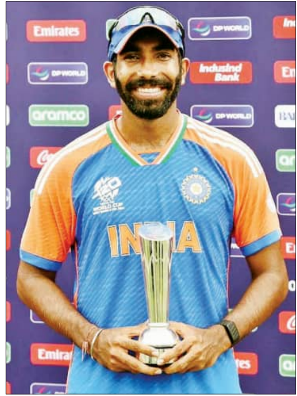
ଯଶପ୍ରୀତ ବୁମରା: ଟି-୨୦ ବିଶ୍ୱକପର ଶ୍ରେଷ୍ଠ ଖେଳାଳି