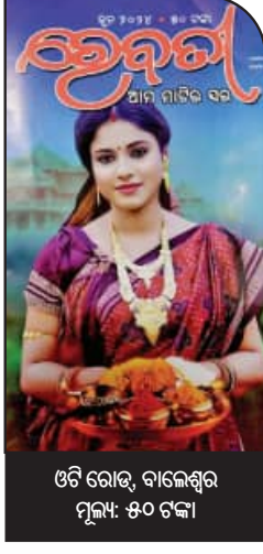
ଓଡ଼ି ରୋଡ଼, ବାଲେଶ୍ଵର ମୂଲ୍ୟ: ୫୦ ଟଙ୍କା