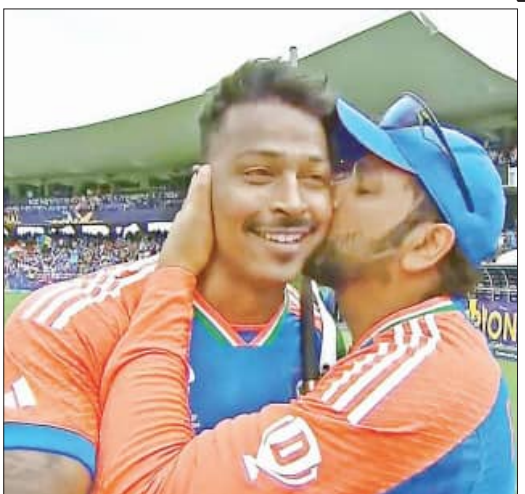
ଖେଳାଳି ବିବେଚିତ ହୋଇ ସେ ମଧ୍ୟ ଖୁସି ହୋଇଥିଲେ । ରୋହିତଙ୍କ ସ୍ଥାନରେ ହାର୍ଦ୍ଦିକ ପାଣ୍ଡ୍ୟାଙ୍କୁ ମୁମ୍ବାଇ ଇଣ୍ଡିଆନ୍‌ର ଅଧିନାୟକ ନିଯୁକ୍ତ ହେବା ପରେ ସମାଲୋଚିତ ହୋଇଥିଲେ । ଏହି ବିଶ୍ୱକପ ସହ ପାଇନାଲରେ ପାଣ୍ଡ୍ୟା ମ୍ୟାଚ୍ ବିଜୟରେ ଗୁରୁତ୍ୱପୂର୍ଣ୍ଣ ଭୂମିକା ଗ୍ରହଣ କରି ପୂର୍ବର ସମସ୍ତ ଟୁର୍ଣ୍ଣାମେଣ୍ଟରୁ ଭେଦରେ ସମର୍ଥ ହୋଇଛନ୍ତି ।

ଫେସ୍‌ଲିଭଲ୍‌ର ବାର୍ଦ୍ଦିତ୍ୟ ଦାପ୍‌ପୁଅ ଅନ୍ତର୍ଗତ ବିକଟାଉରର କେନିସଙ୍ଗଟନ ଓଭାଲରେ ଶନିବାର ଅନୁଷ୍ଠିତ ୨୦୨୪ ଟି-୨୦ ବିଶ୍ୱକପ ପାଇନାଲରେ ଦକ୍ଷିଣ ଆଫ୍ରିକାକୁ ୭ ରନ୍‌ରେ ପରାସ୍ତ କରି ଭାରତ ଚାମ୍ପିୟନ ହୋଇଛି । ଭାରତର ଏହି ଟାଇଟଲ ବିଜୟରେ ସମସ୍ତେ ଖୁସି ହୋଇଛନ୍ତି । ଏହି ବିଶ୍ୱକପର ଆୟୋଜକ, ପ୍ରାୟୋଜକ, ବିଜ୍ଞାପନଦାତା, ବିଧିବିଧାନ ଓ ଆଇସିସିର କର୍ମଚାରୀ, ସମର୍ଥକ, ପ୍ରସ୍ତୁତକ ଓ କ୍ରିକେଟ୍ ଖେଳକୁ ଭଲ ପାଉଥିବା ସମସ୍ତ ବ୍ୟକ୍ତିଗଣଙ୍କୁ ଖୁସି ହୋଇଛନ୍ତି । ଏହା ମଧ୍ୟରେ ଖେଳାଳିଙ୍କ ଖୁସି ସବୁଠାରୁ ଅଧିକ । ଅଧିନାୟକ ରୋହିତ ଶର୍ମାଙ୍କ ନେତୃତ୍ୱରେ ଭାରତ ପ୍ରଥମ ଆଇସିସି ଟ୍ରଫି ବିଜୟ ହୋଇଛି । ଚଳିତ ସିଜନରେ ତାଙ୍କୁ ମୁମ୍ବାଇ ଇଣ୍ଡିଆନ୍‌ର ନେତୃତ୍ୱ ପଦରୁ ହଟାଇବା ପରେ ତାଙ୍କ ନେତୃତ୍ୱରେ ଭାରତ ବିଶ୍ୱଚାମ୍ପିୟନ ହେବା ନିଶ୍ଚିତ ତାଙ୍କ ସମ୍ମାନ ରକ୍ଷା କରିବାରେ ସହାୟକ ହେବ । ସେହିପରି ଆଇସିସିରେ ବିରାଟ ସଫଳତା ପରେ ବିଶ୍ୱକପରେ ଫେଲ୍ ମାରିବା କୋହଲିଙ୍କୁ ଅପେକ୍ଷା କରିଥିଲା । କିନ୍ତୁ ସେ ପାଇନାଲରେ ସର୍ବାଧିକ ୭୬ ରନ୍ କରିବା ଓ ଶ୍ରେଷ୍ଠ ଖେଳାଳି ଭାବେ ବିବେଚିତ ହେବା ତାଙ୍କପ୍ରକାର ଖେଳାଳିଙ୍କ ଲାଗି ବିଶେଷ ଉପହାର । ସେହିପରି ଅନ୍ୟ ଦୁଇ ଖେଳାଳିଙ୍କ ମଧ୍ୟରୁ ଯଶପ୍ରୀତ ବୁମରା ଏହି ଟୁର୍ଣ୍ଣାମେଣ୍ଟ ସାରା ଭଲ ବୋଲି କରିଥିଲେ । ପାଇନାଲରେ ଭାରତକୁ ଜିତାଇବାର ମଧ୍ୟ ତାଙ୍କର ଭୂମିକା ରହିଥିଲା ଓ ଶ୍ରେଷ୍ଠତର ଚଳିତ ବିଶ୍ୱକପର ଶ୍ରେଷ୍ଠ