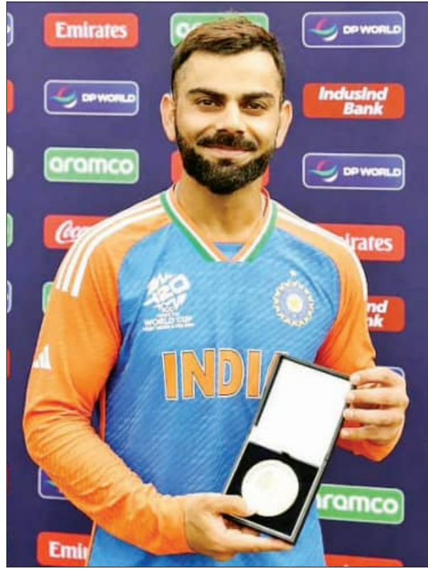
ବିରାଟ କୋହଲି: ପାଇନାଲ ମ୍ୟାଚ୍‌ର ଶ୍ରେଷ୍ଠ ଖେଳାଳି