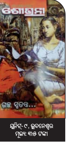
ଧୂନି-୯, ଭୁବନେଶ୍ଵର ମୂଲ୍ୟ: ୩୫ ଟଙ୍କା