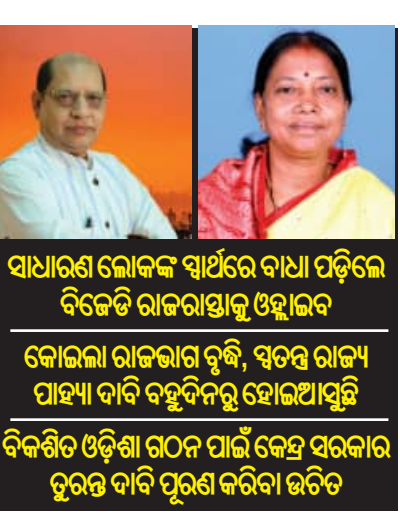
ସାଧାରଣ ଲୋକଙ୍କ ସ୍ୱାର୍ଥରେ ବାଧା ପଡ଼ିଲେ ବିଜେଡି ରାଜଗଞ୍ଜାଳୁ ଓହ୍ଲାଇବ କୋରଲା ରାଜଗଞ୍ଜାଳୁ ବୁଦ୍ଧି, ସ୍ୱତନ୍ତ୍ର ରାଜ୍ୟ ପାହ୍ୟା ଦାବି ବହୁତଦିନକୁ ହୋଇଆସୁଛି ବିକଶିତ ଓଡ଼ିଶା ଗଠନ ପାଇଁ କେନ୍ଦ୍ର ସରକାର ତୁରନ୍ତ ଦାବି ପୂରଣ କରିବା ଉଚିତ