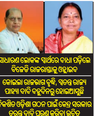
ସାଧାରଣ ଲୋକଙ୍କ ସ୍ୱାର୍ଥରେ ବାଧା ପଡ଼ିଲେ ବିଜେଡି ରାଜଗଞ୍ଜାଳୁ ଓହ୍ଲାଇବ କୋରଲାଇ ରାଜଗଞ୍ଜାଳୁ ବୁଦ୍ଧି, ସ୍ୱତନ୍ତ୍ର ରାଜ୍ୟ ପାହ୍ୟା ଦାବି ବହୁତଦୂର ହୋଇଆସୁଛି ବିକଶିତ ଓଡ଼ିଶା ଗଠନ ପାଇଁ କେନ୍ଦ୍ର ସରକାର ତୁରନ୍ତ ଦାବି ପୂରଣ କରିବା ଉଚିତ