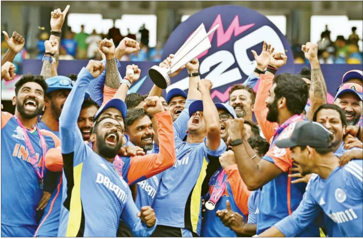
ଦ୍ୱିତୀୟ ଟି-୨୦ ବିଶ୍ୱକପ ଫାଇନାଲ ସହ ଭାରତୀୟ ଦଳର ଖେଳାଳି ଓ ସପୋର୍ଟର