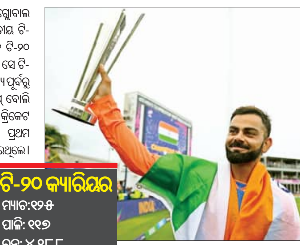
ଟି-୨୦ କ୍ୟାରିୟର ମ୍ୟାଚ୍: ୧୨୫ ପାଳି: ୧୧୬ ରନ୍: ୪,୮୮୮ ଆଉଟ୍: ୪୮.୬୯ ସର୍ବାଧିକ ସ୍କୋର: ୧୨୨ ଶତକ: ୧ ଅର୍ଦ୍ଧଶତକ: ୩୮ ଟ୍ରେକେଟ: ୪

ବାର୍ଦ୍ଦୀତୋଏ ୨୯ ୧୬ (ଏକେନ୍ଦ୍ରି): ବ୍ୟାଟି ରୋବାଲ ସୁପରସ୍ଟାର ବିରାଟ କୋହଲିଙ୍କୁ ଆଉ ଅନ୍ତର୍ଜାତୀୟ ଟି-୨୦ ଖେଳିବାର ଦେଖାଯିବ ନାହିଁ । ଏହିଦିନିକିଆ ଟି-୨୦ ବିଶ୍ୱକପ ବିଜୟର ମାତ୍ର ଦେହାନ୍ତେ ମୁହୂର୍ତ୍ତ ପରେ ସେ ଟି-୨୦ ଫର୍ମାଟରୁ ଅବସର ଘୋଷଣା କରିଛନ୍ତି । ଅବସ୍ୟ ପୂର୍ବରୁ ଏହା ତାଙ୍କ କ୍ୟାରିୟରର ଅନ୍ତିମ ଟି-୨୦ ବିଶ୍ୱକପ ବୋଲି ଜଣାଯାଇଥିଲା । ବିଶ୍ୱ କ୍ରିକେଟର ଅନ୍ତତମ ଶ୍ରେଷ୍ଠ କ୍ରିକେଟ ବିବେଚିତ ହେଉଥିବା କୋହଲି ବିଶ୍ୱକପରେ ପ୍ରଥମ ୭ଟି ମ୍ୟାଚ୍ରେ ସାମାନ୍ୟ ଭାବେ ବିପଲ ହୋଇଥିଲେ । ତେବେ ଫାଇନାଲ ମୁକାବିଲାରେ ନିର୍ଣ୍ଣାୟକ ଅର୍ଦ୍ଧଶତକୀୟ ପାଳି ଖେଳି ଭାରତକୁ ବିପଦ ମୁକ୍ତ କରିଥିଲେ । ଫାଇନାଲ ପୂର୍ବରୁ ପ୍ରଥମ ୭ଟି ମାଟିରେ ୩୫ ବର୍ଷୀୟ କୋହଲି ମୋଟ୍ ଉପରେ ୬୫ ରନ କରି ବେଶ୍ ସମାଲୋଚିତ ହୋଇଥିଲେ । ତେବେ ଫାଇନାଲ ମ୍ୟାଚ୍ରେ ୬୬ ରନ (୫୯ ବଲ, ୬ ଟ୍ରେକେଟ, ୨ ଛକା)ର ଅର୍ଦ୍ଧଶତକୀୟ ପାଳି ଖେଳି ସମାଲୋଚକଙ୍କୁ ହୁସ୍ତ କରିଛନ୍ତି । କୋହଲିଙ୍କୁ ମଧ୍ୟ ଫାଇନାଲ ମୁକାବିଲାର ଶ୍ରେଷ୍ଠ ଖେଳାଳି ଭାବେ ପୁରସ୍କୃତ କରାଯାଇଥିଲା । ଏବେ ପରବର୍ତ୍ତୀ ପିଢ଼ିକୁ ସୁଯୋଗ ଦେବାର ସମସ୍ତ ଉପଯୋଗ ହୋଇଛି ବୋଲି ବିଜୟ ପରେ ସେ କହିଛନ୍ତି । ଏହି ଅବସରରେ ସେ ବେଶ୍ ଭାବପୂର୍ବକ ହୋଇ ପଡ଼ିଥିଲେ ।