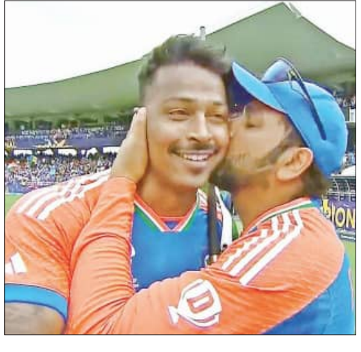
ଖେଳାଳି ବିବେଚିତ ହୋଇ ସେ ମଧ୍ୟ ଖୁସି ହୋଇଥିଲେ । ରୋହିତଙ୍କ ସ୍ଥାନରେ ହାର୍ଦ୍ଦିକ ପାଣ୍ଡ୍ୟାକୁ ମୁମ୍ବାଇ ଇଣ୍ଡିଆନ୍ସର ଅଧିନାୟକ ନିଯୁକ୍ତ ହେବା ପରେ ସମାଲୋଚିତ ହୋଇଥିଲେ । ଏହି ବିଶ୍ୱକପ ସହ ଫାଇନାଲରେ ପାଣ୍ଡ୍ୟା ମ୍ୟାଚ୍ ବିଜୟରେ ଗୁରୁତ୍ୱପୂର୍ଣ୍ଣ ଭୂମିକା ଗ୍ରହଣ କରି ପୂର୍ବର ସମସ୍ତ ଗୁଣଗୁଣକୁ ଭଲ ଭାବରେ ସମର୍ଥ ହୋଇଛନ୍ତି ।

ଝେଙ୍କଣ୍ଡିକର ବାର୍ଦ୍ଦୀତୋଏ ଦାପପୁଅ ଅନ୍ତର୍ଗତ ବିଜୟାଭରନ କେନିସଙ୍ଗଟନ ଓଭାଲରେ ଶନିବାର ଅନୁଷ୍ଠିତ ୨୦୨୪ ଟି-୨୦ ବିଶ୍ୱକପ ଫାଇନାଲରେ ଦକ୍ଷିଣ ଆଫ୍ରିକାକୁ ୬ ରନରେ ପରାସ୍ତ କରି ଭାରତ ଚାମ୍ପିଅନ ହୋଇଛି । ଭାରତର ଏହି ଫାଇନାଲ ବିଜୟରେ ସମସ୍ତେ ଖୁସି ହୋଇଛନ୍ତି । ଏହି ବିଶ୍ୱକପର ଆୟୋଜକ, ପ୍ରାୟୋଜକ, ବିଜ୍ଞାପନଦାତା, ବିଧିବିଧି ଆଇ ଓ ଆଇସିସିର କର୍ମଚାରୀ, ସମର୍ଥକ, ପ୍ରସ୍ତୁତକ ଓ କ୍ରିକେଟ ଖେଳକୁ ଭଲ ପାଉଥିବା ସମସ୍ତ ବ୍ୟକ୍ତିଗଣଙ୍କୁ ଖୁସି ହୋଇଛନ୍ତି । ଏହା ମଧ୍ୟରେ ଖେଳାଳିଙ୍କୁ ଖୁସି ସବୁଠାରୁ ଅଧିକ । ଅଧିନାୟକ ରୋହିତ ଶର୍ମାଙ୍କ ନେତୃତ୍ୱରେ ଭାରତ ପ୍ରଥମ ଆଇସିସି ଟ୍ରଫି ବିଜୟ ହୋଇଛି । ଚଳିତ ବିଜୟରେ ତାଙ୍କୁ ମୁମ୍ବାଇ ଇଣ୍ଡିଆନ୍ସର ନେତୃତ୍ୱ ପଦରୁ ହଟାଇବା ପରେ ତାଙ୍କ ନେତୃତ୍ୱରେ ଭାରତ ବିଶ୍ୱଚାମ୍ପିଅନ ହେବା ନିଶ୍ଚିତ ତାଙ୍କ ସମ୍ମାନ ରକ୍ଷା କରିବାରେ ସହାୟକ ହେବ । ସେହିପରି ଆଇସିସିଲରେ ବିରାଟ ସମକାଳ ପରେ ବିଶ୍ୱକପରେ ଫୋଲ ମାରିବା କୋହଲିଙ୍କୁ ଅପଦସ୍ଥ କରିଥିଲା । କିନ୍ତୁ ସେ ଫାଇନାଲରେ ସର୍ବାଧିକ ୬୬ ରନ୍ କରିବା ଓ ଶ୍ରେଷ୍ଠ ଖେଳାଳି ଭାବେ ବିବେଚିତ ହେବା ତାଙ୍କ ସ୍ତରର ଖେଳାଳିଙ୍କ ଲାଗି ବିଶେଷ ଉପହାର । ସେହିପରି ଅନ୍ୟ ଦୁଇ ଖେଳାଳିଙ୍କ ମଧ୍ୟରୁ ଯଶପ୍ରୀତ ବୁମରା ଏହି ଟ୍ରଫିମେଣ୍ଟ ସାରା ଭଲ ବୋଲି କରିଥିଲେ । ଫାଇନାଲରେ ଭାରତକୁ ଜିତାଇବାର ମଧ୍ୟ ତାଙ୍କର ଭୂମିକା ରହିଥିଲା ଓ ଶ୍ରେଷ୍ଠରେ ଚଳିତ ବିଶ୍ୱକପର ଶ୍ରେଷ୍ଠ