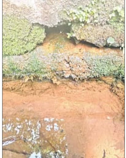
ସମସ୍ତ ଭାଗରେ ଥିବା ଭୋଗମଣ୍ଡପର ଝରଣା ଜଳ ସଂଯୋଗ ହୋଇନାହିଁ। ଝରଣା ଜଳ ସେହି ବାଉଁଶି ପାଳ ଦେଇ ପ୍ରଭୁଙ୍କ ଉପରେ ଅହରଣ ପ୍ରଦାହିତ ହେଉଥାଏ। ତଳିତ ବର୍ଷ ମହାବିଷୁବ ପଣ୍ଡା ସଂକ୍ରାନ୍ତ