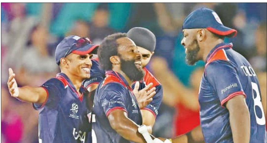
ଡକ୍ଲାର୍ଡ୍, ୨୧ (ଏକଦିନ)

ଟି-୨୦ ବିଶ୍ୱକପର ୯ମ ଏକଦିନ ଆରମ୍ଭ ହୋଇଛି। ଉଦ୍‌ଘାଟନା ମ୍ୟାଚ୍‌ରେ ଆମେରିକା ୧୪ଟି ବଲ୍ ବାକିଆଇ ୬ ଡିକେଟରେ ପଡ଼ୋଶୀ କାନାଡାକୁ ପରାସ୍ତ କରି ବିଜୟ ଅଭିଯାନ ଆରମ୍ଭ କରିଛି। ସ୍ଥାନୀୟ ଗ୍ରାଣ୍ଡ ପ୍ରାଇଭିଏ ଷ୍ଟାଡ଼ିୟମରେ ଅନୁଷ୍ଠିତ ବିଶ୍ୱକପର ଏହି ପ୍ରଥମ ମୁକାବିଲାରେ ଟପ୍ କିଟ୍ ମୋନାକ୍ ପକେଟ୍‌କ ନେତୃତ୍ୱାଧୀନ ଆମେରିକା ପିକ୍ଟ୍ କରିବାକୁ ନିଷ୍ପତ୍ତି ନେଇଥିଲା। ପ୍ରଥମେ ବ୍ୟାଟି କରି କାନାଡା ନିର୍ଦ୍ଧାରିତ ୨୦ ଓଭରରେ ୫ ଡିକେଟ ହରାଇ ୧୯୪ ରନ ସଂଗ୍ରହ କରିଥିଲା। କବାବରେ ଆମେରିକା ୧୬ ୪ ଓଭରରେ ୩ ଡିକେଟ ହରାଇ ୧୯୭ ରନକରି ବିଜୟ ହୋଇଥିଲା। ମାତ୍ର ୪୦ ବଲର ସମ୍ମୁଖୀନ ହୋଇ ୪ ଟୋକା ଓ ୧୦ ଛକା