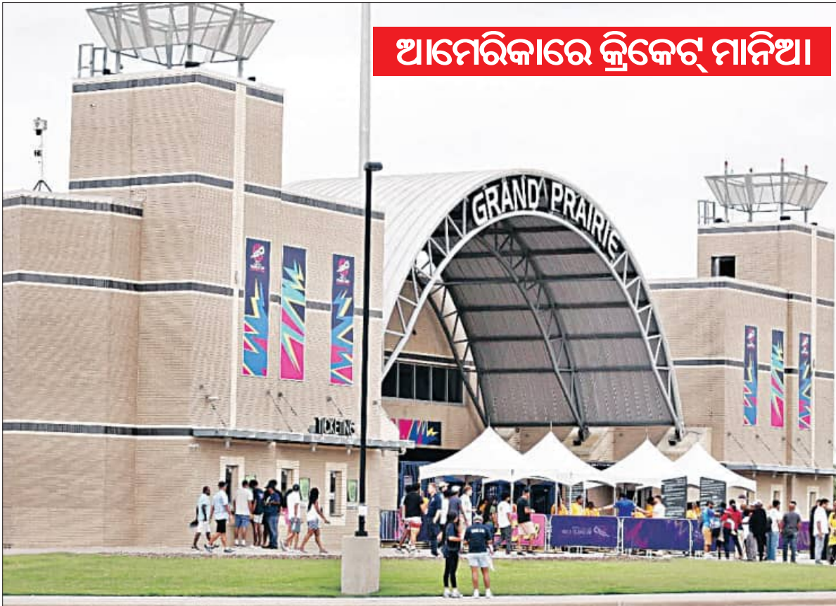
ଆମେରିକାରେ କ୍ରିକେଟ୍ ମାନିଆ