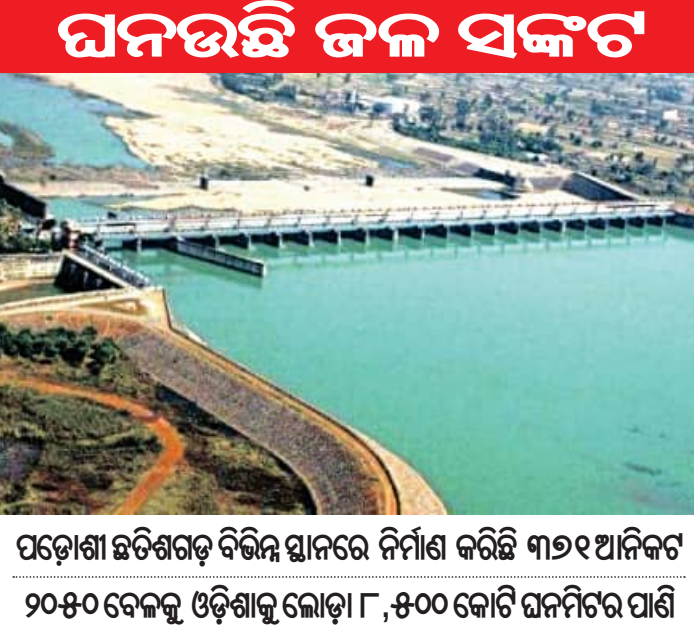
ଘନଉଛି ଜଳ ସଙ୍କଟ

■ ଭୁବନେଶ୍ୱର, ୨୬।୬ (ସମ୍ପାଦକ): ୨୦୫୦ ମସିହା ବେଳକୁ ରାଜ୍ୟରେ ଭୟଙ୍କର ହେବ ଜଳ ସ୍ଥିତି। ପାନୀୟ ଜଳ ଓ ଚାଷ ପାଇଁ ଅନୁ୍ୟନ ୮,୫୦୦ କୋଟି (୮୫ ବିଲିଅନ) ଘନମିଟର ପାଣି ଲୋଡ଼ା ପଡ଼ିବ। ଚାଷ ପାଇଁ ପାଖାପାଖି ୫୦୦୦ କୋଟି (୫୦ ବିଲିଅନ) ଘନମିଟର ଏବଂ କଳକାରଖାନା ଓ ଘରୋଇ ଆବଶ୍ୟକତା ନିମନ୍ତେ ଅବଶିଷ୍ଟ ୩୫୦୦ କୋଟି (୩୫ ବିଲିଅନ) ଘନମିଟର ପାଣି ଆବଶ୍ୟକ ହେବ। ଏହି ସ୍ଥିତିରେ ଓଡ଼ିଶାର ମୁଖ୍ୟ ଜଳ ଉତ୍ସ କୁହାଯାଉଥିବା ମହାନଦୀର ଉପରମୁଣ୍ଡରେ ଛତିଶଗଡ଼ ଉପରେ ଗୋଟିକ ପରେ ଗୋଟିଏ ଜଳ ପ୍ରକଳ୍ପ ନିର୍ମାଣ କରି ତାଲିଛି ତାହା ଆଗାମୀ ଦିନରେ ଓଡ଼ିଶାରେ ମହାନଦୀ ମୃତ ନଦୀରେ ପରିଣତ ହେବ ଓ ସାରା ଓଡ଼ିଶା ପାଣିପାଗଳି ଛଟପଟ ହେବ ବୋଲି ଆଶଙ୍କା କରାଯାଉଛି। ମହାନଦୀ ଉପରମୁଣ୍ଡରେ ପୂର୍ବର ମଧ୍ୟପ୍ରଦେଶ ଓ ଏବେ ଛତିଶଗଡ଼ ମୋଟ ୧୮ ୯୭ ବୃହତ୍, ମଧ୍ୟ ଓ କ୍ଷୁଦ୍ର ଜଳସେଚନ ପ୍ରକଳ୍ପ ନିର୍ମାଣ କରିଛନ୍ତି। ଏହାବ୍ୟତୀତ ବିଭିନ୍ନ ସ୍ଥାନରେ ୩୩୨ଟି ଆନିକଟ ମଧ୍ୟ ନିର୍ମାଣ ହୋଇଛି। ବିଡ଼ମ୍ବନା ହେଉଛି, ଏ ସମ୍ପର୍କରେ ଛତିଶଗଡ଼ ସରକାର ନା ଓଡ଼ିଶା ସରକାରଙ୍କ ସହ ଆଲୋଚନା କରିଛନ୍ତି, ନା କେନ୍ଦ୍ର ଜଳଶକ୍ତି (ପୂର୍ବର ଜଳସମ୍ପଦ ମନ୍ତ୍ରାଳୟ) ନା କେନ୍ଦ୍ରୀୟ ଜଳ