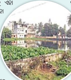
ପୁନରୁଦ୍ଧାର ବଦଳରେ ଯୋଗାଣ ଚାଲିଛି !

କଟକ, ୨୬.୬.୨୪(ସମିପ): ସହରରେ ଏକଦା ୧୪୬ଟି ଜଳାଶୟ ରହିଥିବା ବେଳେ ଏହା କାଳକ୍ରମେ କମି କମି ଚାଲିଥିଲା। ୯୦ଦଶକରେ ଯେଉଁଠି ମାତ୍ର ୪୨୪ ଜଳାଶୟ ଥିଲା। ୨୦୦୬ ଦେକକୁ ଏହା ୨୪୫କୁ ହ୍ରାସ ପାଇଥିଲା। ଏବେ ଏହା ୬୬ରେ ସୀମିତ ରହିଯାଇଛି। ମହାନଗର ନିଗମ ପ୍ରଶାସନ ମଧ୍ୟ ଏହାକୁ ପୂର୍ଣ୍ଣ କରିଛି। ଜଳାଶୟଗୁଡ଼ିକର ପୁନରୁଦ୍ଧାର କାର୍ଯ୍ୟ ମହାନଗର ନିଗମ ପକ୍ଷରୁ ହାତକୁ ନିଆଯାଇଥିଲେ ବି ସହରରେ ଏବେ ବି କଟକ ସହରରେ ୪୦ରୁ ଅଧିକ ପ୍ରାଚୀନ ଜଳାଶୟ ପରିତ୍ୟକ୍ତ ଅବସ୍ଥାରେ ପଡ଼ିରହିଛି। ଯେଉଁଗୁଡ଼ିକ ବ୍ୟବହାର ଅନୁପଯୋଗୀ। ମାତ୍ର ୨୦ରୁ କମ ବ୍ୟବହାର ଉପଯୋଗୀ ହୋଇ ରହିଛି।