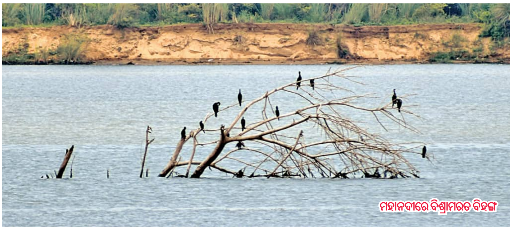
ମହାନଦୀରେ ବିଶ୍ରାମରତ ବିହଙ୍ଗ