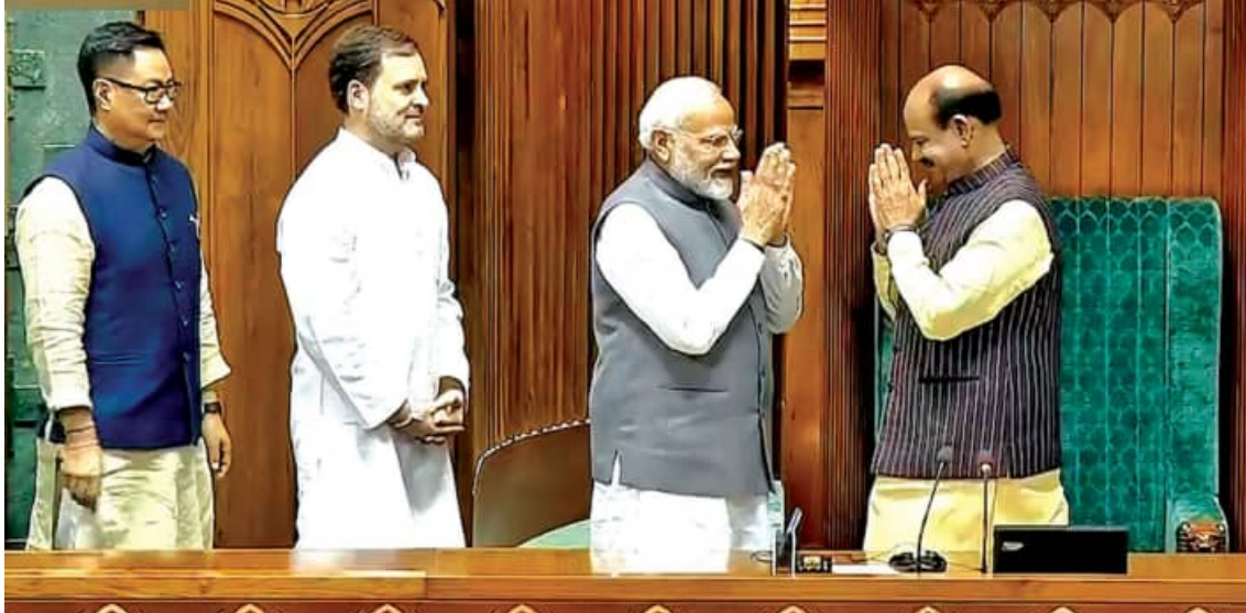
ନବ ନିର୍ବାଚିତ ବାତସ୍ପତିକୁ ଆସନ ଅଳଙ୍କାର କରିବା ପାଇଁ ଆମନ୍ତ୍ରଣ କରାଯାଇଥିବା ସୁଦ୍ଧା ନେତା ତଥା ପ୍ରଧାନମନ୍ତ୍ରୀ ନରେନ୍ଦ୍ର ମୋଦୀ, ବିରୋଧୀ ଦଳ ନେତା ରାହୁଲ ଗାନ୍ଧୀ ଏବଂ ସଂସଦୀୟ ବ୍ୟାପାର ମନ୍ତ୍ରୀ କିରନ ରିଜିକୁ