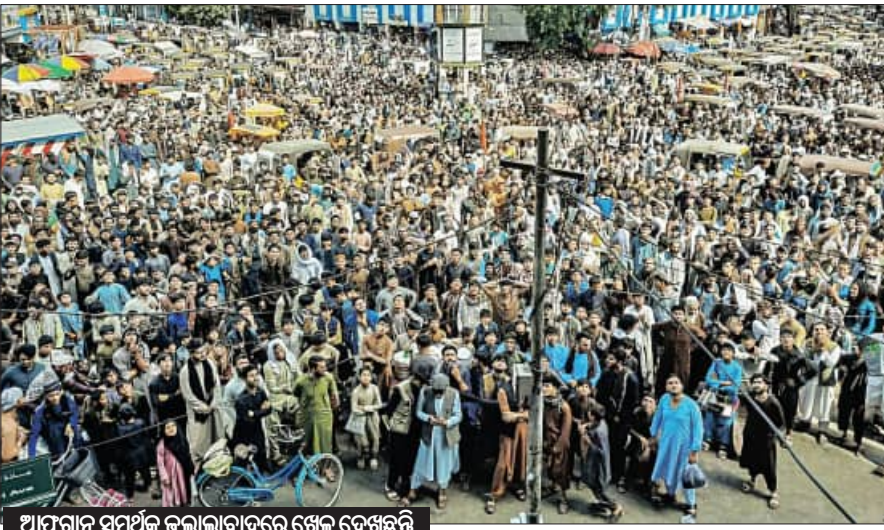
ଆଫଗାନ ସମର୍ଥକ ଜାଲପାଟଣାରେ ଖେଳ ଦେଖୁଛନ୍ତି