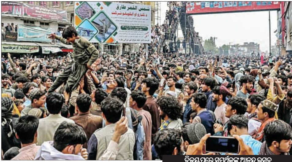
ବିଜୟ ପରେ ସମର୍ଥକ ଆନନ୍ଦ ଉତ୍ସବ