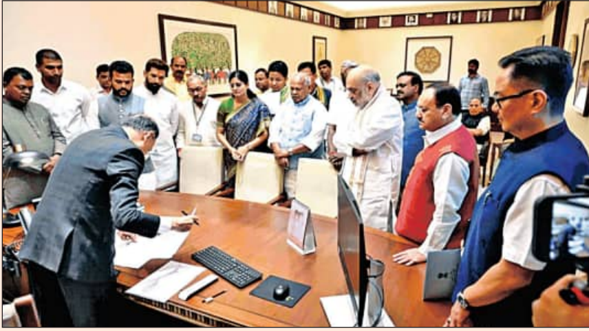
୪୮ ବର୍ଷ ପରେ ଲୋକସଭାରେ ହେବ ବାଚସ୍ପତି ନିର୍ବାଚନ