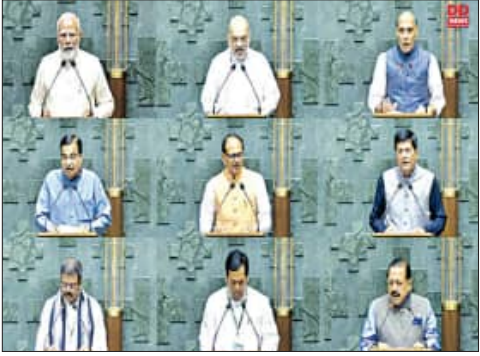
ଶପଥପାଠ କରାଇଲେ କାମଚଳା ବାଚସ୍ପତି ଉତ୍ତରୀ ପହଞ୍ଚାଇବା

■ ନୂଆଦିଲ୍ଲୀ, ୨୪।୬ (ଏକେଡି): ଅଷ୍ଟାଦଶ ଲୋକସଭାର ପ୍ରଥମ ଚର୍ଚ୍ଚା ସ୍ୱତନ୍ତ୍ର ଅଧିବେଶନ ସୋମବାର ଆରମ୍ଭ ହୋଇଛି। ଅଧିବେଶନର ପ୍ରଥମ ଦିନରେ ପ୍ରଧାନମନ୍ତ୍ରୀ ନରେନ୍ଦ୍ର ମୋଦୀଙ୍କ ସମେତ ୨୮୦ ସାଂସଦ ଶପଥ ନେଇଛନ୍ତି। ରାଷ୍ଟ୍ରପତି ଦ୍ରୌପଦୀ ମୁର୍ମୁଙ୍କ ଦ୍ୱାରା ସାଂସଦ ଉତ୍ତରୀ ପହଞ୍ଚାଇ ଦିଆଯାଇଥିବା ବେଳେ ସେ ନବ ନିର୍ବାଚିତ ସାଂସଦମାନଙ୍କୁ ଶପଥ ପାଠ କରାଇଛନ୍ତି। ଲୋକସଭାର ନେତା ଭାବେ ପ୍ରଥମେ ପ୍ରଧାନମନ୍ତ୍ରୀ ନରେନ୍ଦ୍ର ମୋଦୀ ଶପଥ ନେବା ପରେ କେନ୍ଦ୍ର ମନ୍ତ୍ରୀମଣ୍ଡଳର ବରିଷ୍ଠ ସଦସ୍ୟ ଏବଂ ପରେ ପରେ ଅନ୍ୟ ସାଂସଦମାନେ ଶପଥ ନେଇଥିଲେ।