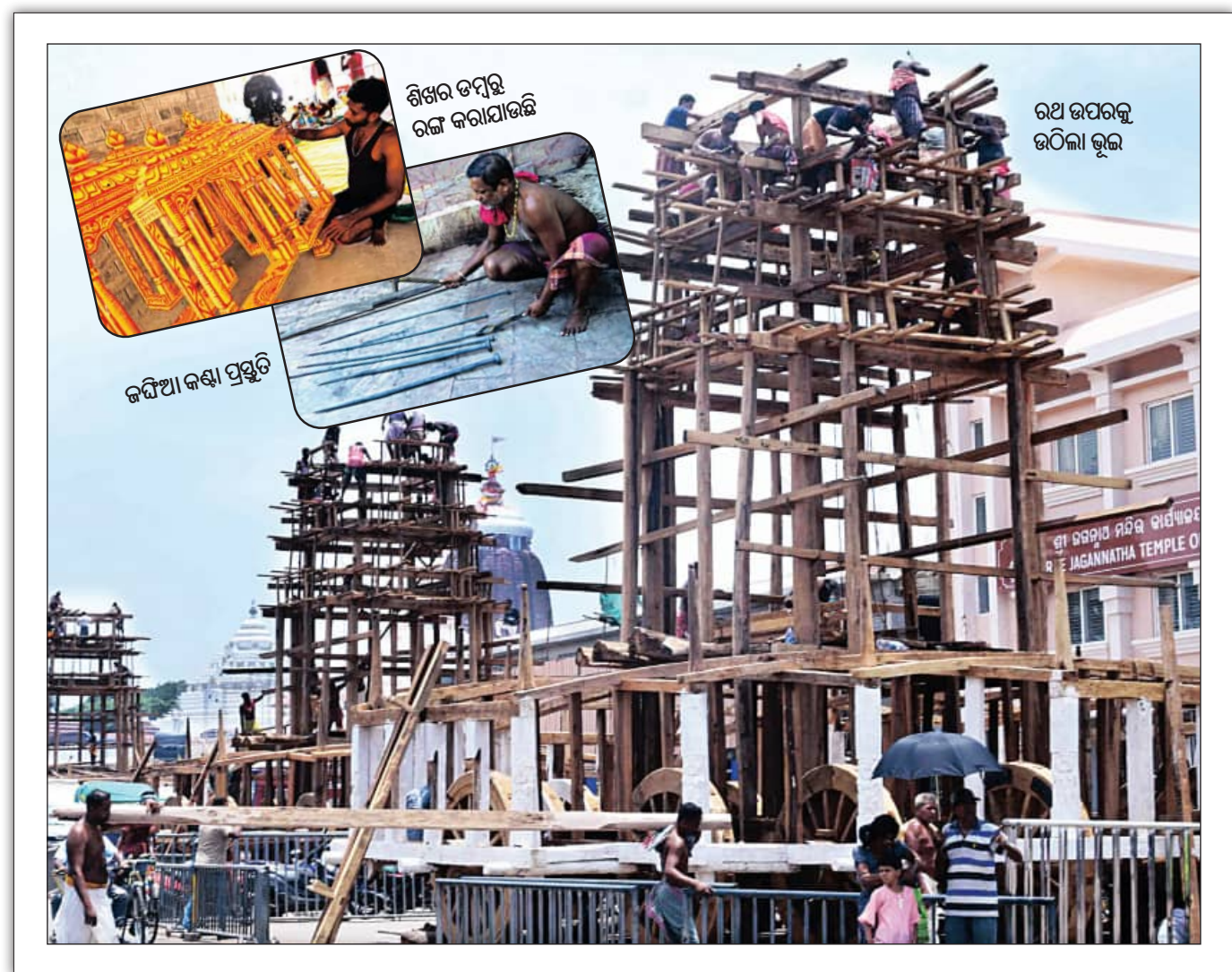
ରଥ ଉପରକୁ ଉଠିଲା ଭୁଲ

ଗାରମାଳ ଖୋଲାଯାଇଥିଲା। ରଥଟଣା ଆରମ୍ଭ ପ୍ରତୀକ୍ଷା କରାଯାଇଛି। ରଥଟଣା ଆରମ୍ଭ ପ୍ରତୀକ୍ଷା କରାଯାଇଛି। ରଥଟଣା ଆରମ୍ଭ ପ୍ରତୀକ୍ଷା କରାଯାଇଛି।