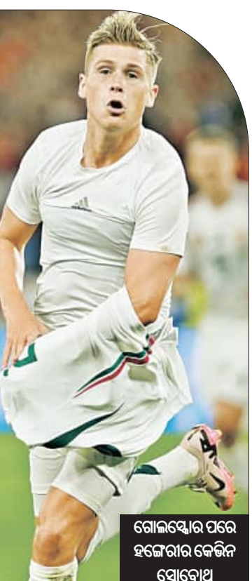
ଗୋଲକେପରେ ହଜ୍ଜେରା କେଟିନ ସୋବୋଥ୍

ତୃତୀୟ ଓ ଚତୁର୍ଥ ସ୍ଥାନରେ ରହିଛନ୍ତି। ଚୂର୍ଣ୍ଣମେଣ୍ଟ ନିୟମ ଅନୁଯାୟୀ ପ୍ରତ୍ୟେକ ଗୁପ୍ରେ ଦୁଇ ଶ୍ରେଣୀ ଦଳ ପ୍ରି-କ୍ୱାର୍ଟରକୁ ଉଠାଏ ହେବ। ଏହା ଫଳରେ ୧୨ଟି ଦଳ ସିଧାସଳଖ ପ୍ରି-କ୍ୱାର୍ଟରରେ ପ୍ରବେଶ କରିବେ। ଏହା ପରେ ତୃତୀୟ ସ୍ଥାନରେ ଥିବା ଶ୍ରେଣୀ ୪ଟି ଦଳକୁ