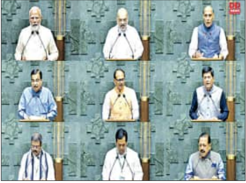
ଶପଥପାଠ କରାଇଲେ କାମଚଳା ବାଚସ୍ପତି ଉତ୍ତରୀ ପହଞ୍ଚାଇ

■ ନୂଆଦିଲ୍ଲୀ, ୨୪।୬ (ଏକେଡି): ଅଷ୍ଟାଦଶ ଲୋକସଭାର ପ୍ରଥମ ଚର୍ଚ୍ଚା ସୁଚନା ଅଧିବେଶନ ସୋମବାର ଆରମ୍ଭ ହୋଇଛି। ଅଧିବେଶନର ପ୍ରଥମ ଦିନରେ ପ୍ରଧାନମନ୍ତ୍ରୀ ନରେନ୍ଦ୍ର ମୋଦୀଙ୍କ ସମେତ ୨୮୦ ସାଂସଦ ଶପଥ ନେଇଛନ୍ତି। ରାଷ୍ଟ୍ରପତି ଦ୍ରୌପଦୀ ମୂର୍ମୁଙ୍କ ଦ୍ୱାରା ସାଂସଦ ଉତ୍ତରୀ ପହଞ୍ଚାଇ ଦିଆଯାଇଥିବା ବେଳେ ସେ ନବ ନିର୍ବାଚିତ ସାଂସଦମାନଙ୍କୁ ଶପଥ ପାଠ କରାଇଛନ୍ତି। ଲୋକସଭାର ନେତା ଭାବେ ପ୍ରଥମେ ପ୍ରଧାନମନ୍ତ୍ରୀ ନରେନ୍ଦ୍ର ମୋଦୀ ଶପଥ ନେବା ପରେ କେନ୍ଦ୍ର ମନ୍ତ୍ରୀମଣ୍ଡଳର ବରିଷ୍ଠ ସଦସ୍ୟ ଏବଂ ପରେ ପରେ ଅନ୍ୟ ସାଂସଦମାନେ ଶପଥ ନେଇଥିଲେ।