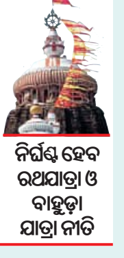
ନିର୍ଦ୍ଦେଶ ହେବ ରଥଯାତ୍ରା ଓ ବାହୁଡ଼ା ଯାତ୍ରା ନାତି

■ ପୁରୀ, ୨୪।୬ (ସମିପ): ମଙ୍ଗଳବାର ଶ୍ରୀମନ୍ଦିର ପରିଚାଳନା କମିଟି ବୈଠକ ଅନୁଷ୍ଠିତ ହେବ। ନାଳାଦ୍ୱି ଉକ୍ତନିବାସ ପରିସରରେ ପୂର୍ବାହ୍ନ ୧୧ଟାରେ ଗଜପତି ମହାରାଜା ଦିବ୍ୟସିଂହଦେବଙ୍କ ଅଧ୍ୟକ୍ଷତାରେ ଅନୁଷ୍ଠିତ ହେବାକୁ ଥିବା ବୈଠକରେ ରଥଯାତ୍ରା ଏବଂ ବାହୁଡ଼ା ଯାତ୍ରାର ନାତି ନିର୍ଦ୍ଦେଶ ହେବ। ଏଥିସହ ରଥଯାତ୍ରା ଏବଂ ବାହୁଡ଼ା ଯାତ୍ରା ବ୍ୟବସ୍ଥାବଳୀ ସମ୍ପର୍କରେ ବିଷ୍ଣୁ ଭାବେ ଆଲୋଚନା କରାଯାଇ ତାହାକୁ ଅନୁମୋଦନ କରାଯିବ। ସ୍ୱାମୀ ପୂର୍ଣ୍ଣିମା ଶେଷ ହୋଇଛି। ତେଣୁ ବୈଠକରେ ରଥଯାତ୍ରା, ହୋରପଞ୍ଚମୀ, ସନ୍ଧ୍ୟା ଦର୍ଶନ, ବାହୁଡ଼ା ଯାତ୍ରା, ସୁନାବେଶ, ଅଧରପଣା ଓ ନାଳାଦ୍ୱିବିକେ ନାତିକାନ୍ତି ସମ୍ପର୍କରେ ବିଷ୍ଣୁ ଭାବେ ଆଲୋଚନା କରାଯିବ। ଏବର୍ଷ ଅଧିକ ଉକ୍ତ ସମାଗମ ହେବା ସମ୍ଭାବନା ଥିବାରୁ ଏହାକୁ ଦୃଷ୍ଟିରେ ରଖି