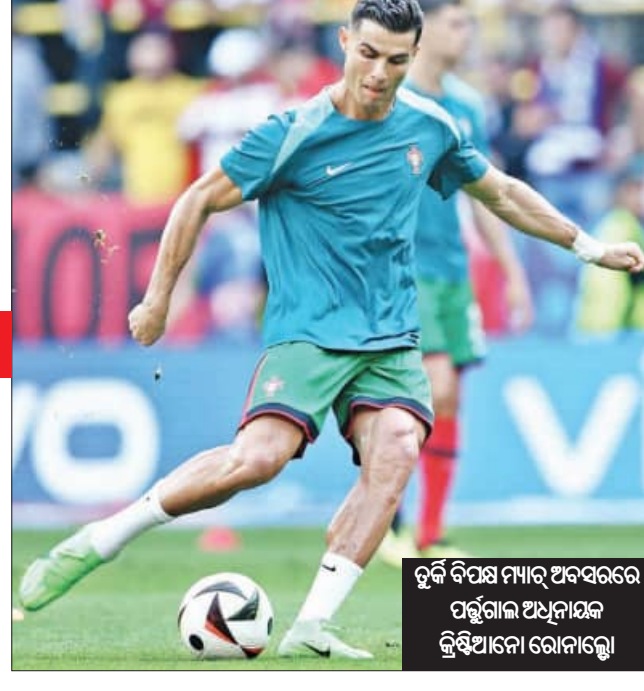
ଦୁଇ ବିପକ୍ଷ ମ୍ୟାଚ୍ ଅବସରରେ ପରୁଗୋଲ୍ ଅଧିନାୟକ କ୍ରିଷ୍ଟିଆନୋ ରୋନାଲ୍ଡୋ

ଏହାପରେ ୫୯ତମ ମିନିଟ୍‌ରେ ଚେକ୍ ଗଣରାଜ୍ୟର ପାଟ୍ରିକ୍ ସିକ୍ ଗୋଲ ଦେଇ ମ୍ୟାଚ୍‌କୁ ବରାବର ସ୍ଥିତିକୁ ଆଣିଥିଲେ। ପୂର୍ବରୁ ଜର୍ଜିଆ ଓ ଚେକ୍ ଗଣରାଜ୍ୟ ସେମାନଙ୍କ ପ୍ରଥମ ମ୍ୟାଚ୍‌ରେ ଯଥାକ୍ରମେ ଦୁଇଠାରୁ ୧-୩ ଓ ପରୁଗୋଲଠାରୁ ୧-୨ ଗୋଲରେ ପରାସ୍ତ ହୋଇଥିଲା। ତେଣୁ ଦୁଇ ଦଳ ପାଇଁ ବିଜୟ ବେଶ୍ ଗୁରୁତ୍ୱପୂର୍ଣ୍ଣ ଥିଲା। ଜର୍ଜିଆ ଏବେ ତୀର ପରବର୍ତ୍ତୀ ମୁକାବିଲାରେ ୨୬ ତାରିଖ ଗୁରୁବାର ପରୁଗୋଲ୍ ଓ ଚେକ୍ ଗଣରାଜ୍ୟ ଏହି