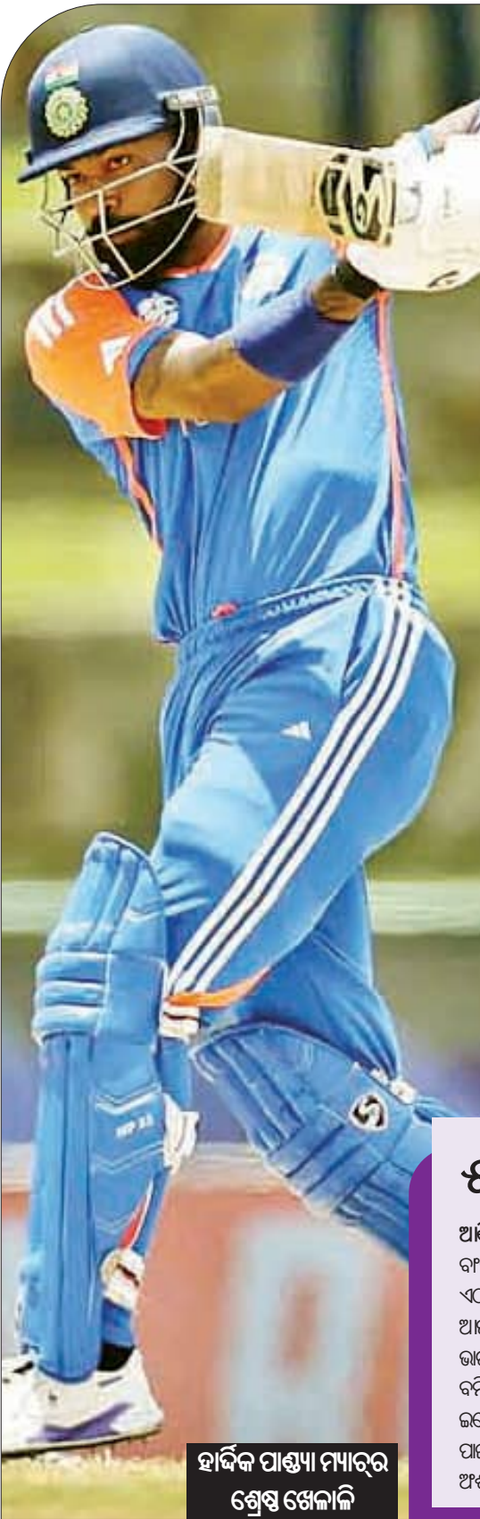
ହାର୍ଦ୍ଦିକ ପାଣ୍ଡା ମ୍ୟାଚ୍ରେ ଶ୍ରେଷ୍ଠ ଖେଳାଳି