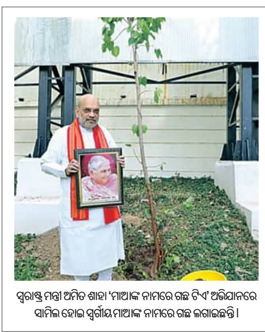
ସୁରାଷ୍ଟ୍ର ମନ୍ତ୍ରୀ ଅମିତ ଶାହା 'ମାଆଙ୍କ ନାମରେ ଗଛ ଟିଏ' ଅଭିଯାନରେ ସାମିଲ ହୋଇ ସୁରାଷ୍ଟ୍ର ମାଆଙ୍କ ନାମରେ ଗଛ ଲଗାଇଛନ୍ତି ।

କାର୍ଯ୍ୟାନୁଷ୍ଠାନର ସମୟକୁ ନେଇ ଚର୍ଚ୍ଚା ଠିକ୍ ଏହି ସମୟରେ ରିରପ ହୋଇଥିଲେ ଚନ୍ଦ୍ରବାବୁ ମୁଖ୍ୟମନ୍ତ୍ରୀଙ୍କୁ ଏକଛତ୍ରଶାସକ କହିଲେ ଜଗନ ମୋହନ ପ୍ରତିଶୋଧର ରାଜନୀତି କରୁଛନ୍ତି ସରକାର