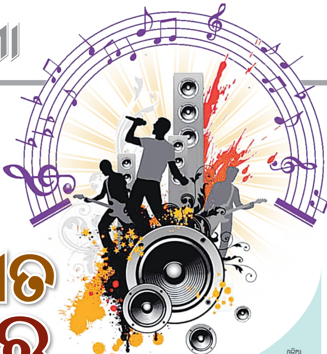
ଓଡ଼ିଆ ଗୀତଗୁଡ଼ିକର ଭିତ୍ତିଓକୁ ବିଭିନ୍ନ ଟ୍ୟାଲେଣ୍ଟ ମାଧ୍ୟମରେ ସ୍ଵତନ୍ତ୍ର କାର୍ଯ୍ୟକ୍ରମରେ ପ୍ରସାରିତ ହୋଇଛି । ତାହାକୁ ଆଖି ଆଗରେ ରଖି ଆଲବମ୍ ନିର୍ମାତାମାନେ ଅତିଶୁଦ୍ଧ ଯେତକ ଗୁରୁତ୍ଵ ଦେଲେ ତାର ଭିତ୍ତିଓ ବା ନୃତ୍ୟ ମାଧ୍ୟମରେ ଏହି ଗୀତକୁ ବେଶ୍‌ଲୋକାଳେ । ଯାହା ବେଶ୍‌ଲୋକପ୍ରିୟତା ସୃଷ୍ଟି କରିବାରେ ଏକ ପ୍ରମୁଖ ଭୂମିକା ନେଇ । ହେଲେ କିଛି ବର୍ଷ ହେବ ଆଲବମ୍ ଜଗତରେ ଏକ ପରିବର୍ତ୍ତନ ଦେଖା ଗଲାଣି । ଆଗରୁ ଯେଉଁ ଆଲବମ୍ କ୍ୟାସେଟ୍ ଆସୁଥିଲା ତାହା ଆଉ ବେଶ୍‌ବାକ୍ ମିଳୁନି । ଆହୁରି ମଧ୍ୟ ଭିତ୍ତିଓରେ ଏବେ ଯେଉଁମାନେ ଗୀତ ଗାଇଛନ୍ତି ସେମାନଙ୍କୁ ଏବଂ ସେମାନଙ୍କ ଭାବଜଙ୍ଗାକୁ ବେଶ୍‌ବାକ୍ ମିଳୁଛି । ଯାହାକି କେଉଁଠି ନା କେଉଁଠି ଦର୍ଶକଙ୍କ ଉପରେ ପ୍ରଭାବ ପକାଇଛି ।