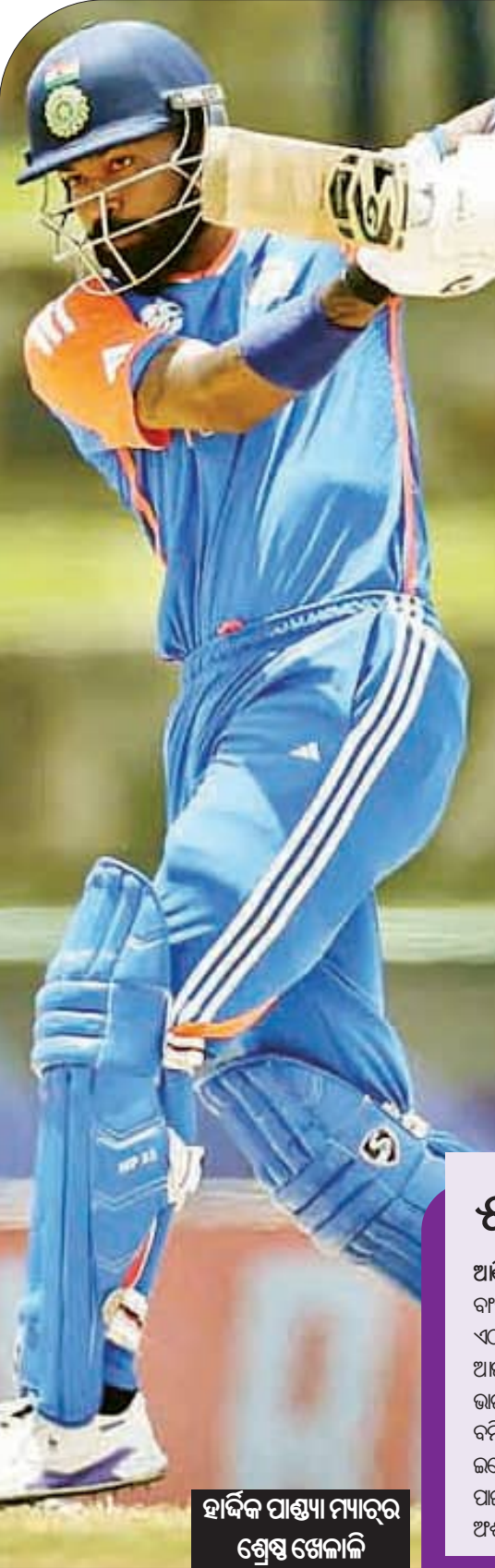
ହାର୍ଡିକ ପାଣ୍ଡା ମ୍ୟାଚ୍ରେ ଶ୍ରେଷ୍ଠ ଖେଳାଳି