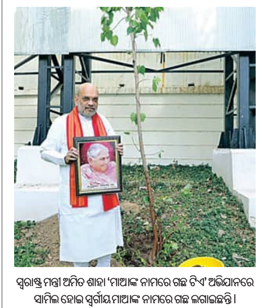
ସୁରାଷ୍ଟ୍ର ମନ୍ତ୍ରୀ ଅମିତ ଶାହା 'ମାଆଙ୍କ ନାମରେ ଗଛ ଟିଏ' ଅଭିଯାନରେ ସାମିଲ ହୋଇ ସୁରାଷ୍ଟ୍ର ମାଆଙ୍କ ନାମରେ ଗଛ ଲଗାଇଛନ୍ତି ।

କାର୍ଯ୍ୟାନୁଷ୍ଠାନର ସମୟକୁ ନେଇ ଚର୍ଚ୍ଚା ଠିକ୍ ଏହି ସମୟରେ ରିରପ ହୋଇଥିଲେ ତହସିଲଦାର ମୁଖ୍ୟମନ୍ତ୍ରୀଙ୍କୁ ଏକଛତ୍ରଶାସକ କହିଲେ ଜଗନ ମୋହନ ପ୍ରତିଶୋଧର ରାଜନୀତି କରୁଛନ୍ତି ସରକାର