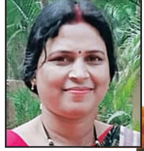
ସ୍ୱେଚ୍ଛାଳତା ଦାସ ଲେଙ୍କା